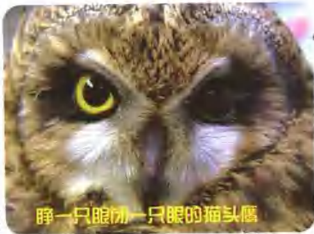
睁一只眼闭一只眼的猫头鹰