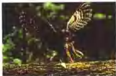
在黑夜中，一只猫头鹰正在捕杀白鼠。