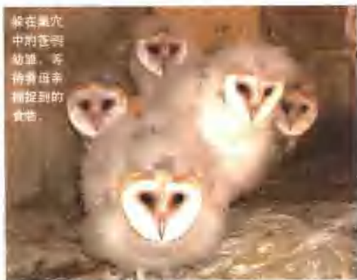
躲在巢穴中的鹰得幼雏，等待母亲捕捉到的食物。