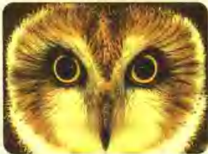
猫头鹰两只大大的眼睛具有良好的夜视能力。

大多数猫头鹰多是在夜间活动，它们可以凭借自己敏锐的视觉和听觉，在黑夜中捕猎。在漆黑的夜晚，猫头鹰那巨大的瞳孔比人的眼睛的能见度还要高出3倍。因为它的视网膜主要是由圆柱细胞构成的（人眼视网膜是由圆锥细胞构