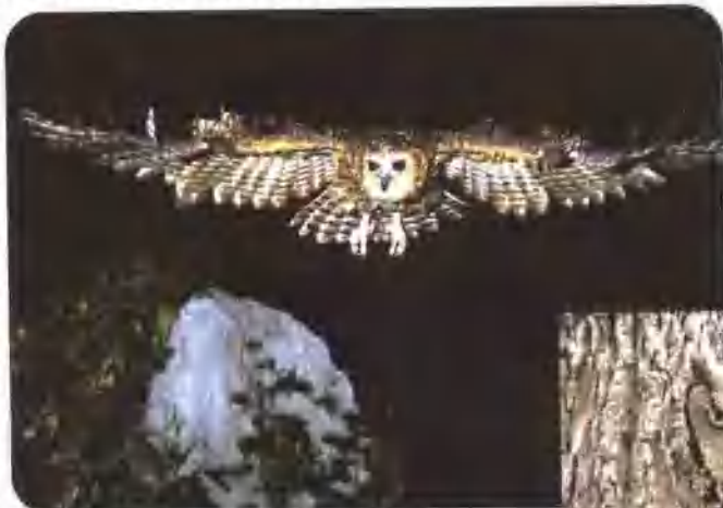
猫头鹰在夜晚异常活跃。

白天，猫头鹰一般都呆在废墟、树洞、岩缝或桥桩下，像修行的僧人。整个白天，它们都无精打采的，竟连对付叽叽喳喳的小麻雀，都显得力不从心。