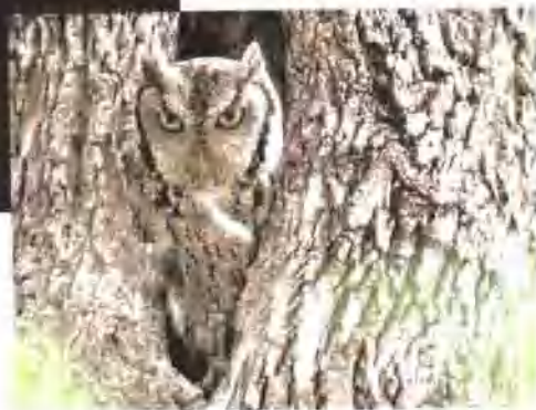
躲在树洞中的鸣角猫头鹰。

可是，每当夜幕降临时，它们便像注射了兴奋剂一样，精神一下子振奋起来，摇身一变成十分活跃的“猎手”。每晚它们都要飞过许多地方，沿着沟渠、树林和荒地的边缘来回搜捕，猎食它们喜欢的田鼠、仓鼠和家鼠。