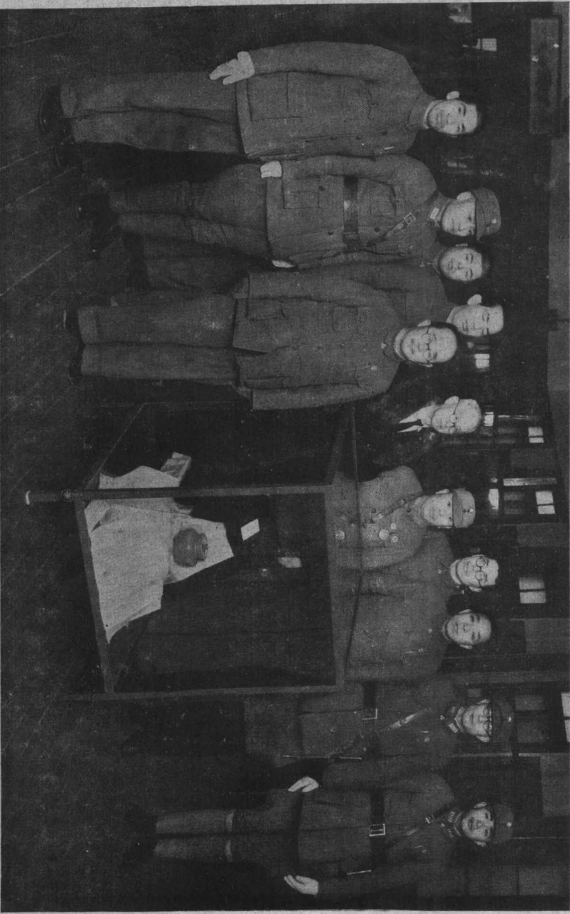
馬湘獻奉總理衣一襲燉品盅一隻