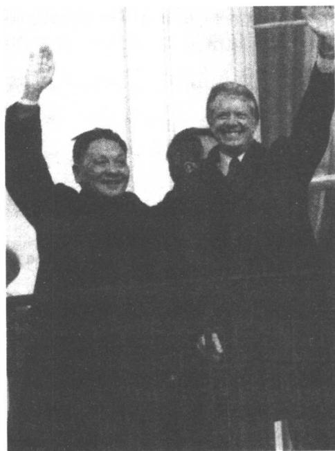
1979年1月邓小平与卡特在白宫

现在问题来了，有人说你这个中华人民共和国是个独裁政府、独裁国家。你们怎么搞一胎化呢？尤其美国的参议员说你无人道，人家小夫妻两个人想生男生女，生一个男的生一个女的，再生一个男的生一个女的，生两男