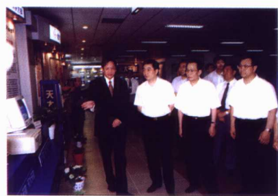
胡锦涛同志视察天大大财公司

天津大学是教育部直属国家重点大学，其前身为北洋大学，始建于1895年10月2日，是中国近代第一所大学，素以“实事求是”的校训与“严谨治学、严格教学要求”的校风而享誉海内外。1951年经院系调整定名为天津大学，是1959年中共中央、国务院首批指定的16所国家重点大学之一，也是我国“211工程”首批重点建设的院校之一。2000年，教育部和天津市人民政府签订共建协议，天津大学成为国家在新世纪重点建设的若干所国内外知名高水平大学之一。