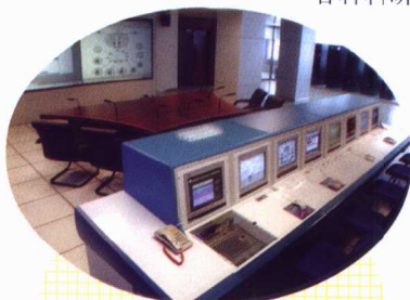
学校投资建设了覆盖所有学院的现代化的校园网，图为国内一流的校园网中心控制大厅

北京联合大学是1985年经教育部正式批准建立的市属综合性普通高等院校，其前身是1978年北京市依托在京重点大学创建的30多所大学分校，是伴随着改革开放，紧紧围绕首都经济建设和社会发展的需要而发展起来的，是以本科为主、学科门类较齐全的培养应用性人才的一所大学，是教育部确定的高职示范院校建设单位 and 全国职业教育师资培训重点建设基地，是北京市教委确定的重点建设的技术应用性人才培养基地，是新时代的应用性大学。