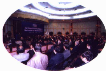
2004年4月，天津大学承办的第十一 届国际机构学与机器科学世界大会