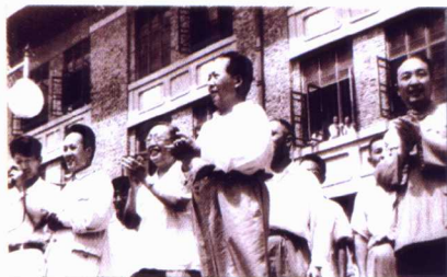
1958年8月13日，毛泽东主席 亲临天津大学视察