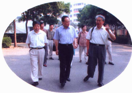
北京市委常委、教工委书记朱善璐同志来学校调研