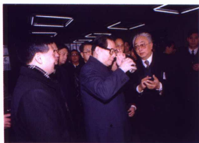
1994年12月13日，江泽民同志 视察天津大学