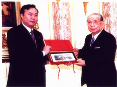
我校聘请了近百名国际知名专家学者为名誉教授，图为党委书记徐建培教授向国际知名人士、日本创价学会会长池田大作先生颁发聘书