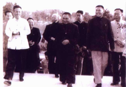
1958年10月9日，邓小平同志 视察天津大学