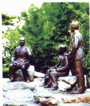
吴玉章和学生在一起的塑像

2002年4月28日，江泽民同志在李岚清、贾庆林等领导同志的陪同下视察中国人民大学，并亲自主持师生座谈会，发表了关于发展繁荣哲学社会科学的重要讲话，要求我校建设成为以人文社会科学为主的世界知名的一流大学