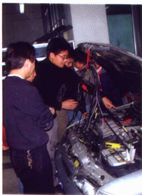
学生正在进行汽车实训