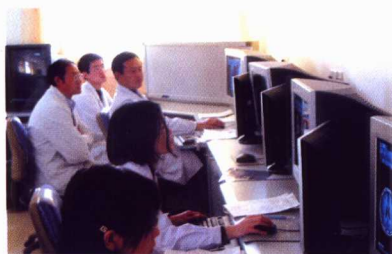
我校医学院附属医院建有设施先进的医学影像分析中心，可以随时与国外同行专家开展合作科研、合作医疗等工作