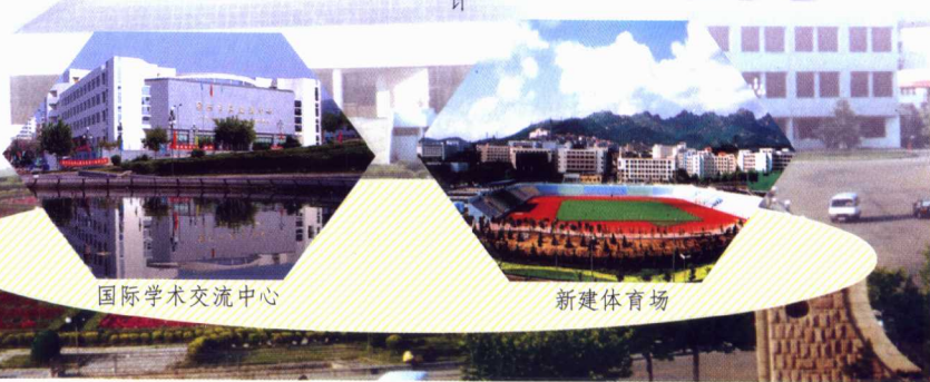
国际学术交流中心