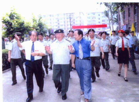
原中共中央政治局委员、中央军委副主席兼国防部长迟浩田上将来我院视察