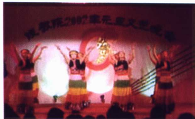
丰富多彩的课外生活