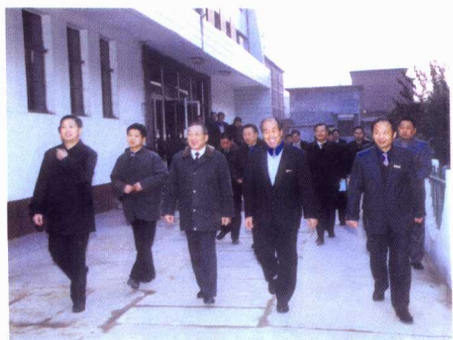
原中共中央政治局常委、国务院副总理李岚清来我院视察