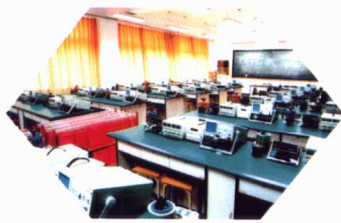
学校建有配备先进的教学实验中心