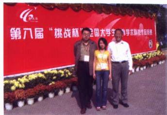
我校学生获2003年第八届“挑战杯”全国大学生课外学术科技作品竞赛二等奖