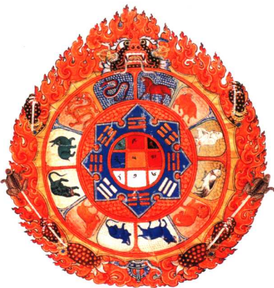
布画唐卡《十二生肖图》

缂丝唐卡和贴花唐卡四类。贴花唐卡是把彩缎剪成各种图案，粘贴在缎面或布面上，又称为“堆绣”。“堆绣”在青海藏区非常盛行，堆绣、壁画和酥油花并称为藏传佛教著名寺院塔尔寺艺术