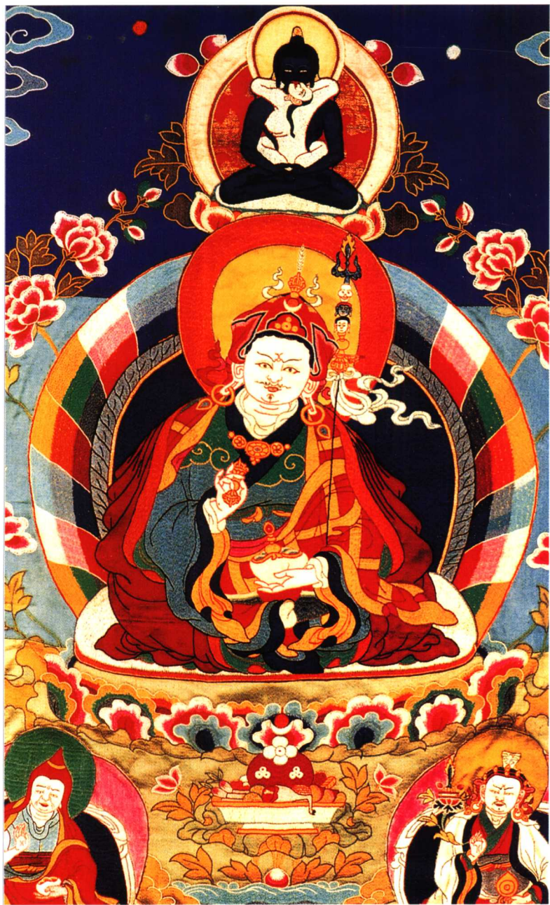
贴花唐卡《堪洛却松(师君三尊)像》