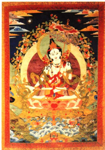
贴花唐卡《大白伞盖佛母像》