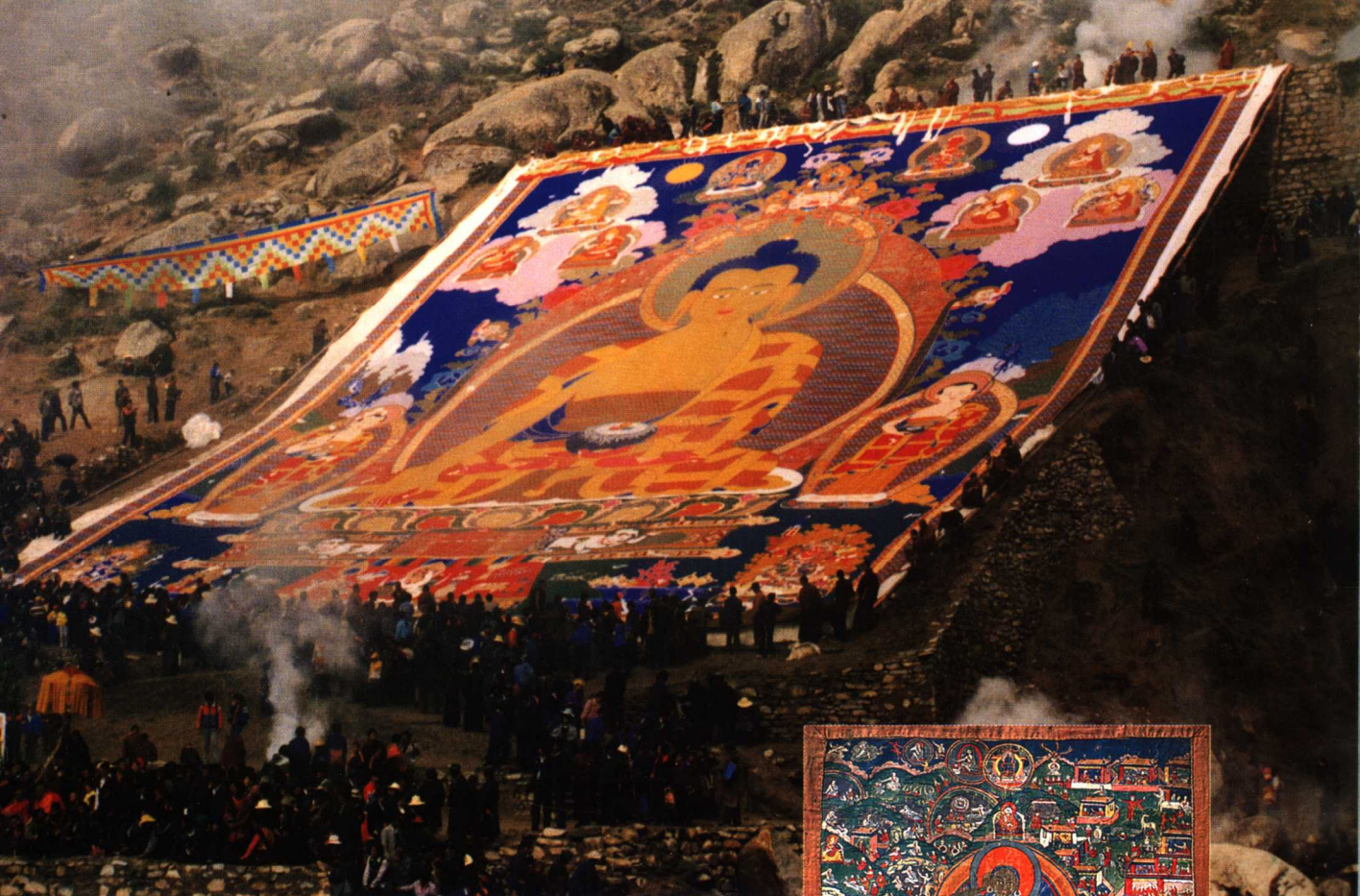
巨型堆绣唐卡《释迦牟尼佛像》(宽75米×高55米)