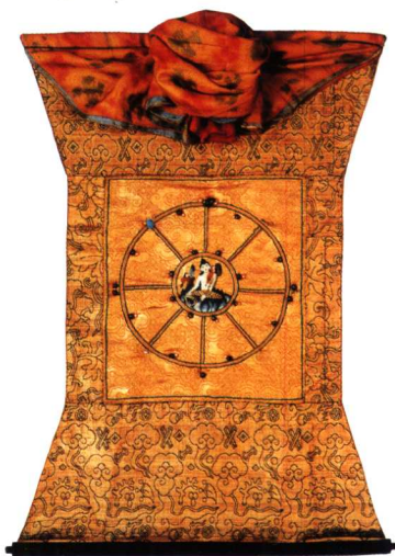
刺绣唐卡《静息观世音像》