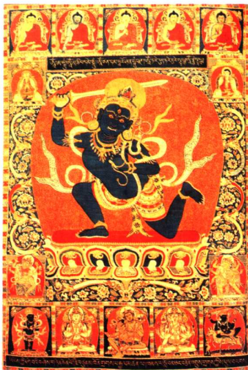
缂丝唐卡《不动明王像》

总的来说,唐卡绘制是藏族传统文化《十明》的组成部分,《十明》分大五明和小五明,大五明是工巧明、医方明、声律学、正理学和佛学,唐卡绘画属工巧明。著名的《三经一疏》,即《绘画度量经》、《造像度量经》、《造像度量经疏》等,是绘制各种唐卡佛画的依据。各个时期绘画大师们的杰出成就,在于在《三经一疏》的基础上融汇贯通,形神兼妙,有所突破和创新,形成自