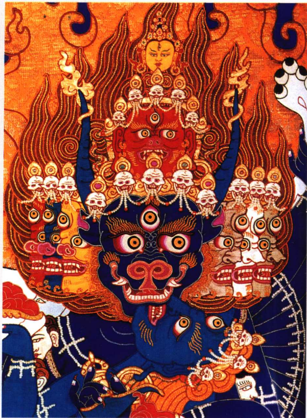
贴花唐卡《大威德金刚像》(局部)