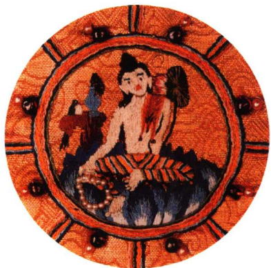
《静息观世音像》(局部)