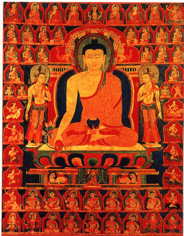
古格时期布画唐卡《药师佛像》