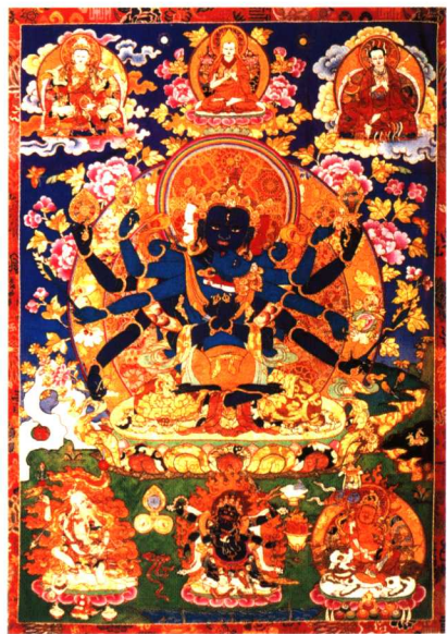
贴花唐卡《密集金刚像》(又称集密金刚)