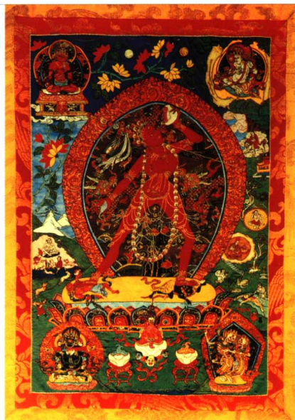
刺绣唐卡《空行母像》