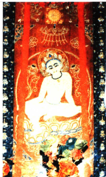
昌珠寺珍藏的珍珠串制唐卡《观音》