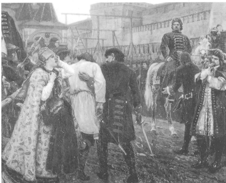
近衛軍臨刑的早晨(局部) 1881 年 V.I. 蘇里柯夫

列維坦是生長在俄國的猶太人，雙親早亡的痛苦童年似乎已埋下了風格形成的種子，他對大自然更多地傾叙了愛慕之情。在他留下的大批風景作品中，時而高雅幽深，時而渺茫恍惚，時而沉寂靜鬱，時而又淒涼暗淡。總之，與希施金的風格相比，更富有詩意的描繪。他畫的《三月》給人帶來萬物甦醒的愉悅感受，溫暖的陽光、融化的雪地、清新的空氣和矯健的樹木，一切都表現得那樣完美。他畫的《符拉基米爾卡》是通向西伯利亞的流放之路，陰霾的天空和漫長的道路似乎給人感覺到進步知識分子對現實不滿的痛苦和壓抑，以致有人把它稱為“俄國的歷史風景畫”。《墓地的上空》是列維坦最有特色的代表作品，墓地的