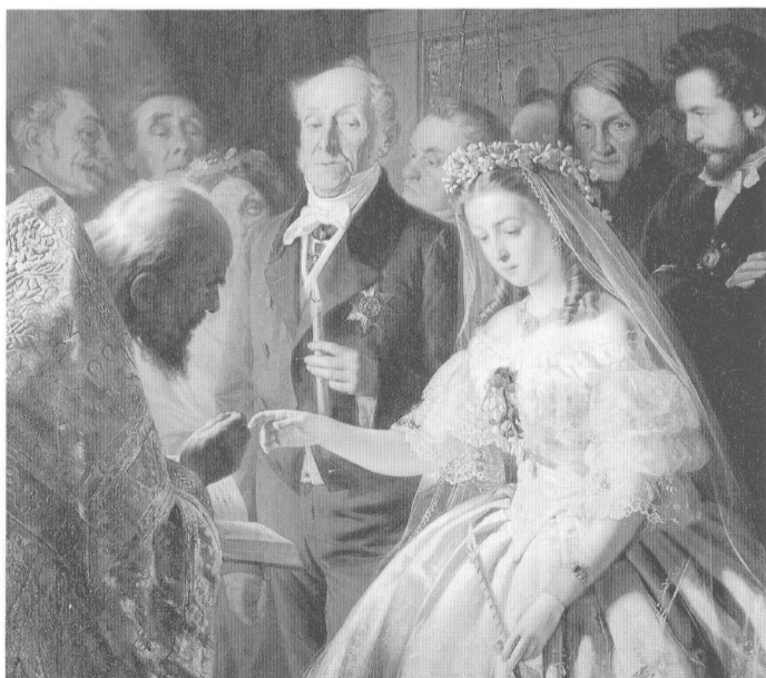
不相稱的婚姻(局部) 1862年 V.V. 普基廖夫