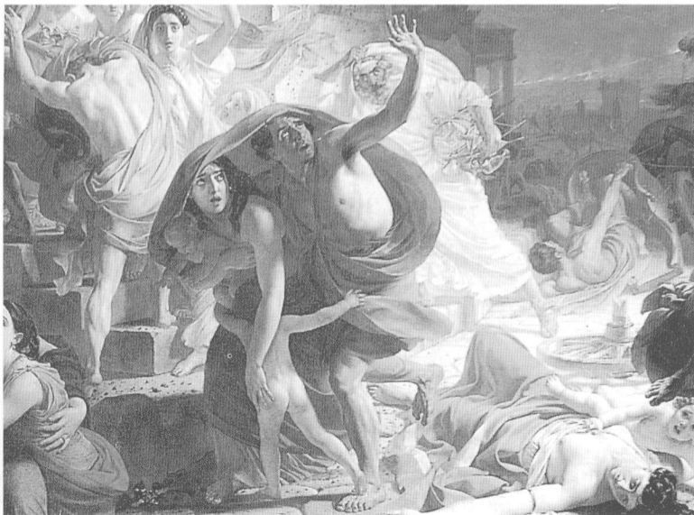
龐貝的末日(局部) 1833 年 K. P. 布留洛夫

伊凡諾夫在學生時代創作的《約瑟夫在獄中的詳夢》就以嫺熟的技法而轟動彼得堡。車爾尼雪夫斯基曾稱他“不僅是一個在才能上不虛傳，而且在思想方法上值得一切善良人們崇敬和仰慕的人”。他的代表作《基督顯聖》幾乎耗去了畫家 20 年時間。作品取材於聖經故事，講的是預言者約翰指着遠方而來的基督，向在約旦河邊接受洗禮的教徒們說道：那個走來的人，便是“能拯救你們的人”。畫面構圖以約翰為中心，在他的身後是一些未來的聖者，畫面的左邊和