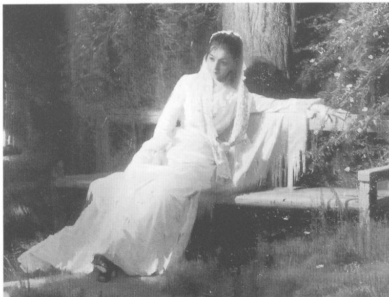
月夜(局部) 1880年 I.N. 克拉斯柯依

蘇里柯夫的成名作是《近衛軍臨刑的早晨》。它表現的是彼得大帝時代，保守勢力的代表近衛軍反對彼得的世俗改革，後遭其鎮壓的歷史事件。作品客觀地表現了這兩種力量的衝突，對勝利者的彼得和失敗者的近衛軍都未作絲毫人為的褒貶，從而就已突破了對歷史畫意義的一般性見解。《緬希柯夫在別留佐夫鎮》也是表現的彼得大帝前後的俄羅斯歷史事件。彼得大帝剛剛死去，其行使改革的重要助手緬希柯夫和他的全家就被安娜女皇流放到西伯利亞的小鎮別留佐夫。這位昔日的操權者，已是英雄無用武之地。然而，他在痛苦的沉思