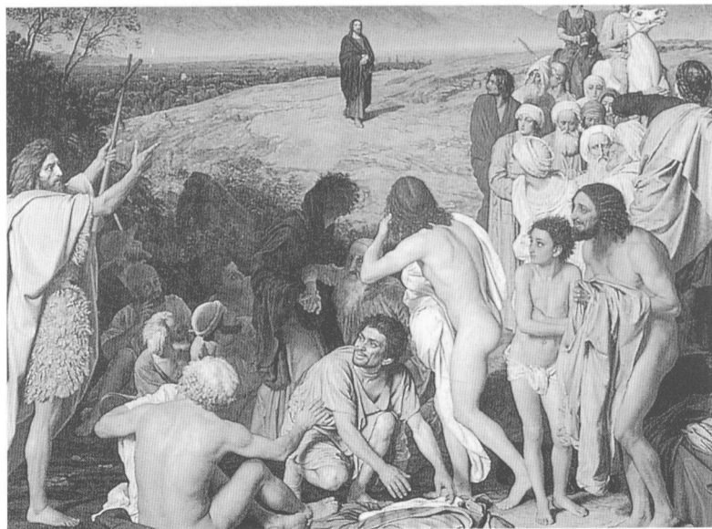
基督顯聖(局部) 1837—1857年 A. A. 伊凡諾夫