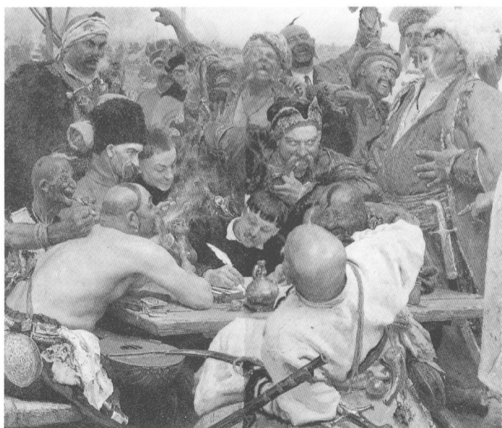
查波羅什人寫信給蘇丹王(局部)