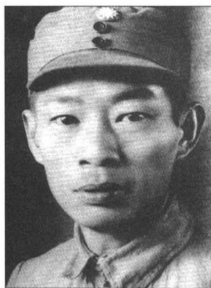
新四军副参谋长周子昆