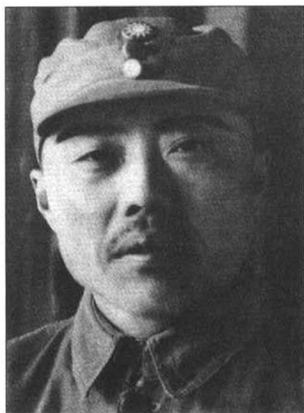
新四军副军长项英