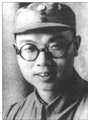
新四军政治部主任袁国平