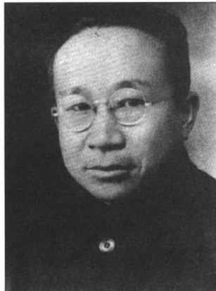
新四军参谋长兼第三支队司令员张云逸