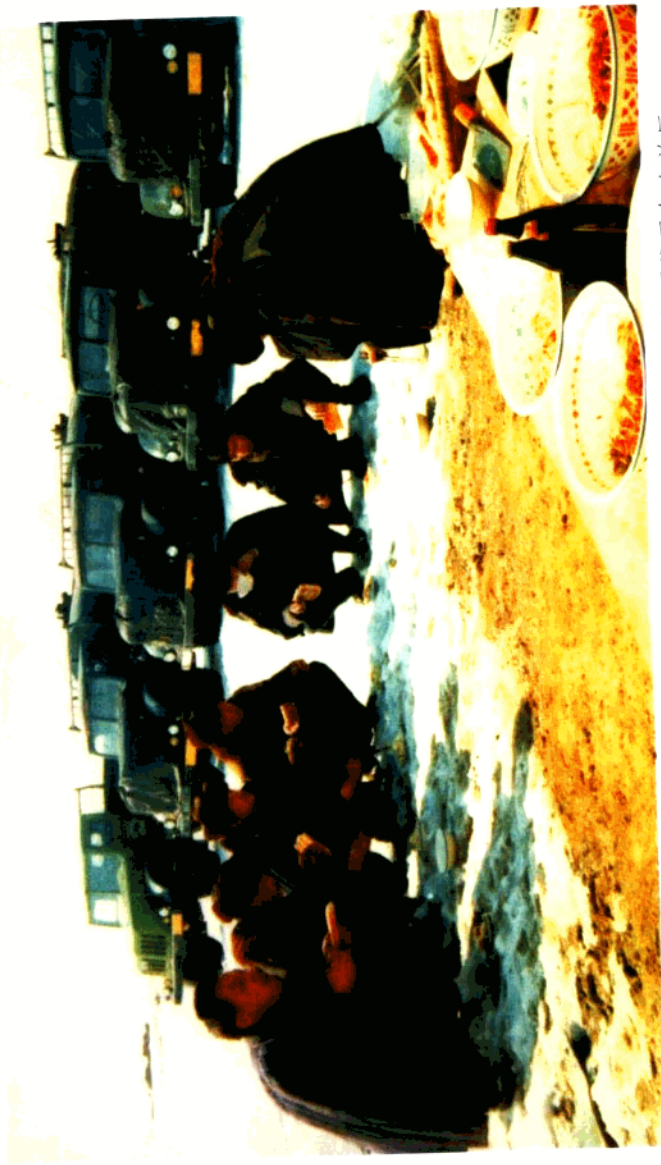
70年代中期，石油运输战士风餐露宿、千里跋涉，多次圆满完成新疆维吾尔自治区党委安排的从北疆向南疆抢运成品油的任务