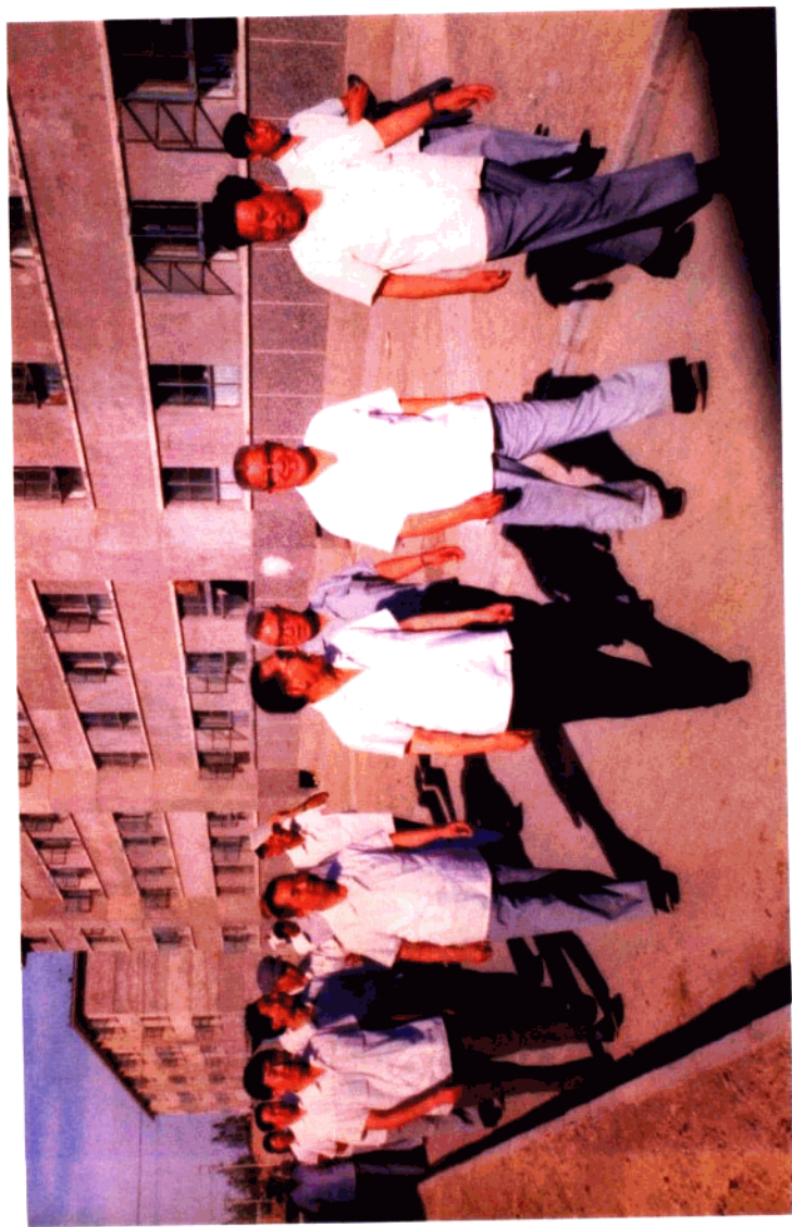
1983年8月国务委员康世恩同志(1排左1)在石油工业部副部长李敬 (2排左1)陪同下,到运输公司检查指导工作