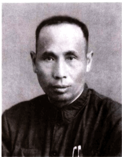
张复振——中国人民解放军原石油工程第一师师长，原石油工业部运输公司经理、党委书记