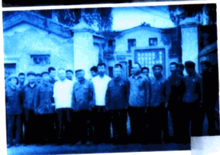
1978年8月原石油工程第一师 第三团代政治委员,原石油工 业部部长宋振明同志到石油工 业部运输公司检查指导工作并 与部分领导干部合影