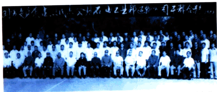
1983年8月国务委员康世恩同志会见石油工业部运输公司干部时合影