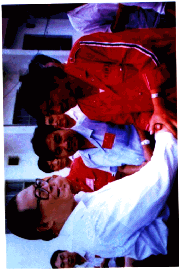
1993年8月23日，中共中央总书记江泽民同志在视察新疆塔里木石油探区时，亲切接见中国石油天然气运输公司参战职工代表王万兴同志