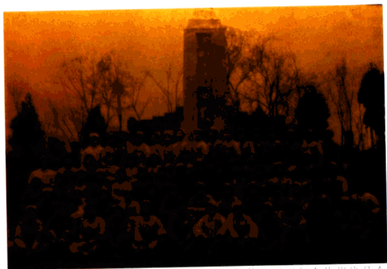
1953年3月中国人民解放军石油工程第一师第三团团部全体指战员合影