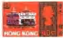
H21 海上交通工具，1968年4月24日