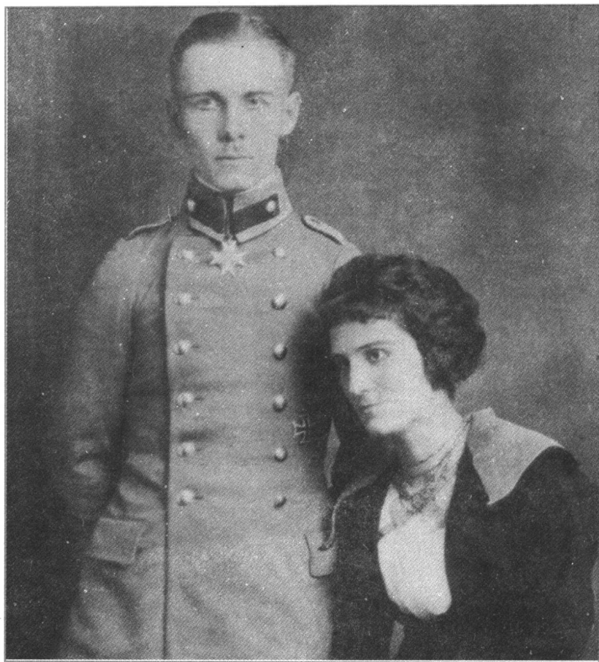
←1917年，年轻的隆美尔获得他渴望已久的十字勋章。这是他从前线回来后与妻子的合影。

在长达4年之久的残酷厮杀中，作为下级军官的隆美尔显示了自己的战术风格：先发制人并不惜冒一切风险，千方百计渗透到敌防线后方动摇其决心，巧妙地发扬火力并尽量夺取敌人的弹药。他悍勇倔强、狡诈多谋、拼命追逐荣誉，在战火中显露出了锋芒。