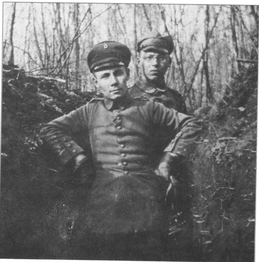
→第一次世界大战中隆美尔在法国作战时受伤，康复后与战友合影。

意大利北部地势险要，峰峦叠嶂，河流湍急，与法国的大平原截然不同。德军的目的就是要消灭意军于伊松索河。冯·贝洛计划在托尔米诺附近实施主要突破，直插伊松索河南面的意军主要防线，该防线的制高点是高耸入云的蒙特山、库克