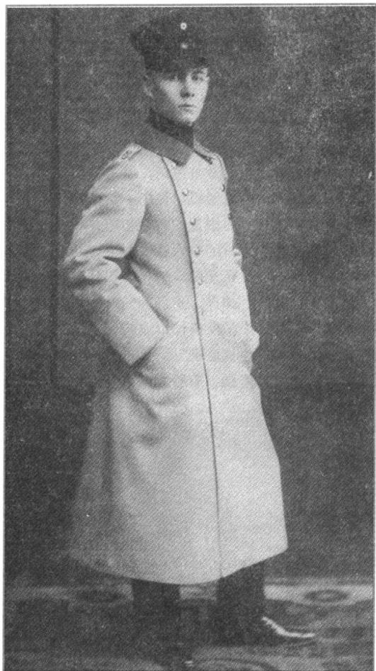
→入伍两年的隆美尔获得了中尉军衔。

称赞隆美尔“全身心地工作”，“多有成就”，是一位很有希望的青年军官，他的节俭也很受人敬重。除了枯燥单调的军事训练外，隆美尔大部分时间都用于给露西写情书。他把情书秘密地转交到露西所在的邮局，以免信件被她母亲截收。露西把自己戴着草帽在舞会上的照片作为明信片寄给他。隆美尔在收到照片后复信说：“我收到了你从家乡寄来的明信片，可我仍旧等着更多的照片；如果你让我等得太久的话，我很快会对你感到恼火的。我希望你认真地对待这件事。”隆美尔既不喝酒也不抽烟，和威卡尔登当地的女人全无来往，但却真心实意地爱着露西。从这时起，到他们结婚直至他死去，只要他们分开时，隆美尔几乎每天都要给露西写信。当然信的内容大多十分干瘪。