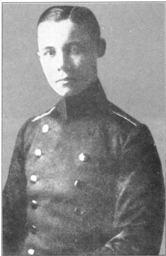
← 1911 年，20 岁的隆美尔将这张在军官学校读书时的照片送给了露西。

1912 年 1 月，隆美尔被授予中尉军衔，随后回到第 124 步兵团。该团驻扎在靠近斯图加特的威卡尔登一座古老的修道院里。此后两年里，隆美尔一直在那里训练新兵。训练的主要内容是单兵训练和分队训练。此外，还要向士兵们灌输由普鲁士创建的德意志第二帝国即将成为一个“世界帝国”的思想。帝国的社会制度、国家体制和社会结构都是完美无缺的。军人的职责就是不惜一切捍卫现存的一切。隆美尔向他的那些新兵们灌输着，自己也虔诚地信仰着这一切。该团团长斯坦因上校在 1913 年所写的一份报告中