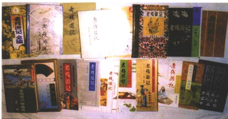
新中國成立後出版的部分《老殘遊記》