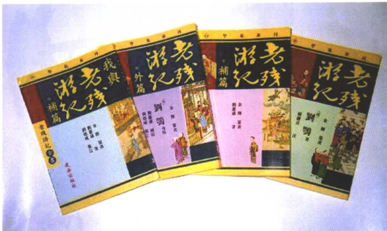
《老殘遊記全書》（台灣最新版）