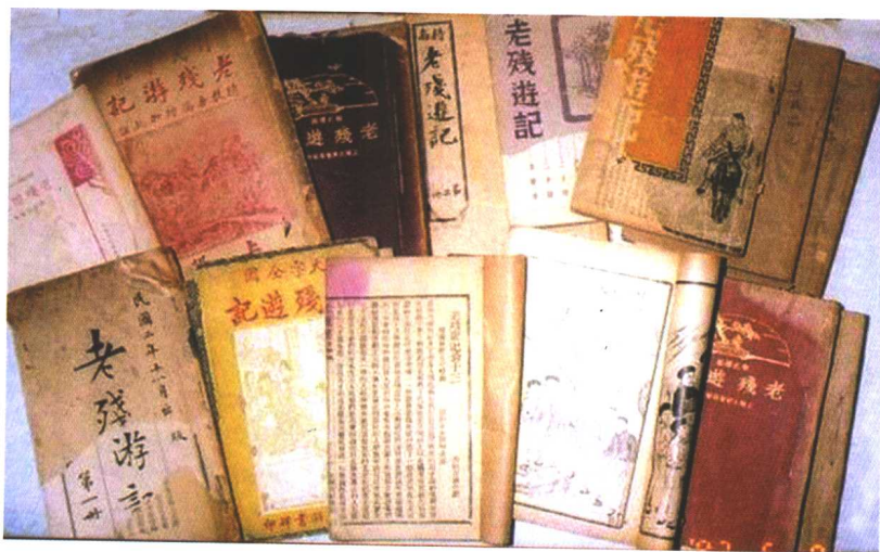
解放前出版的部分《老残游记》