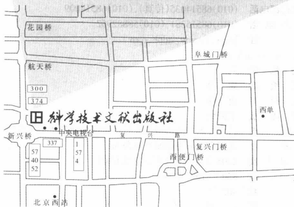
科学技术文献出版社方位示意图