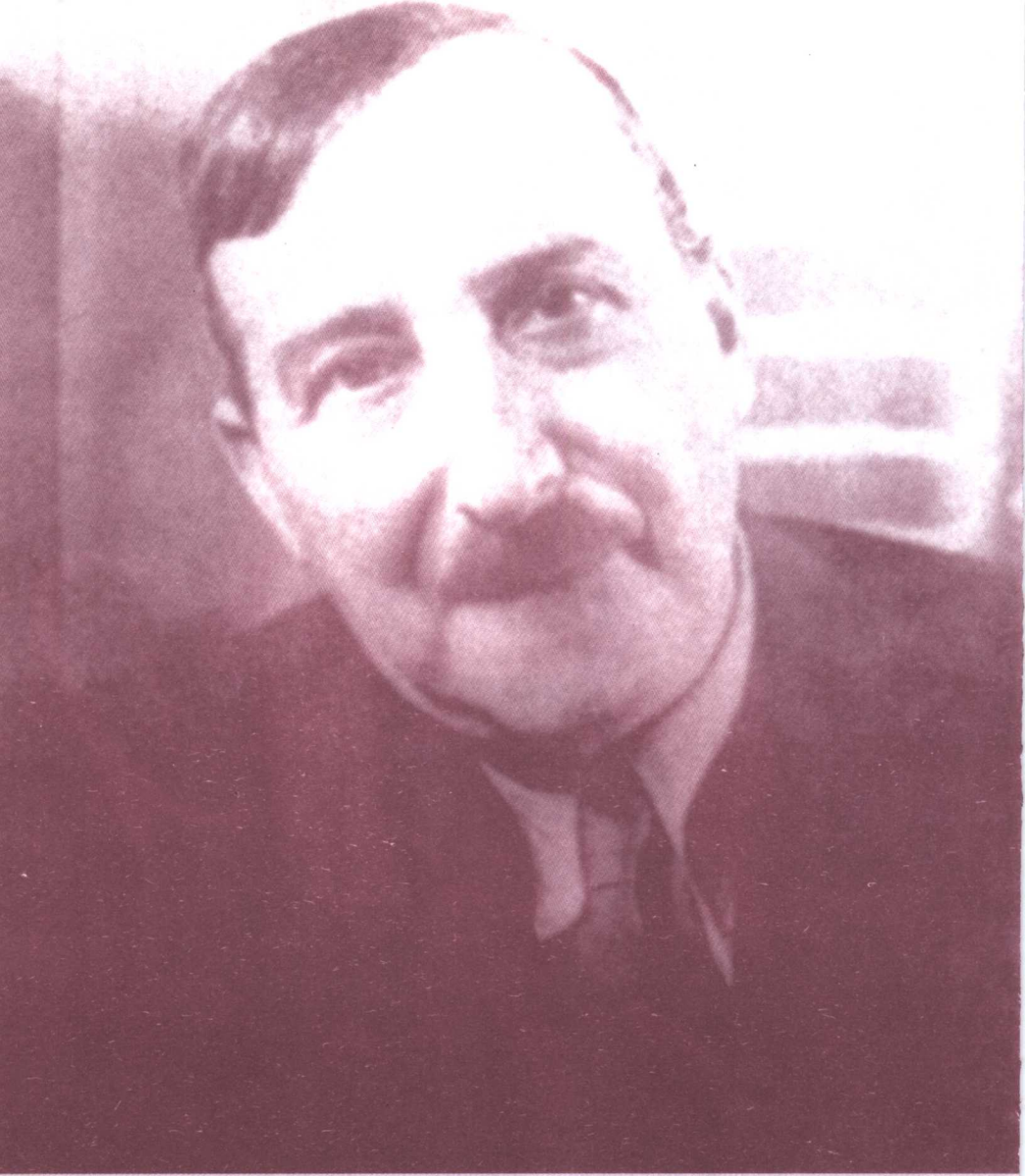
Zwig in 1940