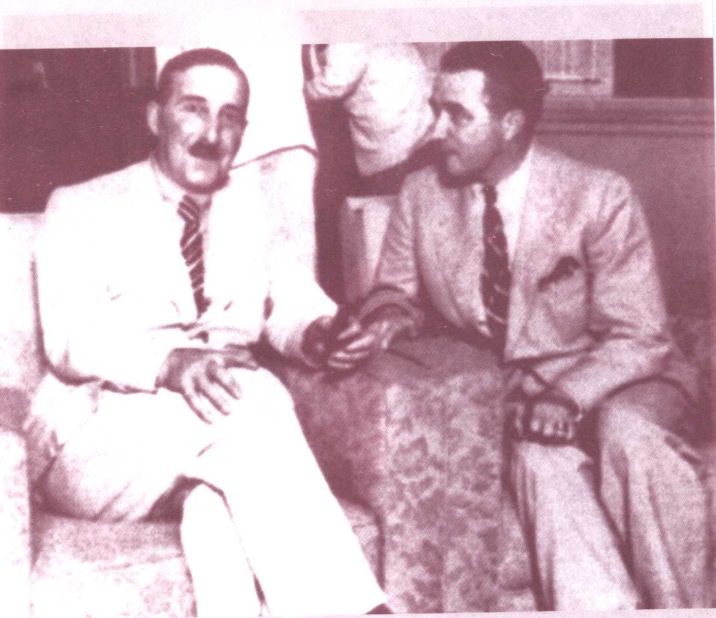
Zweig attends a reception, held by the ministry of foreign affairs of Brazil, in October 1940