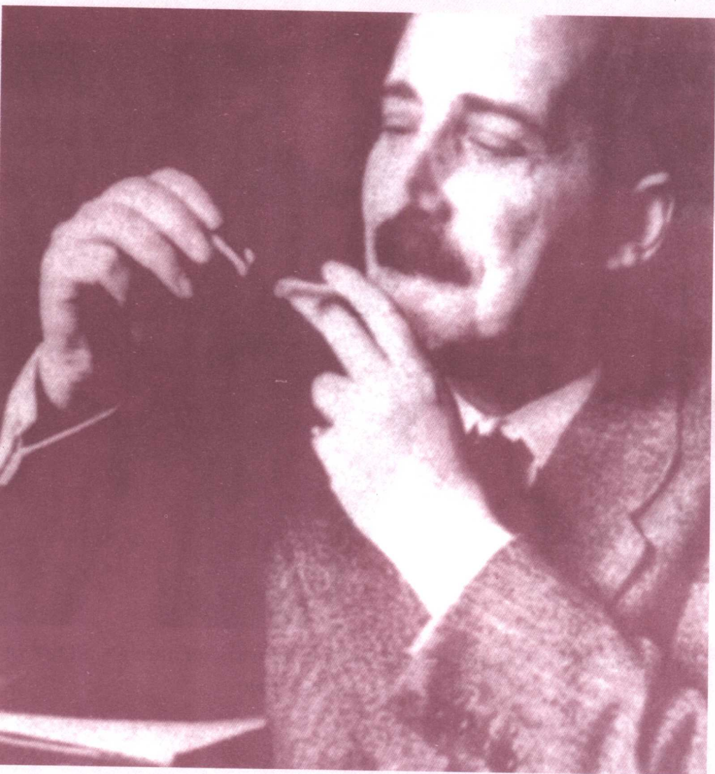
Zweig in 1940