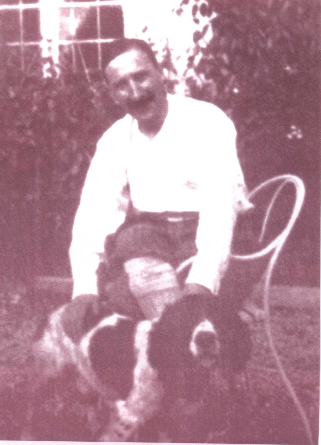
Zweig in his garden at Salzburg