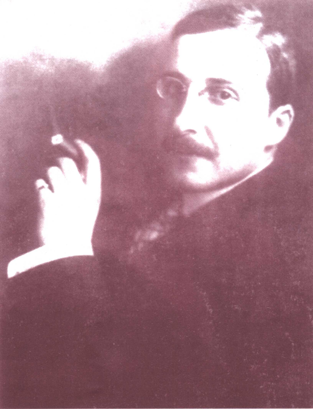
Zweig in 1912