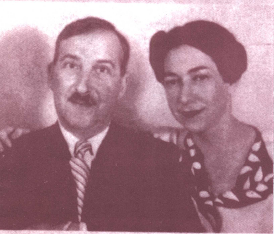
Zweig and his second wife, Lotte Altmann, 1938