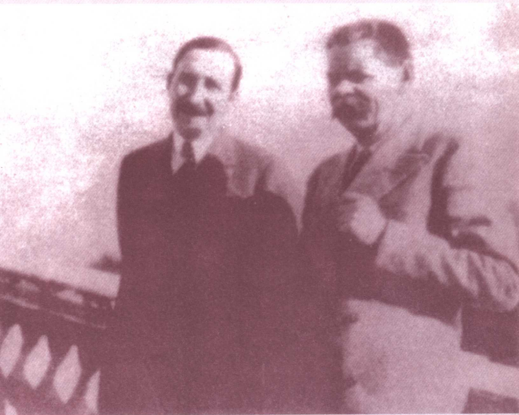
Zweig and Gorky, 1930