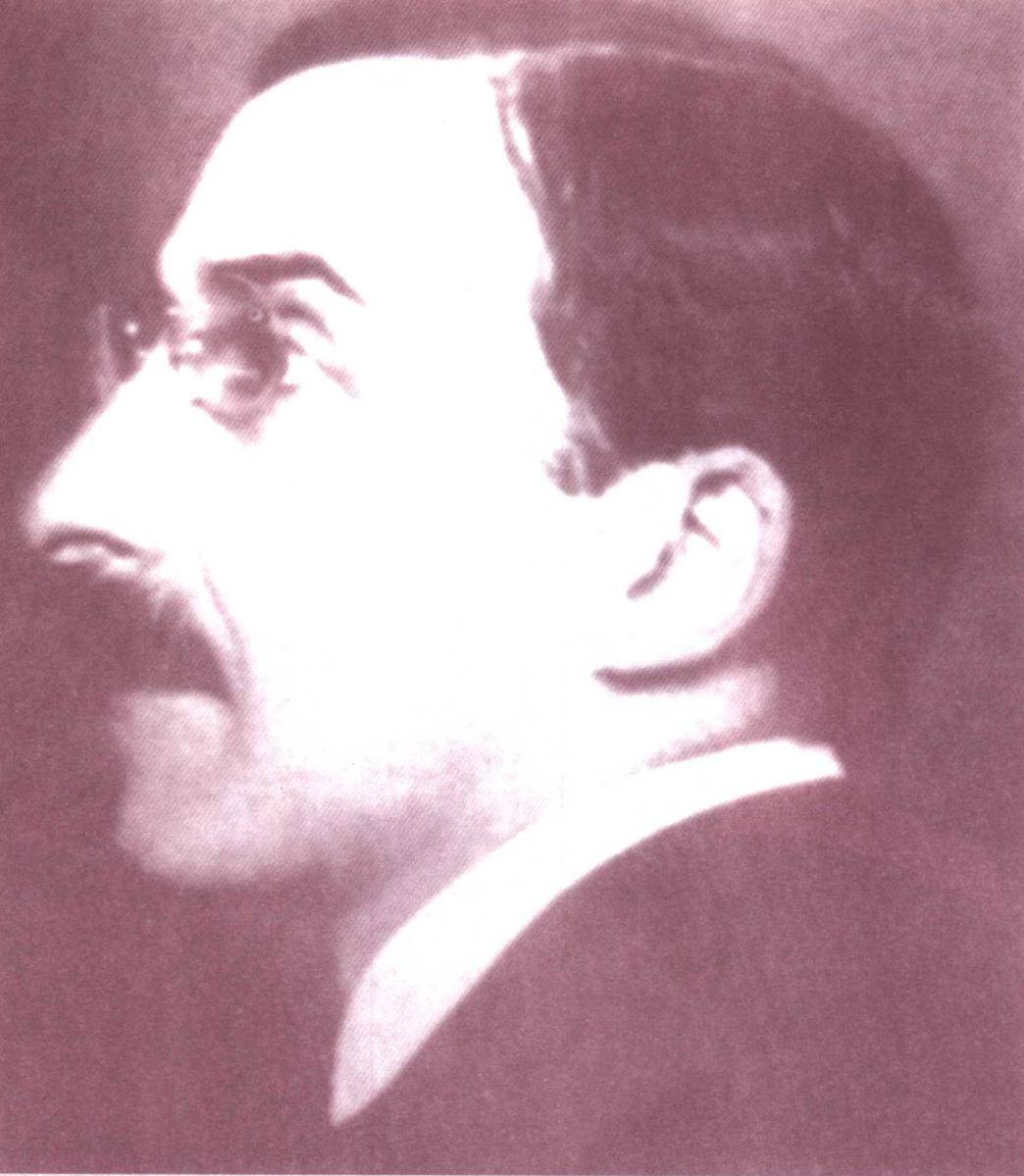
Zweig in 1920