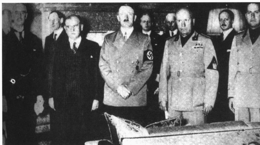
▲ 1938年9月，参与签订《慕尼黑协定》的代表