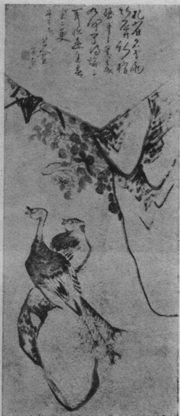
图7 牡丹孔雀 朱牵