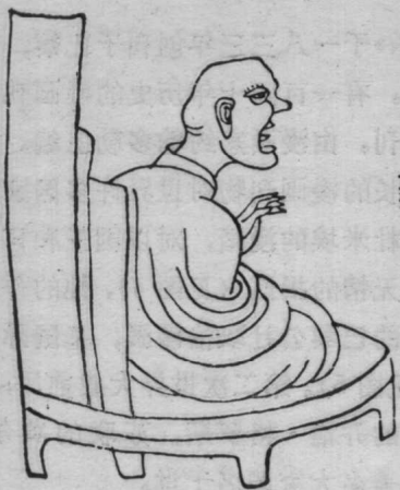
图1 《北京笑谱》人物之一