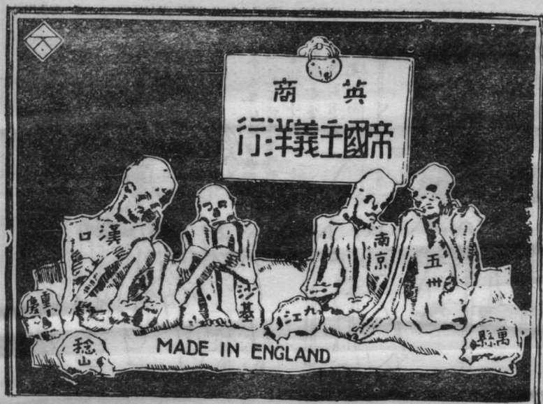
图 10 中国原料英国制造