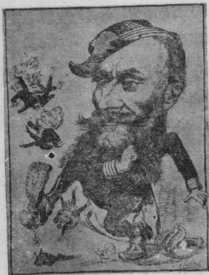
图5 巴黎公社英雄人物漫画像