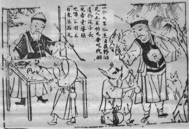
图8 龟喝酒 兔吸烟