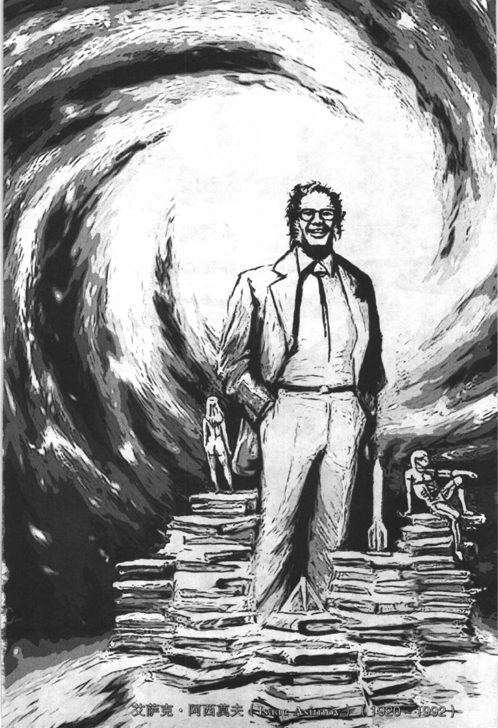
艾萨克·阿西莫夫 (Isaac Asimov) (1920 - 1992)