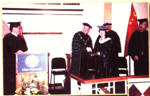
▲ 2001年3月,作者在美国俄亥俄大学获工商管理硕士学位。