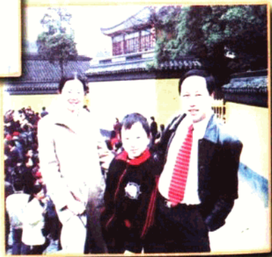
▶ 作者和家人在一起。