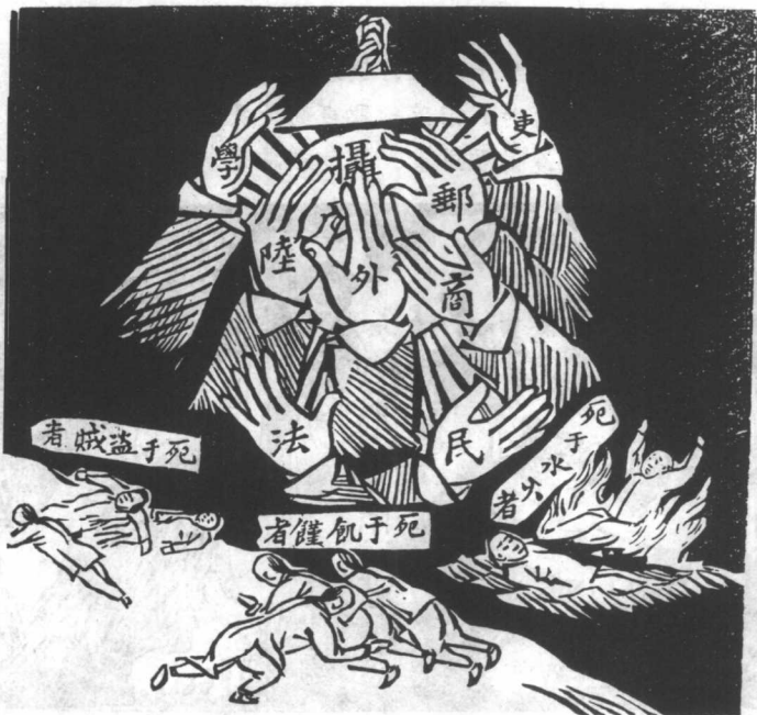
(二) 政界之黑暗 (1909年)

1813年9月15日,天理教教主林清率众二百余人,扮成游商小贩潜入北京,没费吹灰之力就攻进了紫禁城,并且占据宫廷达两日一夜,制造了中国自“汉唐以来绝无仅有之事”。事后嘉庆帝下“罪己诏”,怒斥文恬武嬉、吏治腐败,他说:“变起一时,祸积有日”,“当今大弊”在于满朝文武“因循怠玩”,(画二)因此谕令:“诸臣若愿为大清国之忠良,则当赤心为国,竭力尽心,匡朕之咎,移民之俗。若自甘卑鄙,则尔等当挂冠致仕,了此残生,切勿尸禄保位,增益朕罪,笔随泪洒,通谕知之。”嘉庆帝一诗一诏,可谓言之切切,意之拳拳。然而,掌握着生杀大权的一国之君不是雷厉风行整顿吏治,仅靠做诗骂人、下诏流泪就能令贪官污吏良心发现、立地成佛吗?事实上,到道光年间,清王朝已经濒临覆亡的边缘,国内吏治不肃、官场腐败,财政空虚、民生疲敝,国外西方列强正在虎视眈眈,磨刀霍霍,酝酿着侵华战争。