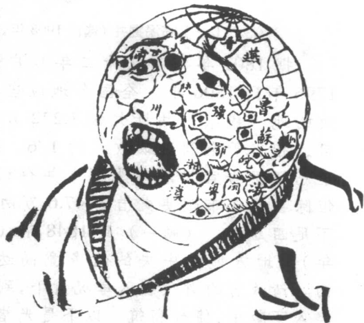
（二）疮痍满目（选自1909年《神州日报》）

国家穷到如此地步，当时的官僚日子也就不那么好过了，他们既宦囊羞涩，又要在地狱里享受天堂生活，便把“九齿钉耙”磨得更锋利，拼命地搂银子。清末民初的官场上，时刻都在上演着以“钱”为中心的敛财戏。官员的日子是好过了，但国家和民众却已是伤痕累累了。（画二）