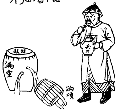
(一) 临渴掘井 (选自 1908 年《神州日报》)

据 1807 年 (嘉庆十二年) 户部统计: 自 1796 年到 1806 年, 全国各地应当缴纳中央财政的地丁钱粮, 共计欠银 1,272 万两, 这个数目, 相当于全国财政收入的 1/6。1822 年, 直隶总督报告直隶藩库账面上共存银 51.5 万两, 但除去历任布政使支借的 47.6 万两, 实际剩银不足四万两。(画一) 到 1848 年 (道光二十八年), 地方拖欠中央的债务竟高达 2,390 多万两。清政府的财政收入每况愈下, 到光绪年间已经入不敷出, 债台高筑。以下是光绪朝历年的收支情况统计表:(单位: 白银两)