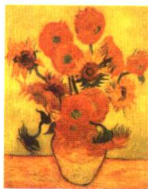
第一影响力艺术宝库