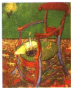
第一影响力艺术宝库