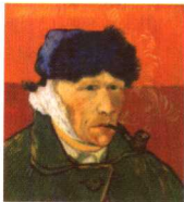
第一影响力艺术宝库