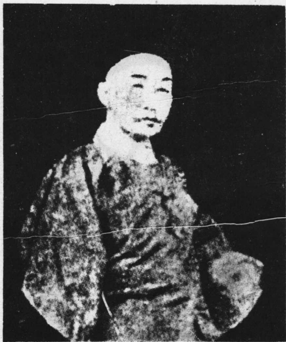
榮祿，政變時舊黨的首腦，文淵閣大學士，直隸總督，當時他所節制的軍隊，除袁世凱的新建陸軍外，有直隸綠營，留直淮軍，直隸練軍，甘軍毅軍，武毅軍等九萬三千五百多人，政變後，入軍機，掌兵部，節制北洋各軍。