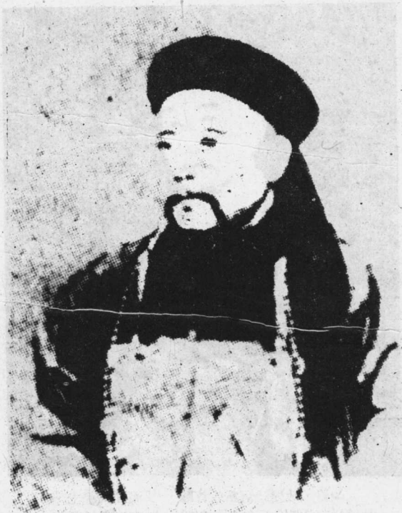
這是戊戌政變時期的袁世凱，他爲了洗刷自己向榮祿告密的罪惡，真假揉合在一起，寫了一篇「戊戌日記」（戊戌紀略），說他的告密完全是出於「忠君愛國」。