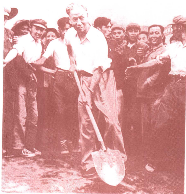
刘少奇在十三 陵水库劳动