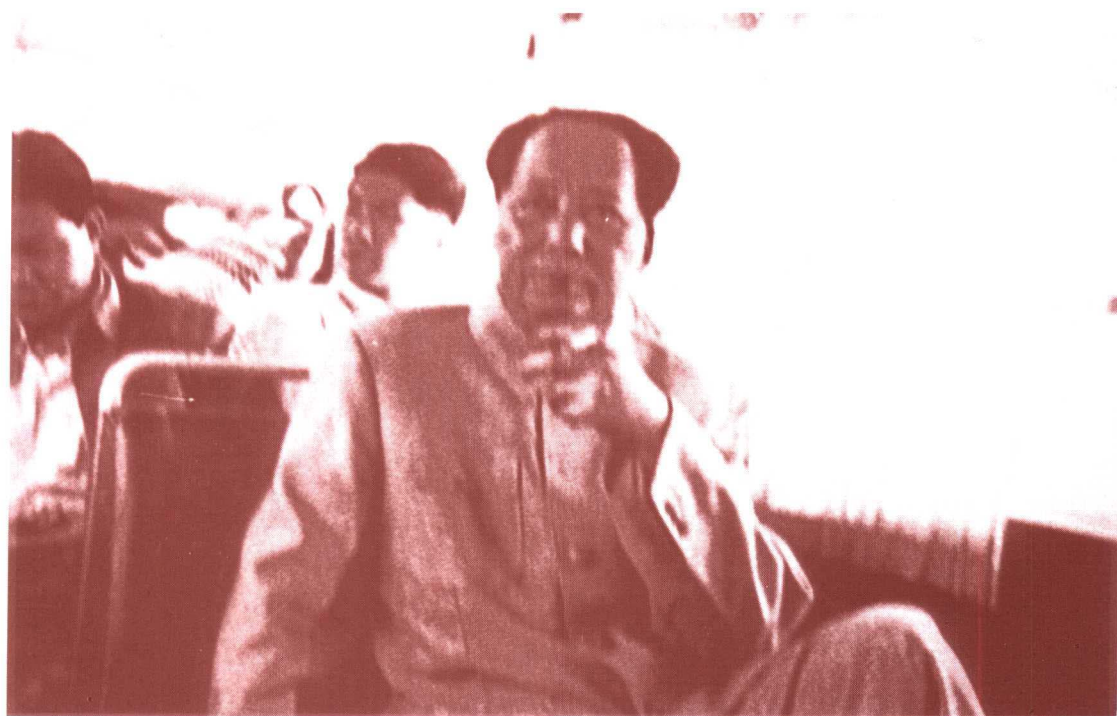
毛泽东前往京郊视察途中(1958年)