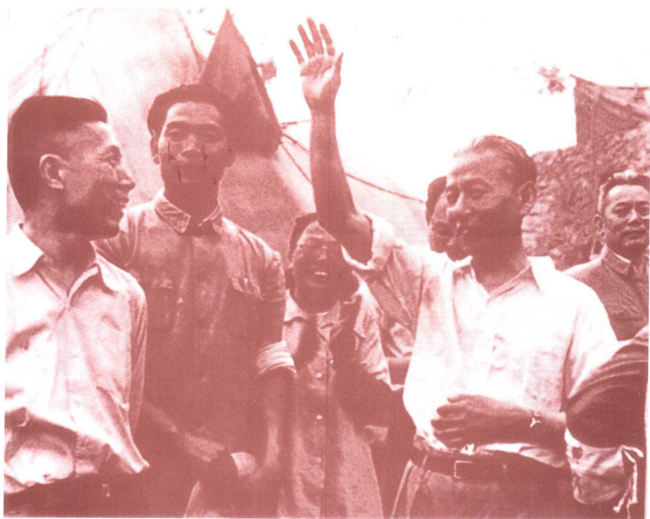
刘少奇视察 十三陵水库 (1958年 5月25日)