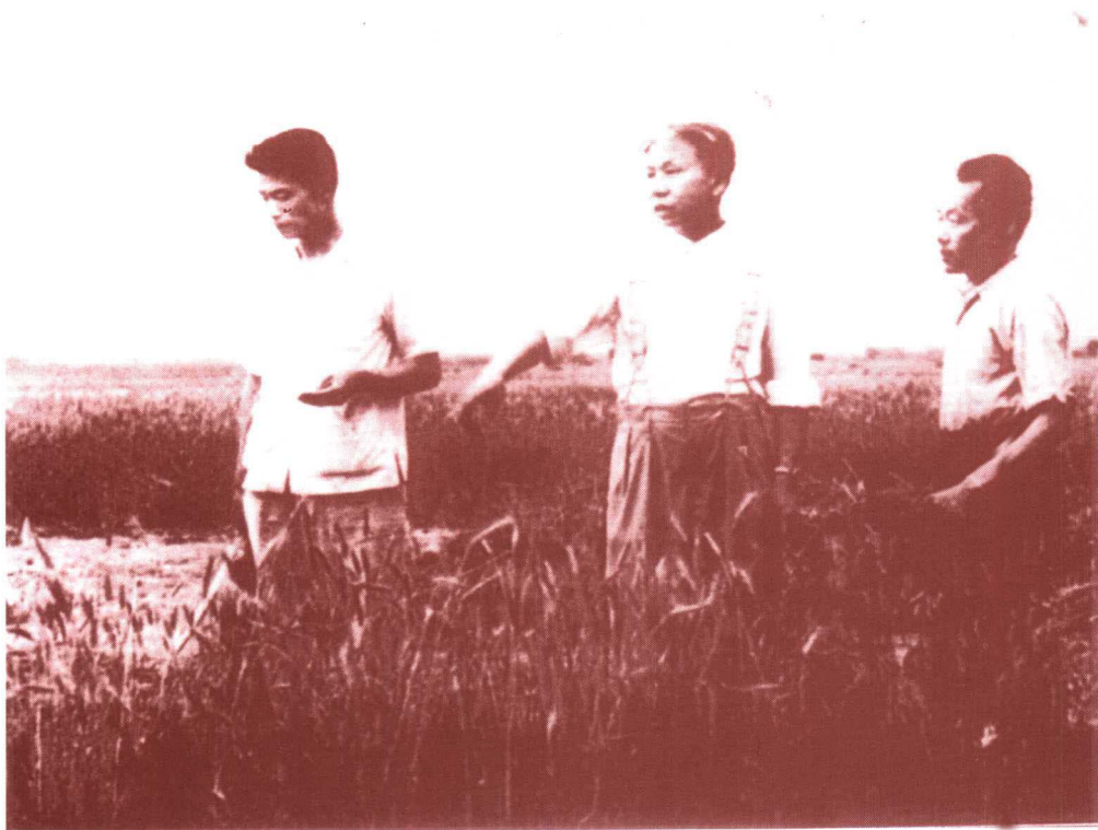
刘少奇在北京玉泉农业生产合作社了解小麦生产情况(1954年)