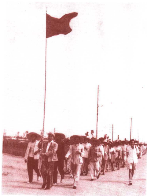
周恩来率国务院部级干部前往十三陵水库劳动(1958年6月15日)