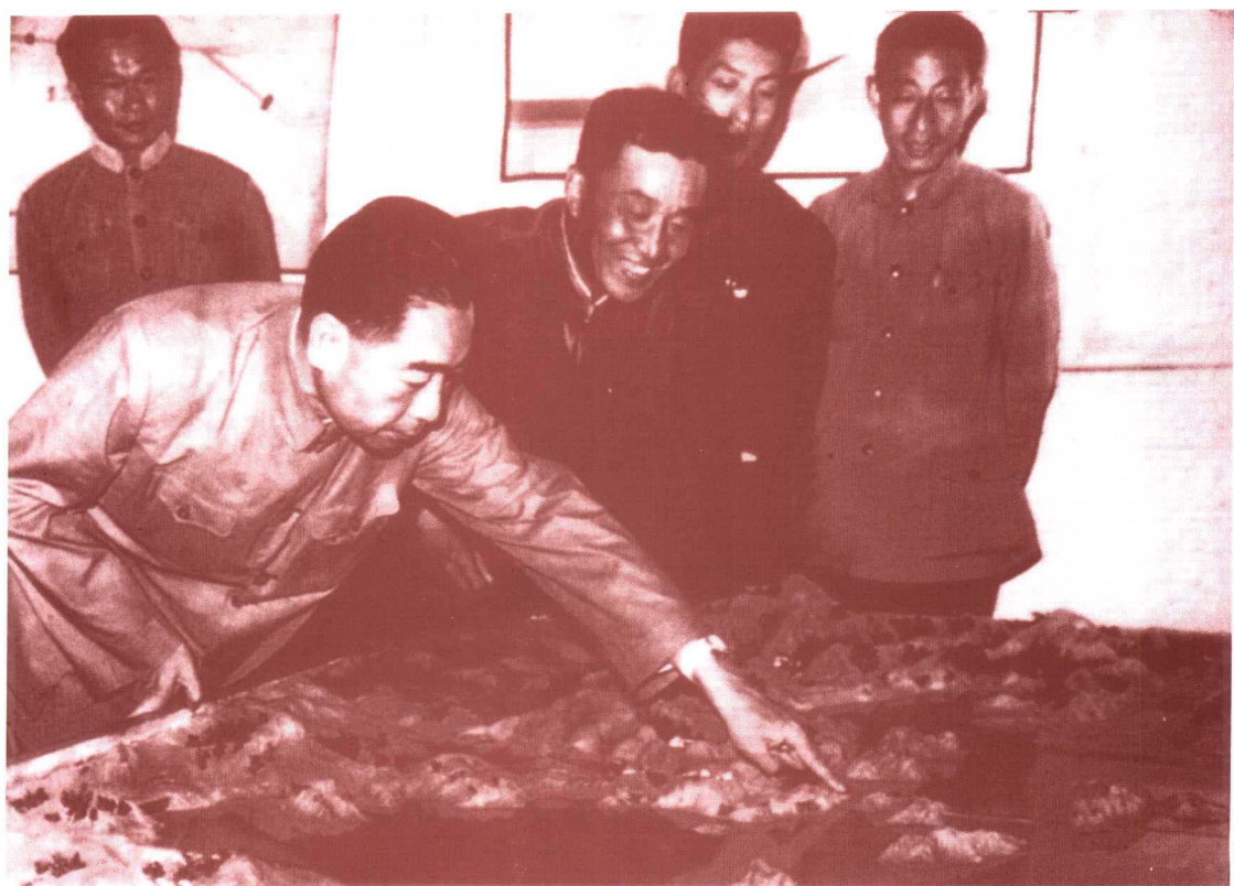
周恩来观看密云水库模型(1959年5月19日)