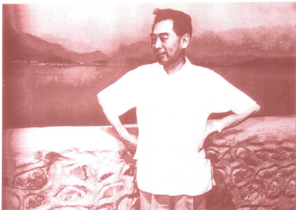
周恩来视察怀柔水库时留影(1958年6月26日)