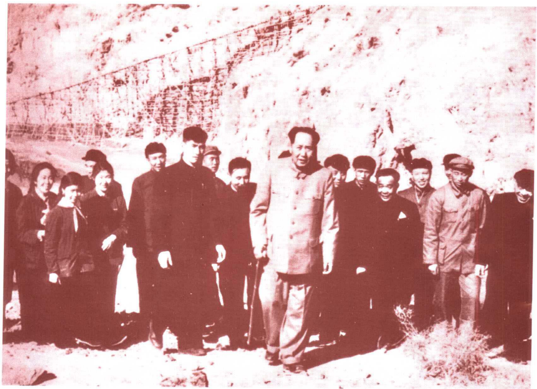
毛泽东视察官厅水库(1954年4月12日)