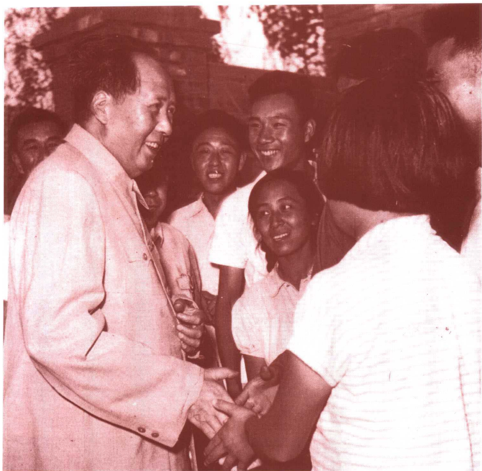
毛泽东 视察岳 各庄农 业社