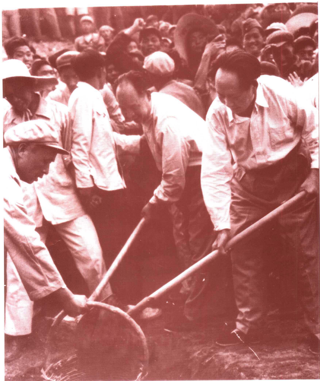
毛泽东和彭真一起在十三陵水库劳动(1958年5月25日)