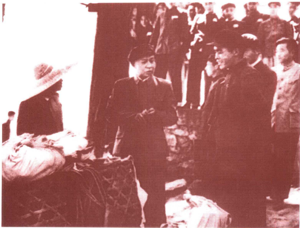
刘少奇在北京郊区同路遇的小商贩交谈(1955年)