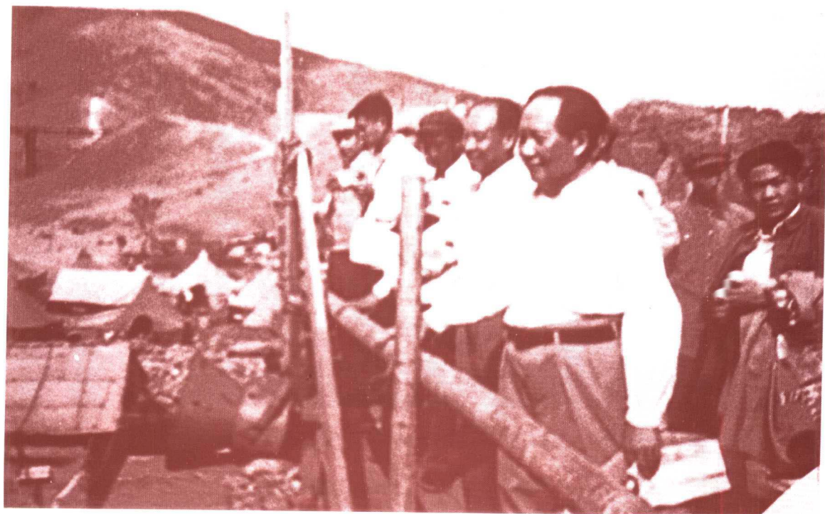
毛泽东视察十三陵水库工地全景(1958年5月25日)