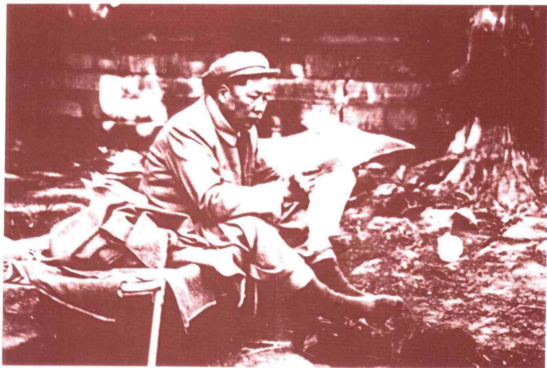
毛泽东在十三陵水库劳动后休息(1958年5月25日)