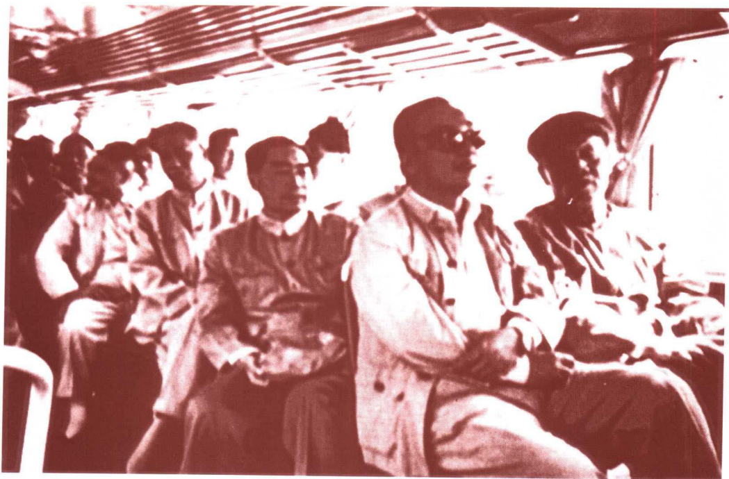
周恩来、刘少奇、邓小平等去十三陵水库劳动(1958年5月25日)