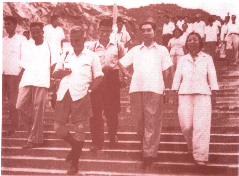
周恩来陪同外宾参观京郊水利建设工程