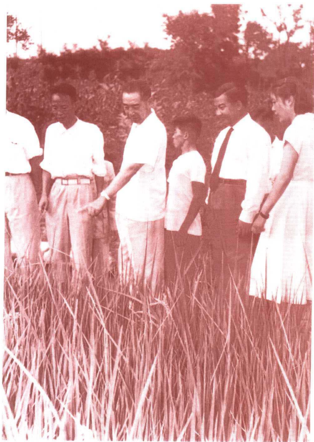
周恩来陪同柬埔寨 西哈努克亲王参观 京郊玉泉农业生产 合作社 (1958年8月6日)