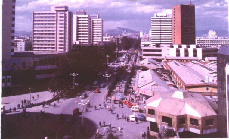
昆 明 市 北 京 路