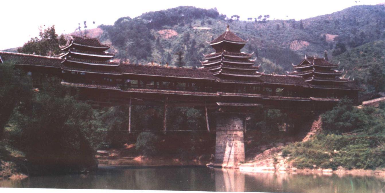
黎平县地坪侗乡花桥