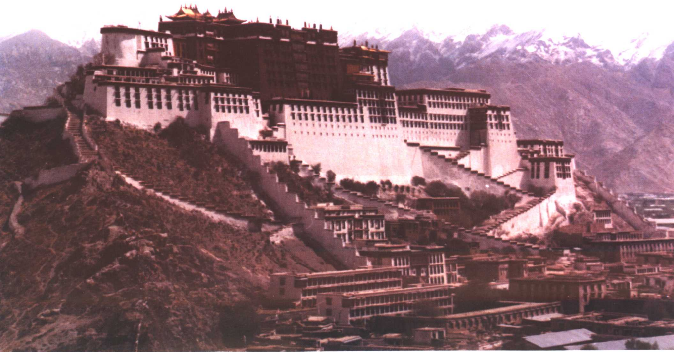
布 达 拉 宫