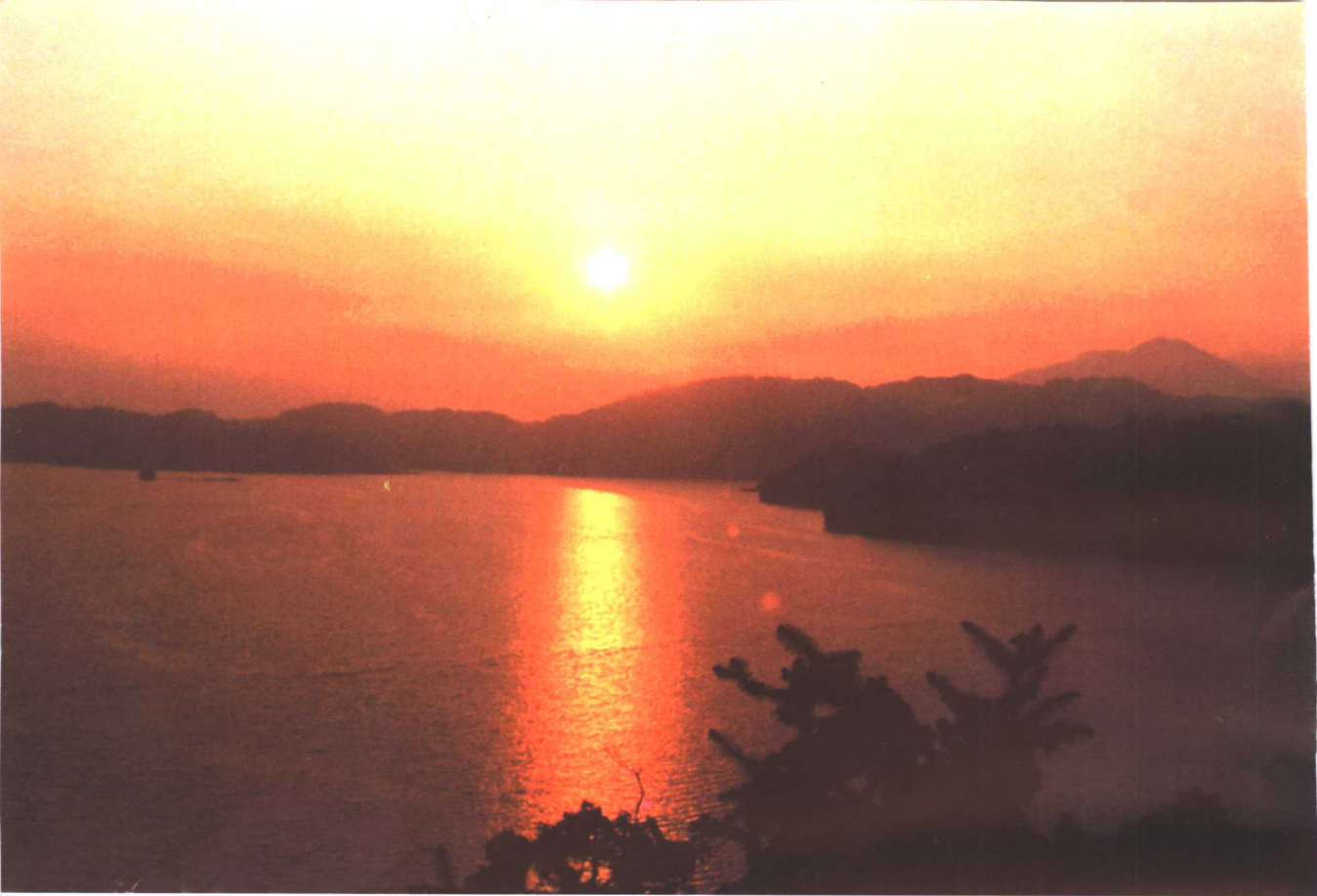
日 月 潭