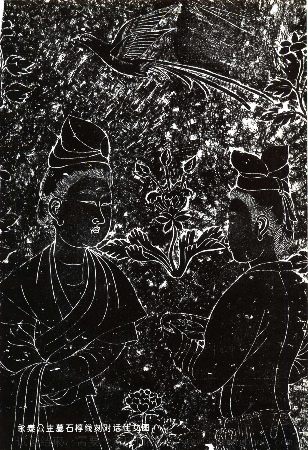
永泰公主墓石椁线刻对话仕女图