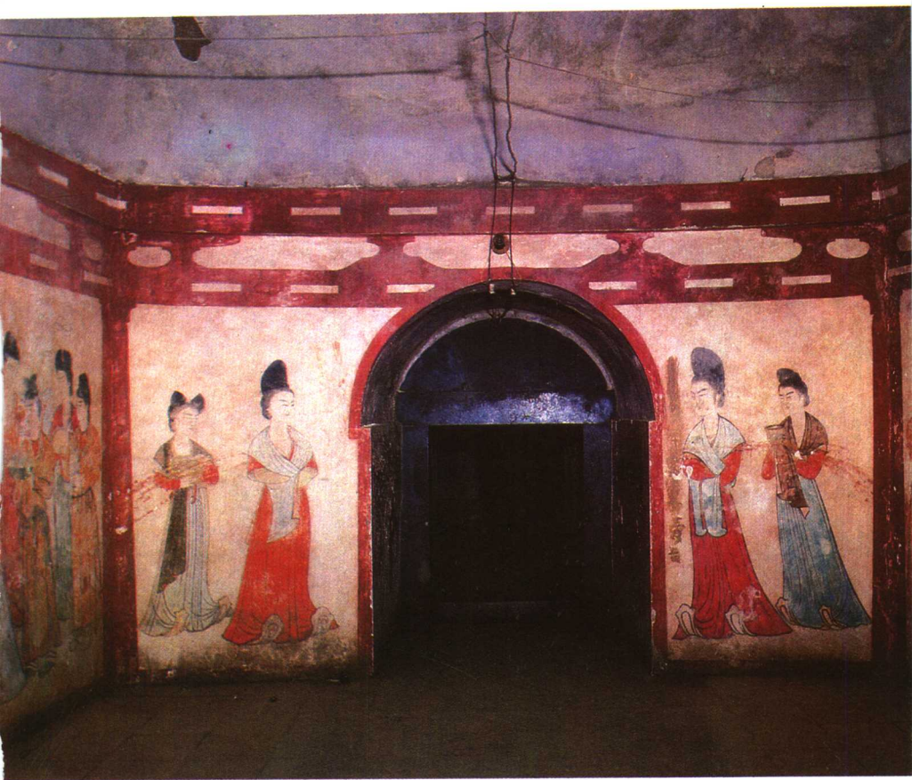
永泰公主李仙蕙墓甬道