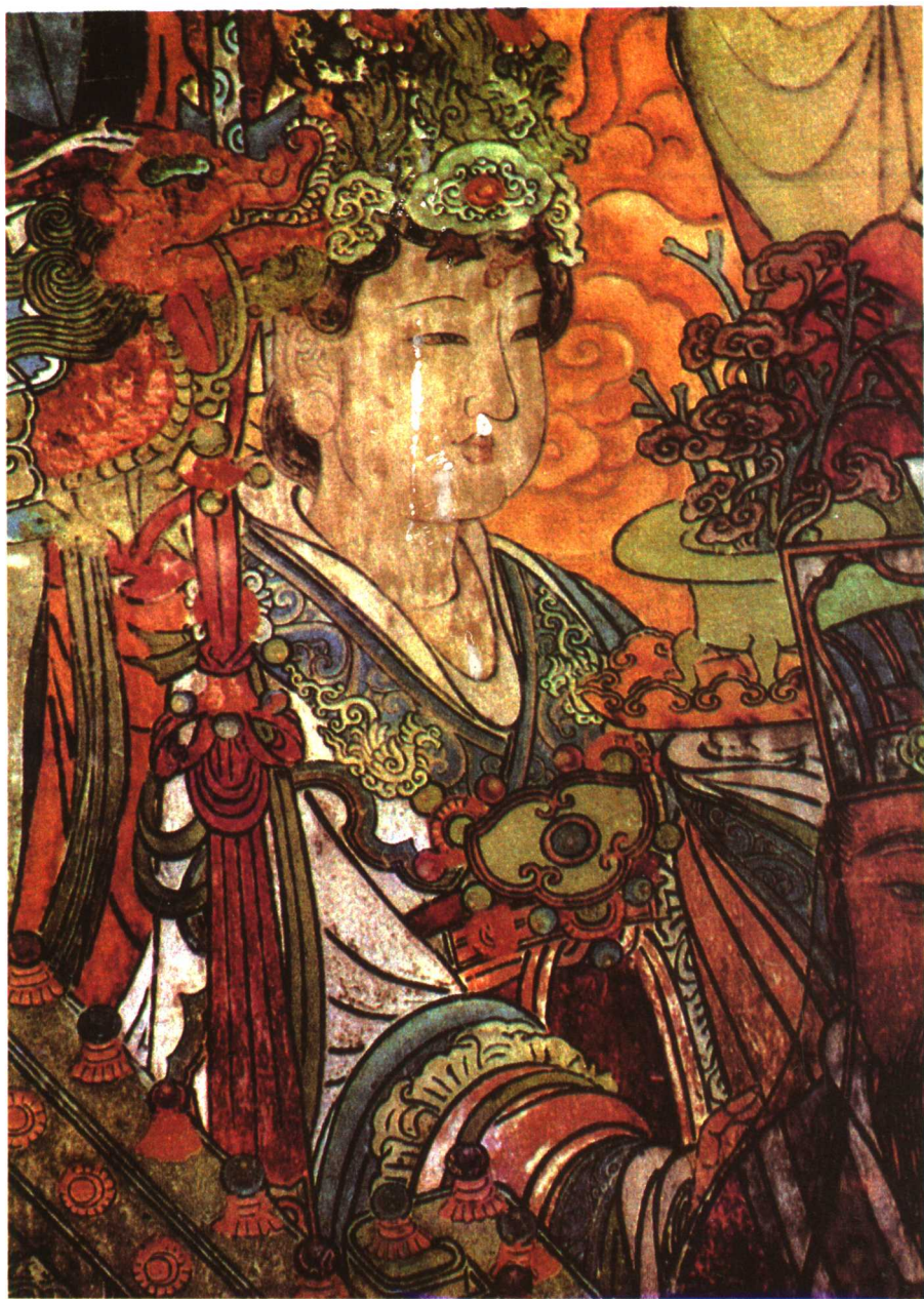
朝元图·玉女(局部) 元·永乐宫壁画