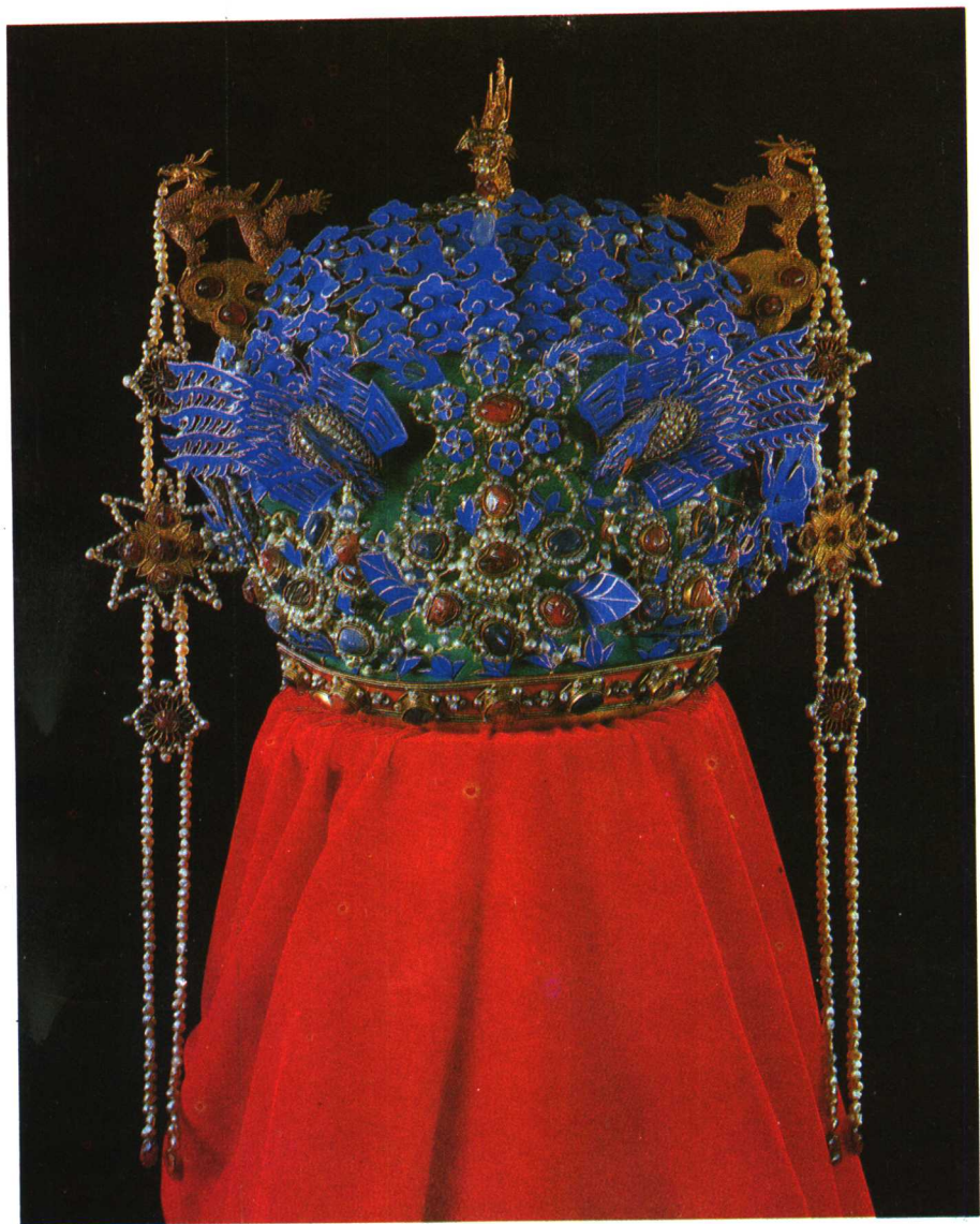
钿花嵌珠宝龙凤冠 明·万历