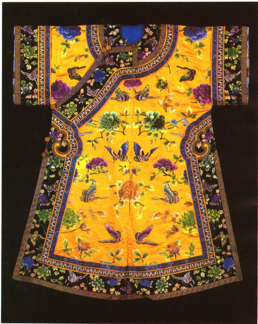
明黄缎绣彩牡丹蝶裳衣 清·光绪