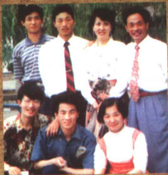
名典编辑部编辑合影