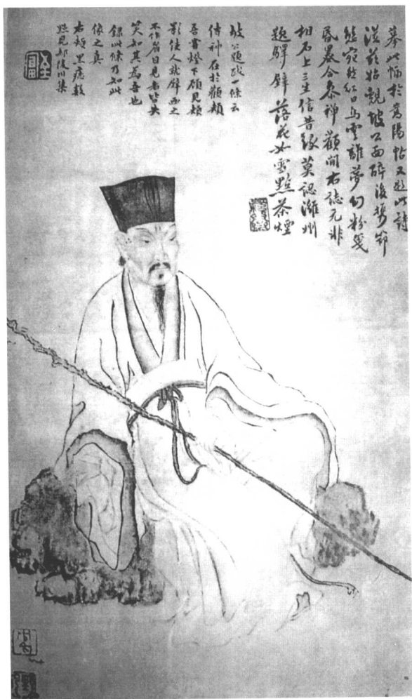
苏轼画像（传宋李公麟原画，清朱野云临摹，翁方纲题款）