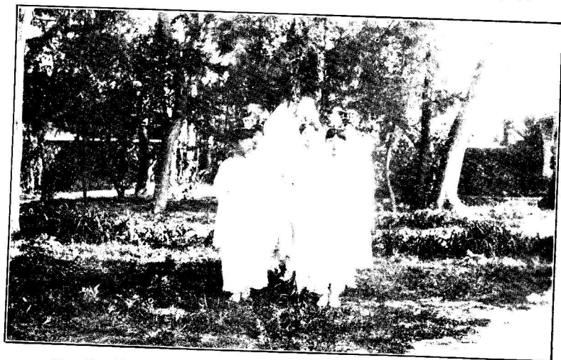
對 瓊 絲 袖 張