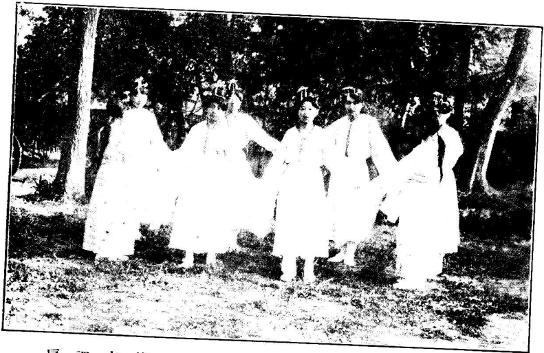
扇 調 衣 歛