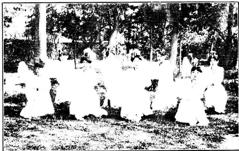
偷 低 度