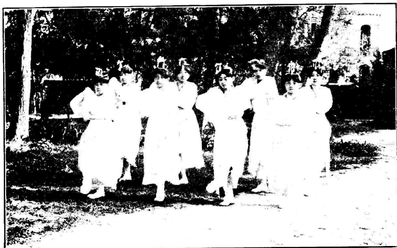
呈 獨 立