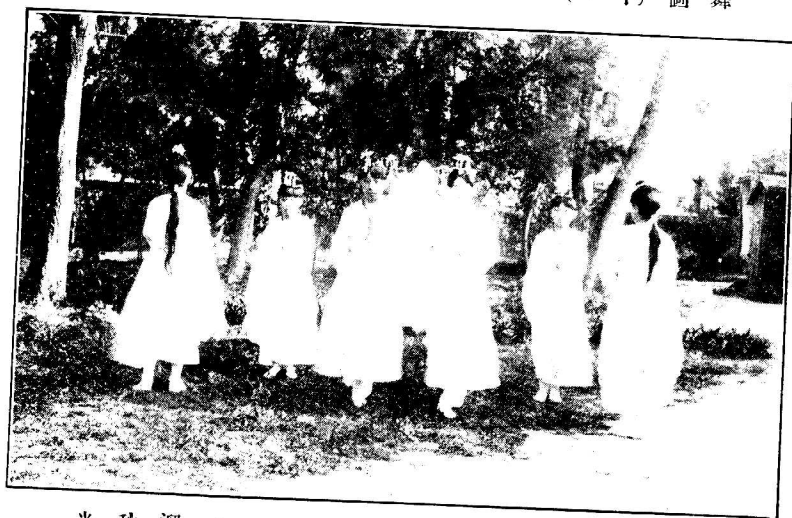
一 溜 秋 光