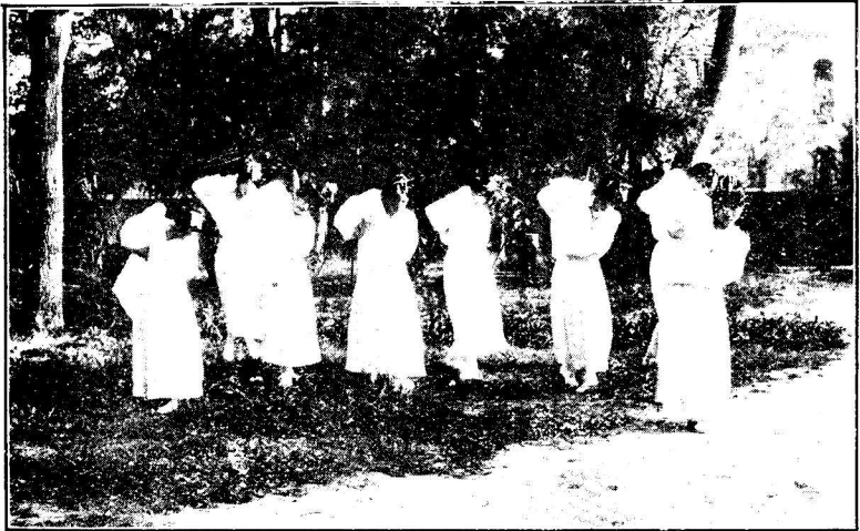
惟 聞 遙 送