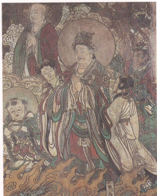
图3. 山西稷山县青龙寺腰殿元代壁画

历史上的一些水陆道场非常著名，例如，北宋元丰七、八年（1084年—1085年），名僧佛印（了元）在金山主持的“金山水陆”，驰名遐迩。元祐八年（1093年）大文学家苏东坡在四川为亡妻设水陆道场。 ⑥ 南宋绍兴二十一年（1151年）慈宁太后施钱为真歇清了于杭州崇先显孝寺修水陆法会。 ⑦ 南宋乾道九年（1173年），四明（宁波）人史浩在四明东湖月波山施田百亩，专建四时水陆，宋孝宗特地赐与“水陆无碍道场”额。月波山附近的尊教寺，有僧俗3000人，遵照月波山四时普度之法，举办道场。元代延祐三年（1316年）、至治二年（1322年），朝廷曾在金山寺开设水陆法会，参加的僧众均达1500人。 ⑧ 此外，大都（北京）昊天寺、五台山、杭州上天竺寺等处都曾举行盛大的