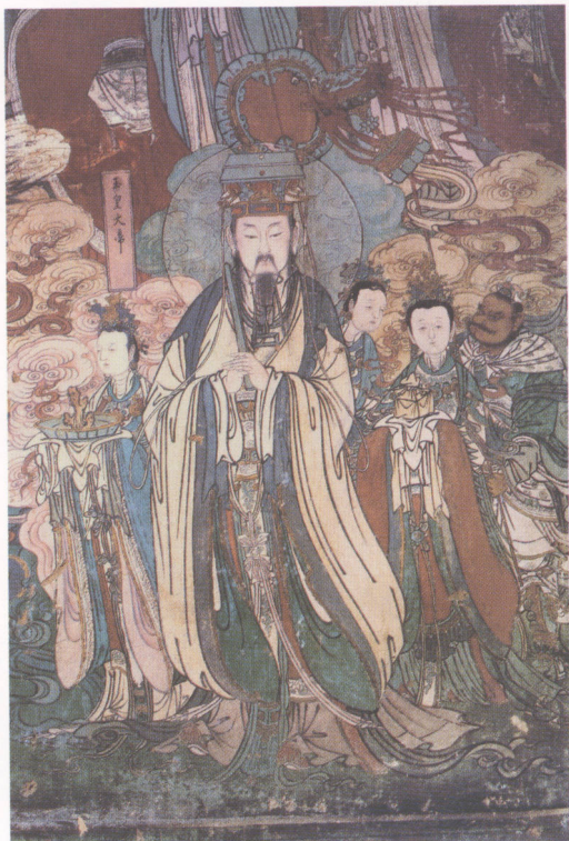
图1. 河北石家庄毗卢寺后殿明代壁画

曰：‘六道四生受苦无量，何不作水陆普济群灵？’帝因志公之劝，搜寻贝叶，早夜披览，及详阿难遇面燃鬼王，建立平等斛食之意，用制仪文，三年乃成。遂于润州金山寺修设，帝躬临地席，命祐禅师宣文。”