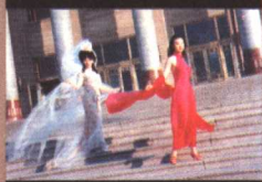
与萧蔷在人民大会堂 门前做秀