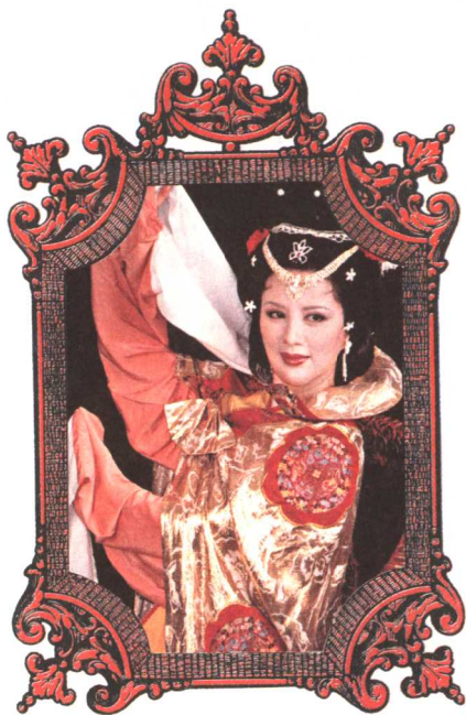
西施浣纱的沉鱼之貌