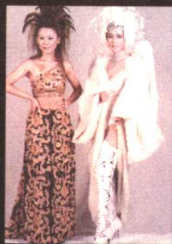
得到“年度最佳造型奖” 与主持人蓝心湄合影