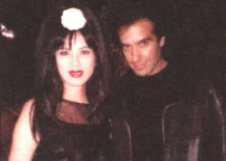
与魔术大师 大卫·克波菲尔