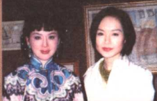
接受“鲁豫有约”采访