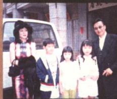
与谢贤在《千王之王 重出江湖》剧组