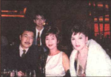
与赵雅芝伉俪及 长子泽龙