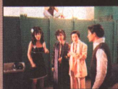
在剧组与刘德华合作