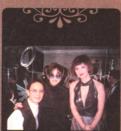
与梅艳芳及刘培基