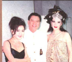
与万梓良及温碧霞 在登台做秀