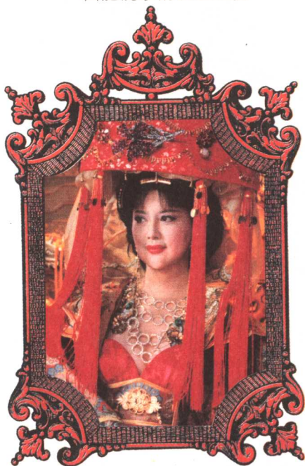
昭君出塞的落雁之仪