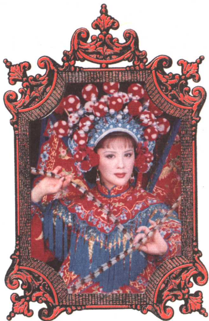
貂蝉拜月的闭月之相