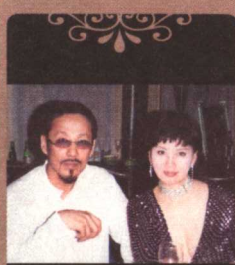
与陈道明在北京“中国会”