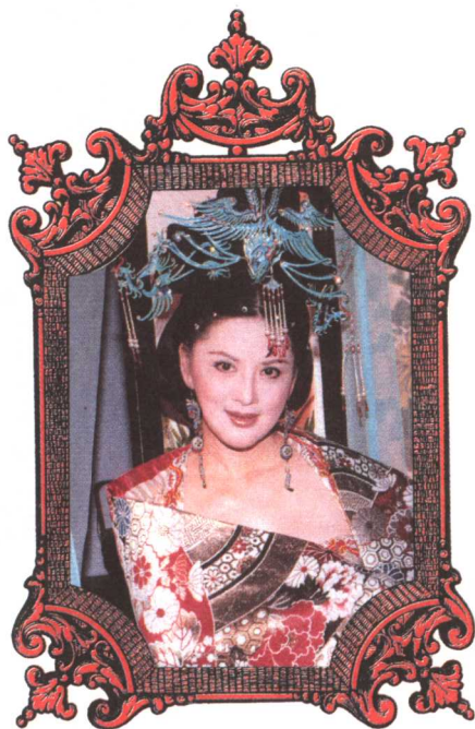
贵妃醉酒的羞花之容