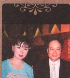
与李安导演在“金马奖”颁奖现场