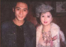
与刘烨在“金马奖” 颁奖现场