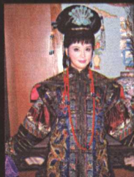
《康熙王朝》 中慧妃造型