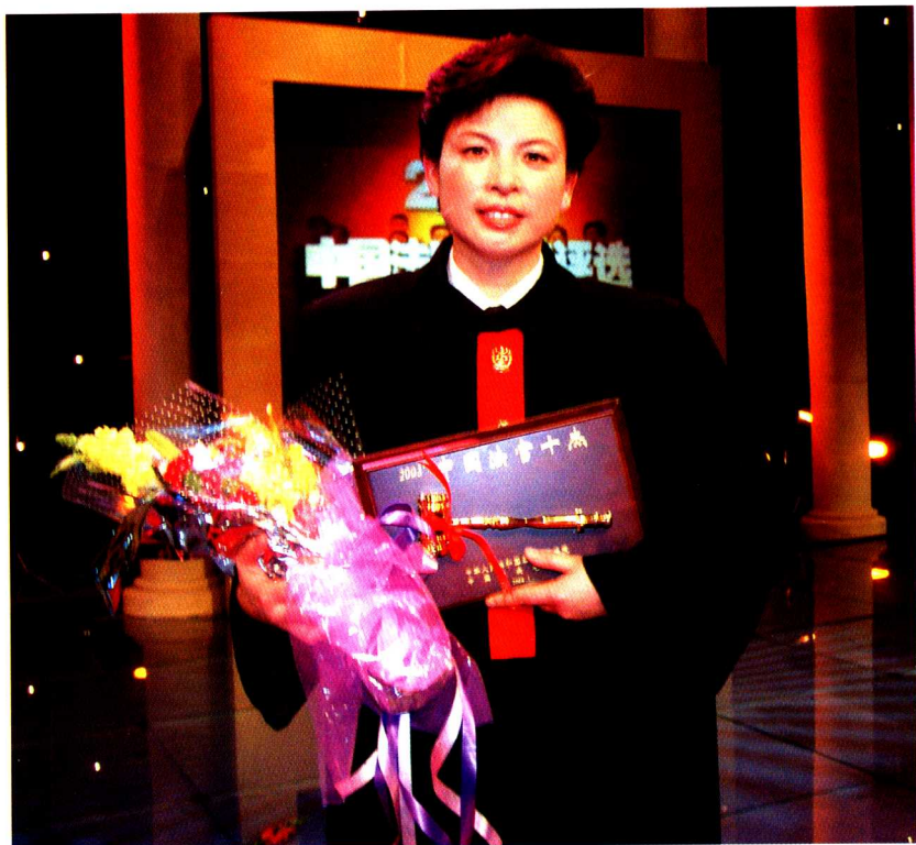
▲ 宋鱼水在2003年“中国法官十杰”评选晚会上，获得“金法槌”奖。