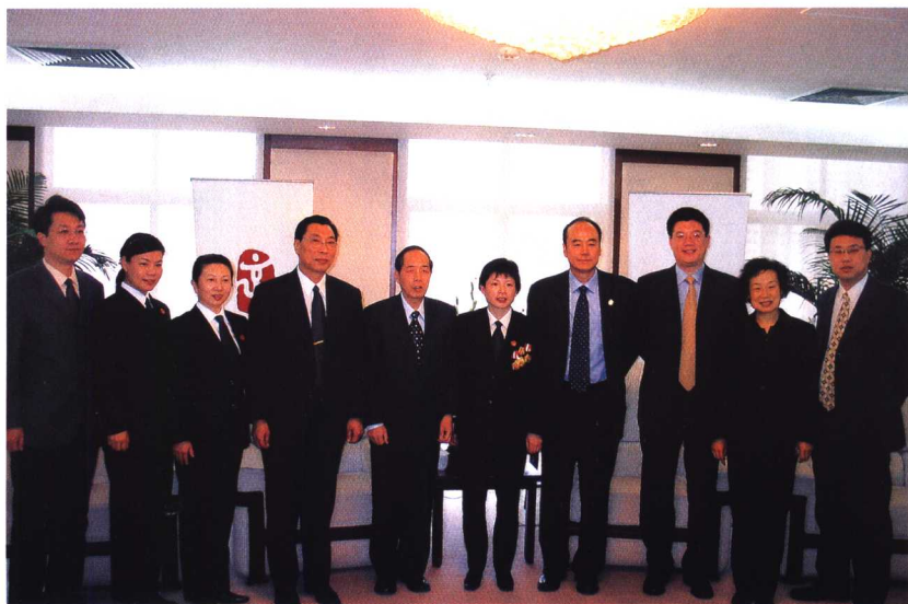
▼ 宋鱼水先进事迹报告团成员与北京奥组委领导在一起。