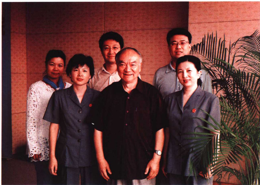
▲ 宋鱼水先进事迹报告团成员。