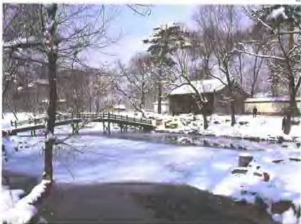
1. 烟雨楼 2. 山庄秋色