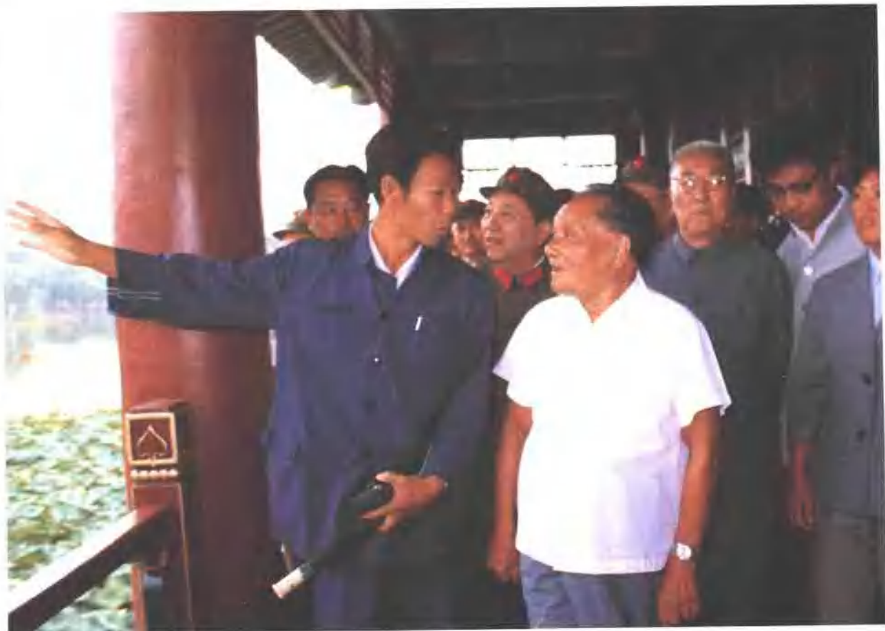
邓小平同志在承德视察