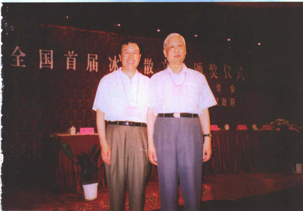
作者与中国散文学会会长林非的合影