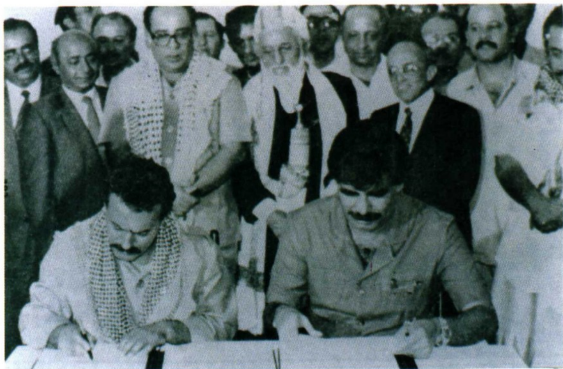
北也门总统萨利赫（左）、南也门社会党总书记比德（右）签署也门统一协议（1990年4月22日）