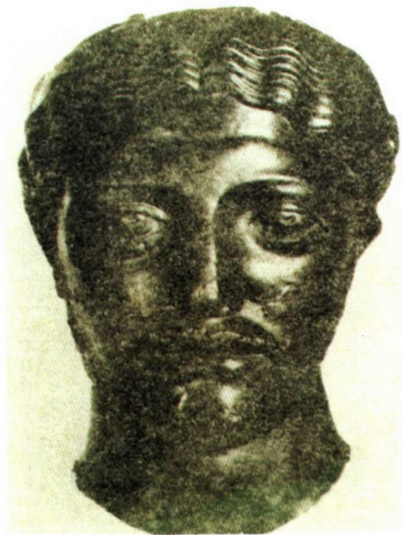
希木叶尔国王 萨林头像