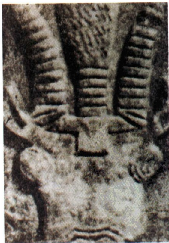
萨巴王国时期的 大理石雕