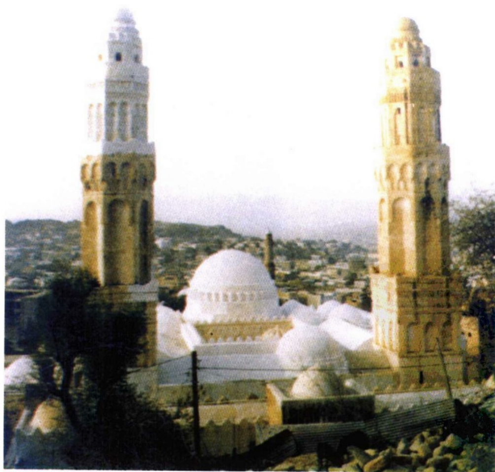
塔兹城内的艾什拉菲亚清真寺