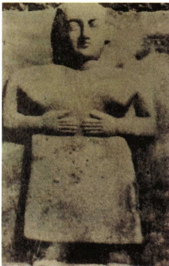
萨巴王国时期的大 理石少女雕像