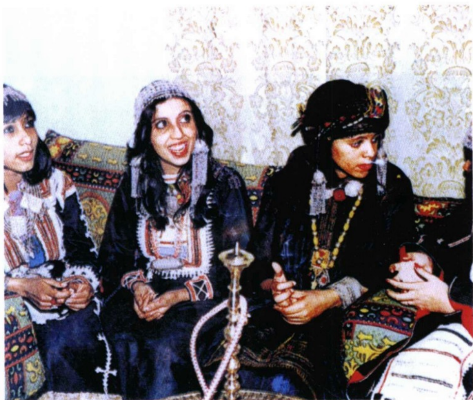
身着传统服饰的也门妇女