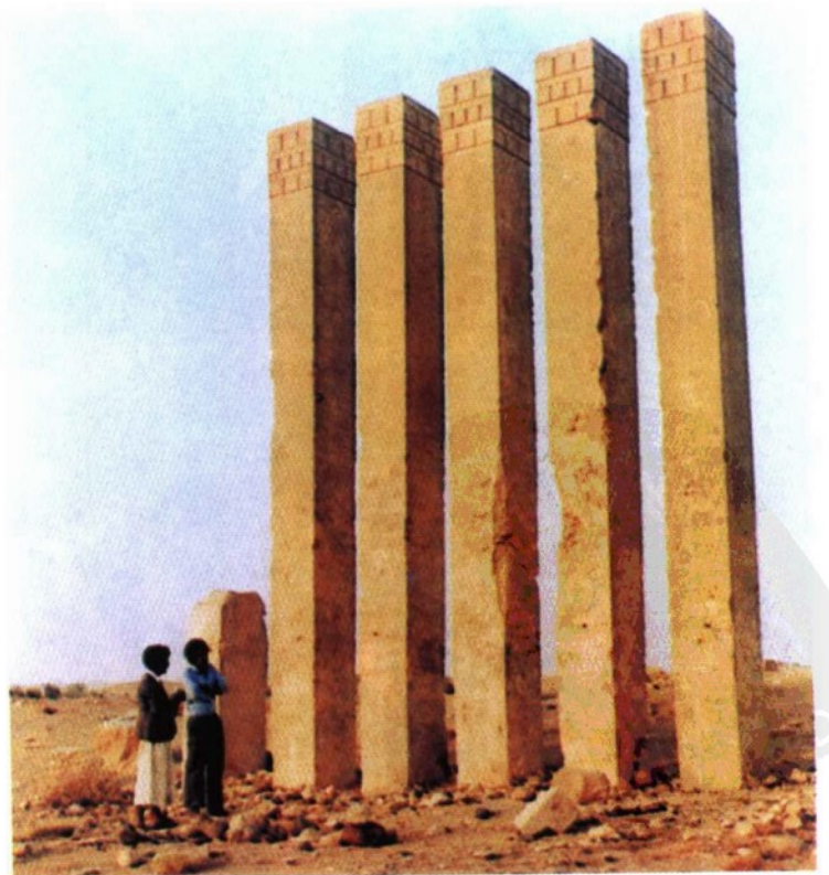
马里卜月神庙遗址