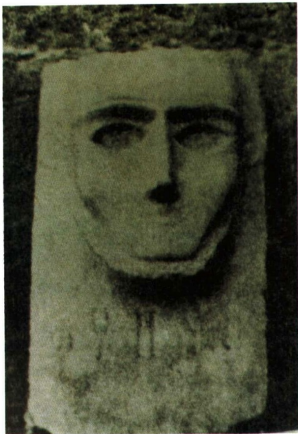
萨巴国王瓦哈卜·伊勒大理石头像