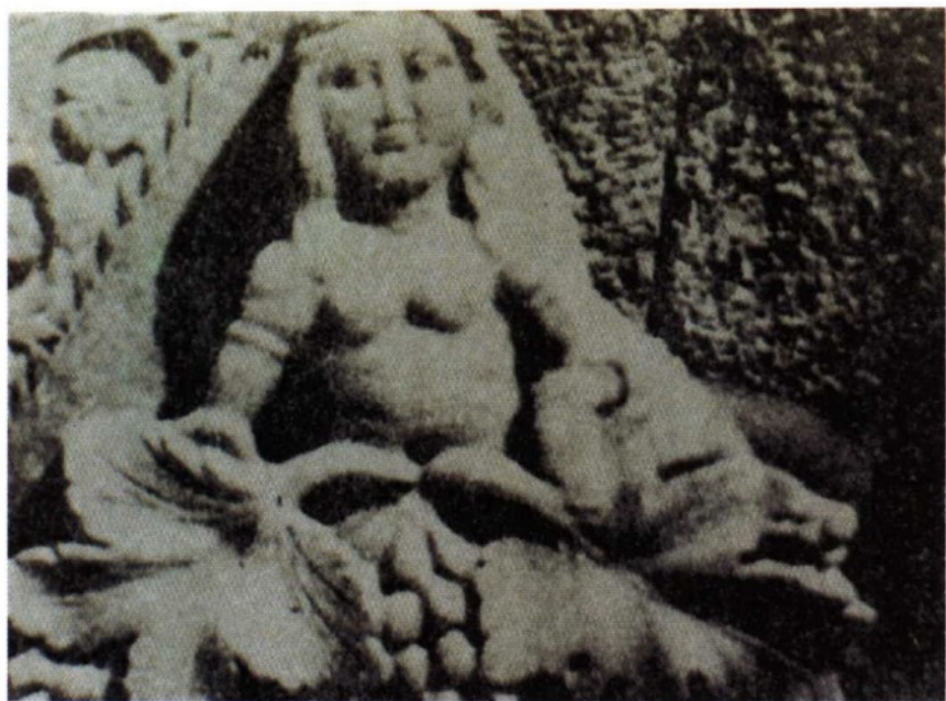
萨巴王国时期的大理石妇人雕像