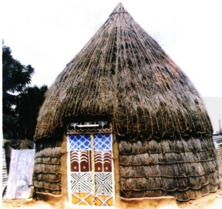
帖哈麦地区的传统民居