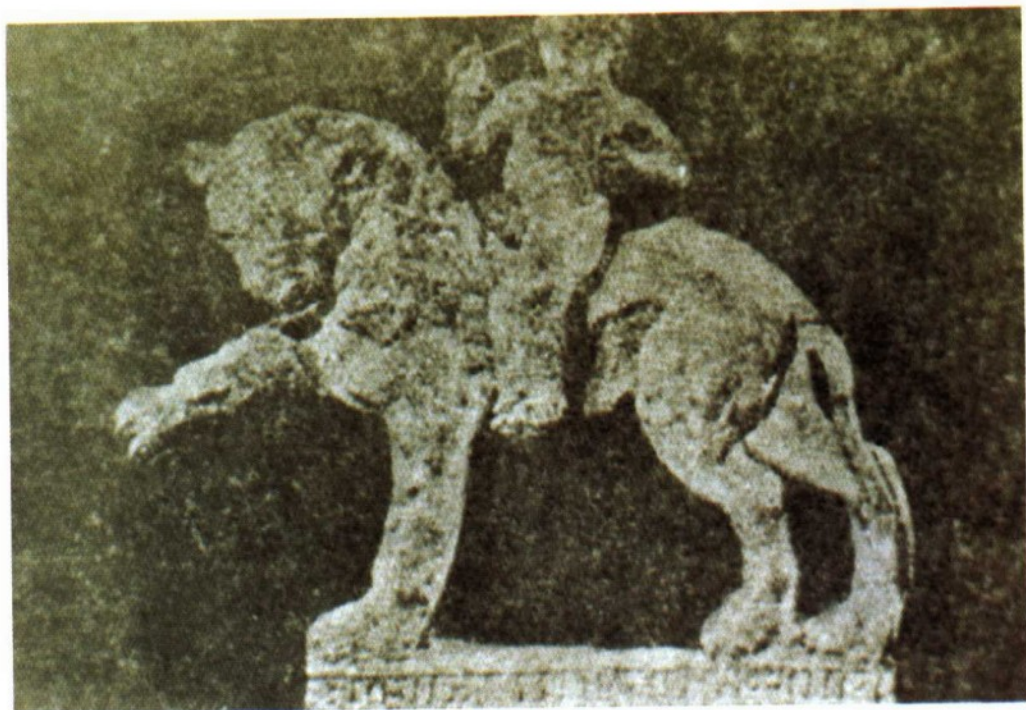
盖大班王国时期的青铜男童骑狮像