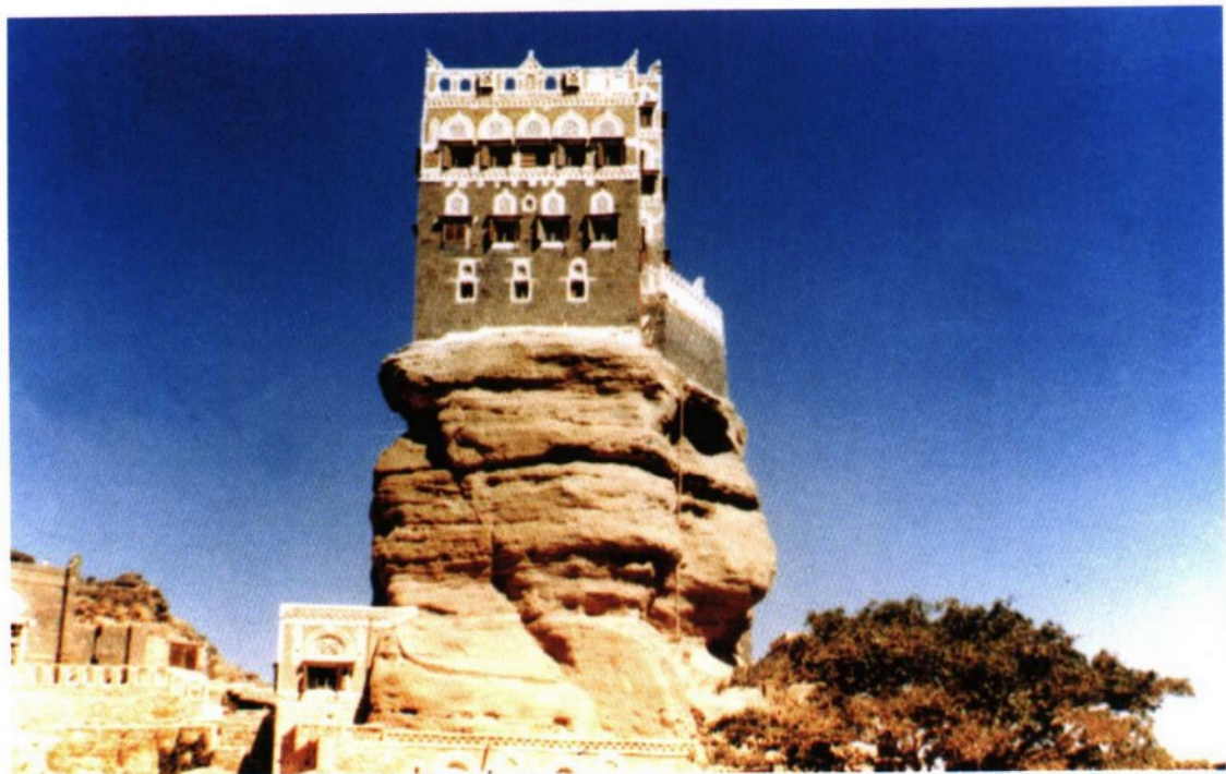
萨那郊外盘石上的王官