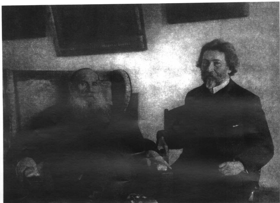
列夫·托尔斯泰和画家列宾(1908年)