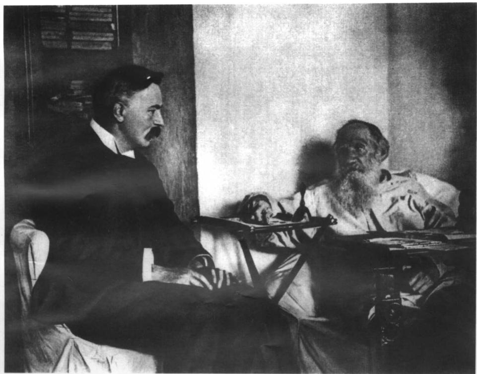
列夫·托尔斯泰和英国翻译家赖特(1908年) 赖特带来有萧伯纳、威尔斯等八百多英国作家、艺术家 和学者签名的生日贺信。