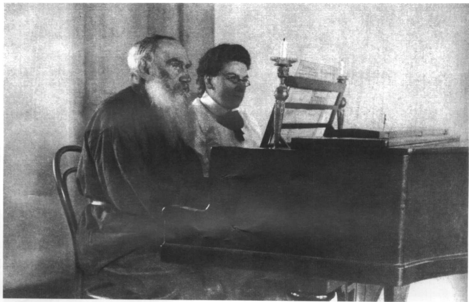
列夫·托尔斯泰和女儿亚历山德拉一起弹钢琴(1907年)