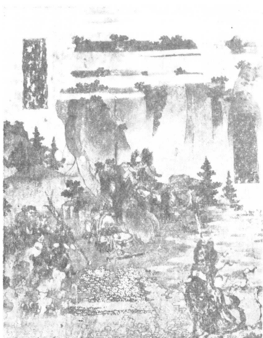
岩山寺文殊殿东壁 佛本生故事之二