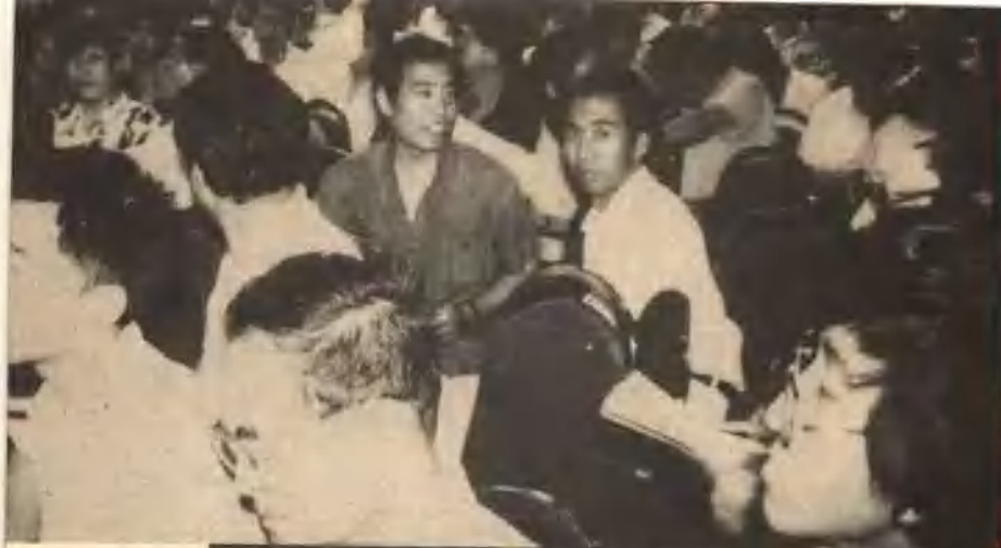
北京第三 届民间邮品拍 卖·1990