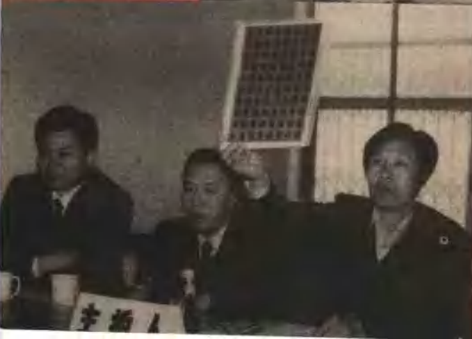
山东淄博邮票拍卖会 · 1992