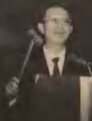
邮票设计家 画稿拍卖·1993