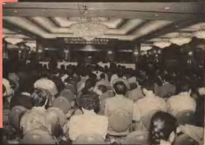
王府饭店水晶宫拍卖现场