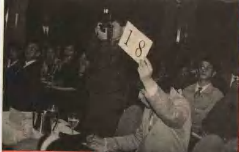
拍卖现场 · 1993