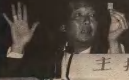
上海第8届集邮 活动日拍卖会·1993