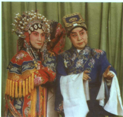
著名晋剧表演艺术家牛桂英(左, 现年78岁)、郭凤英(现年82岁)在《二度梅》中饰演梅良玉、陈杏元