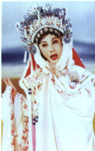
粤剧大师红线女粤剧剧照(现年76岁)