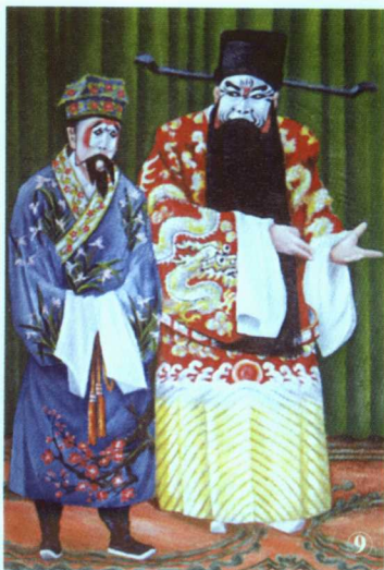
⑨ 著名京剧表演艺术家袁世海在《群英会》中饰曹操（现年83岁） （谷鸿麟绘制）