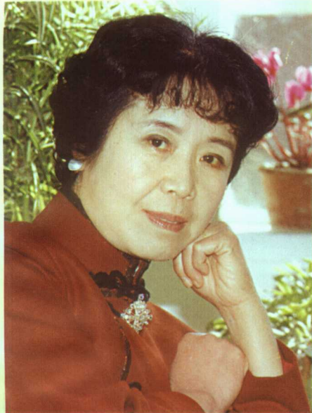
郎咸芬 山东省吕剧院名誉院长、艺术总监、国家一级演员、国家文化表演奖获得者