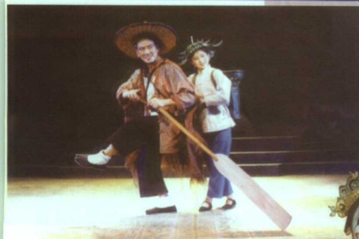
新编民间故事川剧《双脸》剧照