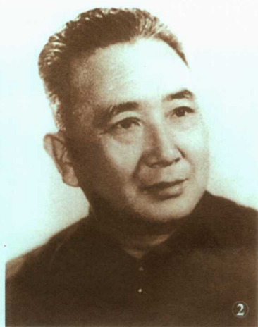
② 南麒北马关外唐之一的唐韵笙