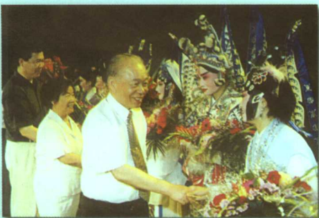
政协副主席张克辉接见北京公演的歌仔戏毕业生

方戏曲大专班,2000年7月在北京长安大戏院成功举办毕业公演,中央电视台做专题向国内外播放。2002年7月该班毕业生应邀组成厦门青年歌仔戏团赴台湾巡演,获得圆满成功。