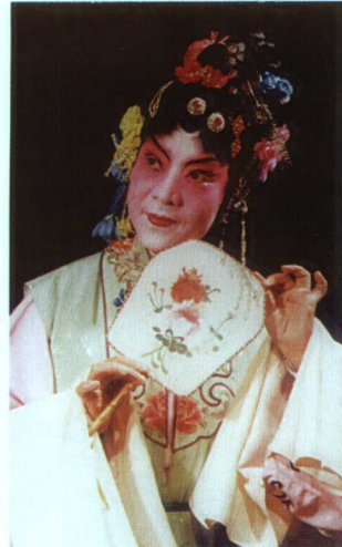
著名蒲剧表演艺术家王秀兰《西厢记》饰红娘(现年71岁)