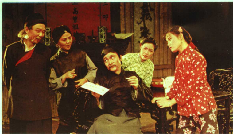
三幕方言喜剧《抓壮丁》剧照