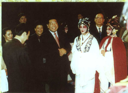
贾庆林同志视察《琵琶记》剧组