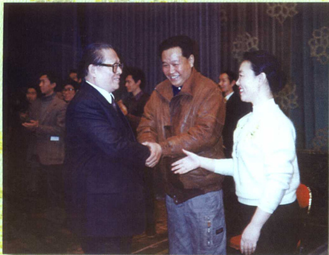
1990年在中海海怀仁堂，江泽民接见侯少奎、洪雪飞