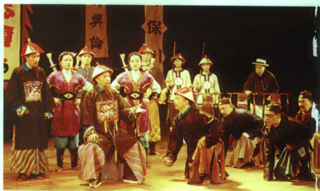
《辛亥潮》剧照 编剧徐柔 导演陈坪 舞美设计许靖 主要演员孙滨、翁显樵、李鉴秋、吴德恩、李国华、贾建立等