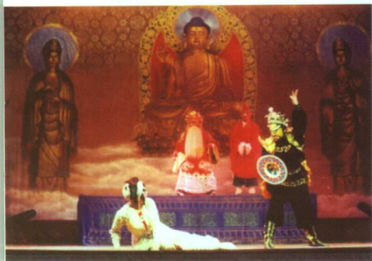
川剧传统戏《白蛇传》剧照

地址：中国四川省成都市状元街20号 传真：(028) 86658400 邮编：610016 联系电话：(028) 86679862 网址： http://www.scdrama.com E-Mail: scdrama@163.com