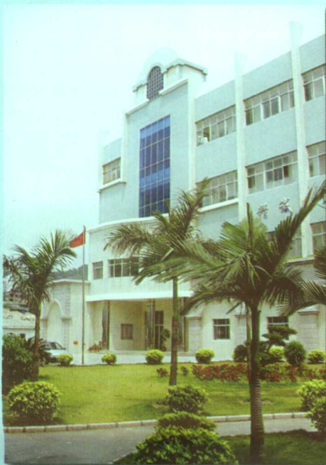
厦门戏曲舞蹈学校校舍一角