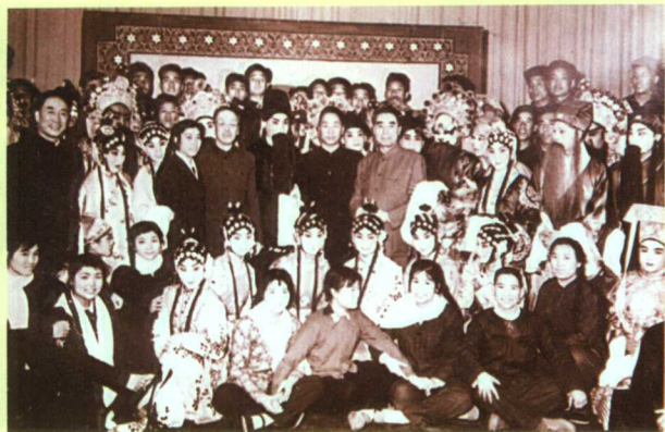
看蒲剧青年团演出后与全体人员合影 1963年周恩来总理、薄一波副总理观