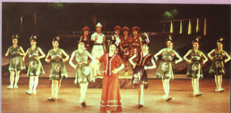
大型风情壮剧《歌王》剧照