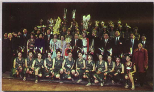
钱其琛副总理和《歌王》剧组合影