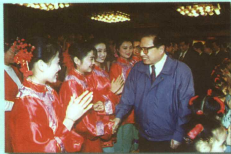
原全国人大委员长乔石在厦门接见戏曲班学生