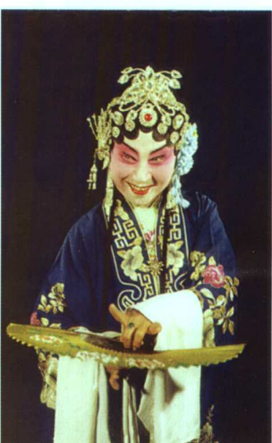
著名晋剧表演艺术家程玉英《二堂献杯》饰田夫人(现年83岁)