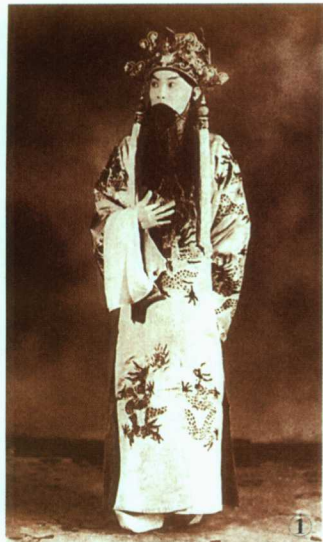
① 后四大须生之一奚啸伯在京剧 《上天台》中饰演的刘秀