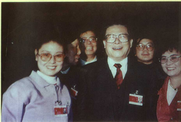
江泽民主席与任跟心(左一)同志合影留念