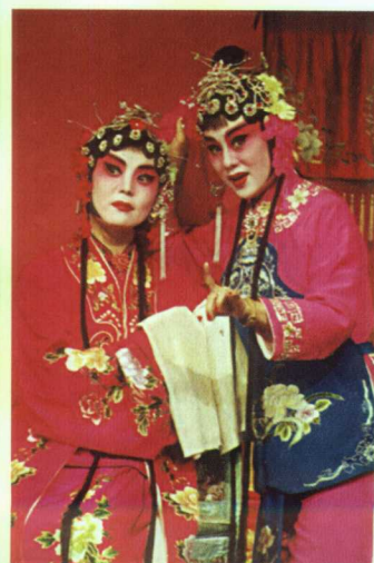
吕剧传统戏《姊妹易嫁》剧照