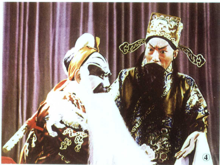
① 前四大须生之一俞叔岩在京剧《定军山》中饰演的黄忠