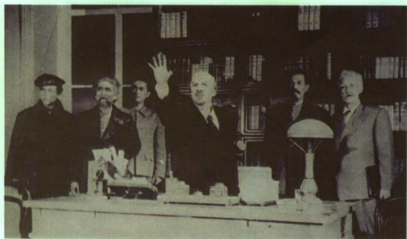
四幕话剧《克里姆林宫的钟声》剧照