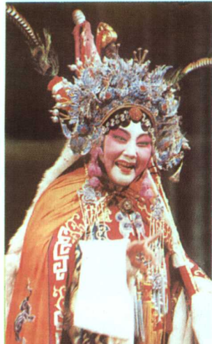
著名豫剧表演艺术家马金凤《杨门女将》饰穆桂英(现年81岁)