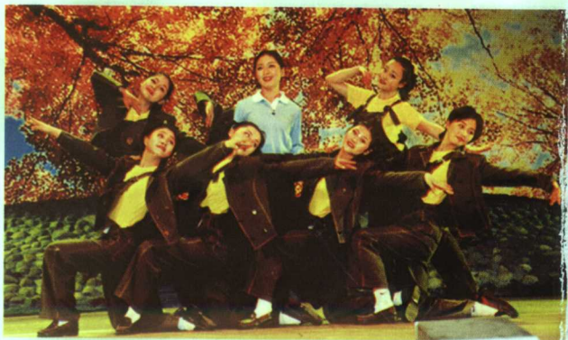
《未来组合》剧照 编剧李亨 导演熊源伟 作曲李海鹰 编舞马东风 舞美设计李艺梅 灯光设计刘建中 主要演员王威、白萆、陈浩、周朗、刘虹利等