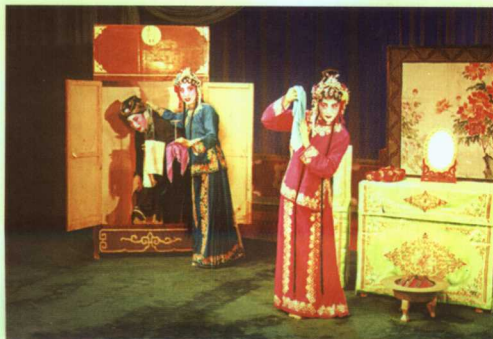
吕剧传统戏《借年》剧照