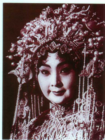
⑦ 汉剧艺术大师陈伯华在汉剧《状元媒》中饰柴郡主（摄于1960年，现年84岁）