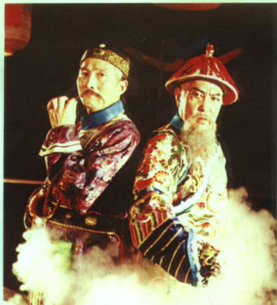
四幕话剧《辛亥潮》剧照