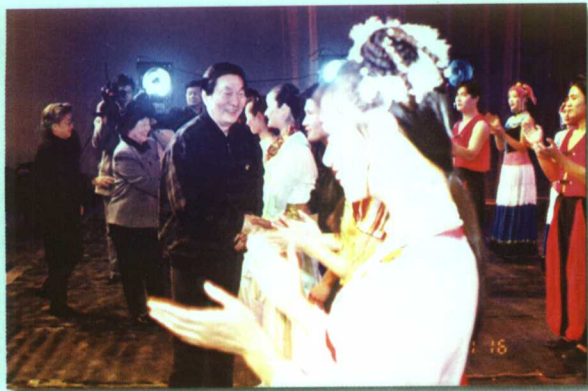
朱镕基总理在厦门接见演出后师生