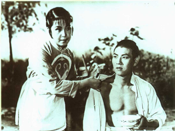
吕剧现代戏《李二嫂改嫁》剧照