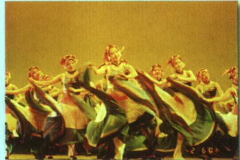
表演中的舞蹈班学生