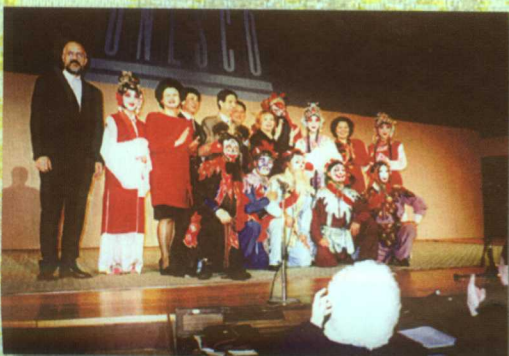
在巴黎联合国教科文组织总部汇报演出