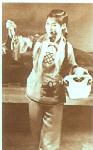
著名评剧表演艺术家韩少云《小女婿》饰香草(现年72岁)