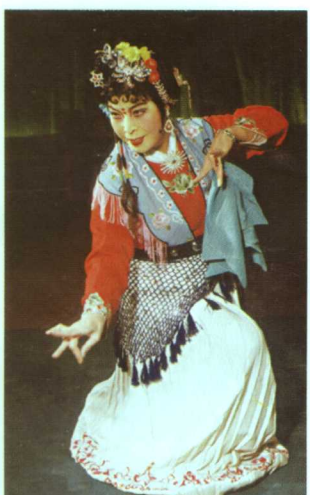
著名评剧表演艺术家花淑兰《茶瓶计》饰春红(现年74岁)