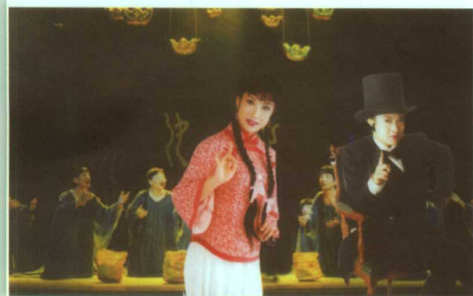
新编川剧《好女人、坏女人》剧照