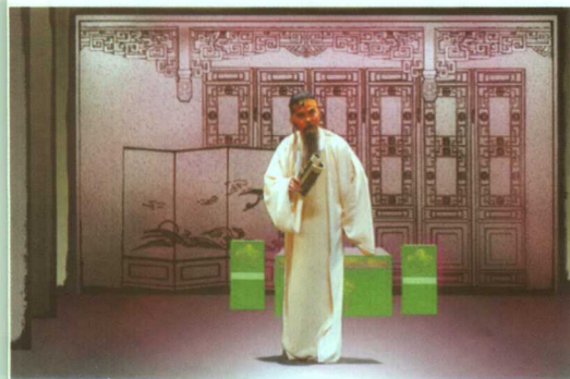
新编川剧《巴山秀才》剧照