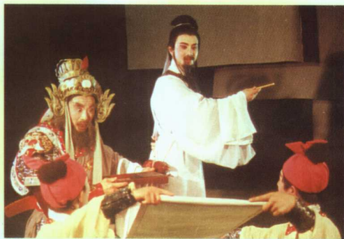
吕剧新编历史剧《画龙点睛》剧照