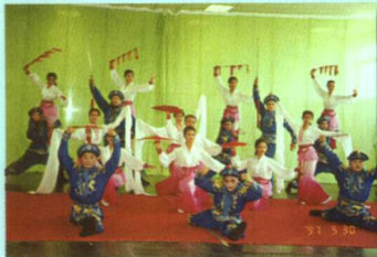
排练中的戏曲班学生