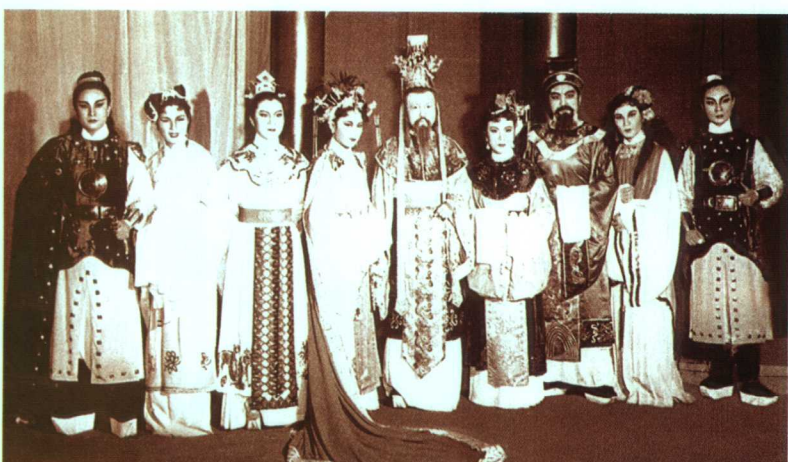
著名越剧表演艺术家袁雪芬等1947年《山河恋》剧照左起: 尹桂芳(饰申息)、傅全香(饰戴赢)、徐玉兰(饰纪苏公子)、竺水招(饰锦姜)、吴小楼(饰梁僖公)、筱丹桂(饰宓姬)、徐惠琴(饰黎瑟)、袁雪芬(饰季娣)、范瑞娟(饰钟咒)