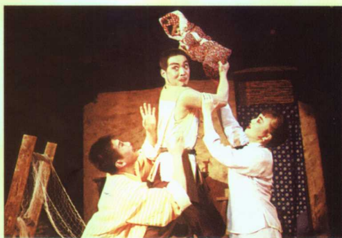
吕剧现代戏《石龙湾》剧照