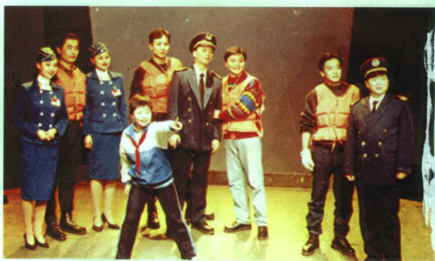
《船过三峡》剧照 编剧李亨 导演卢昂 李鉴秋 舞美李艺梅 主要演员宣晓鸣、卢茜、胡之琪、贾建立、董凡、张健等