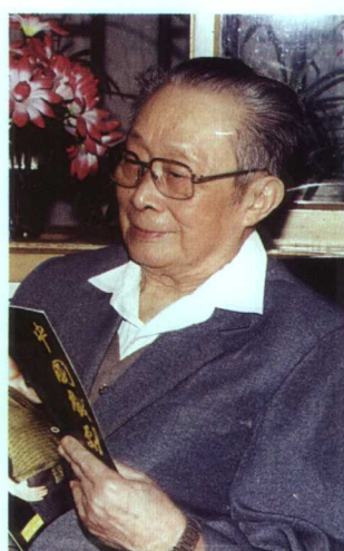
著名川剧表演艺术家袁玉堃(原名彭预升)近照(现年86岁)