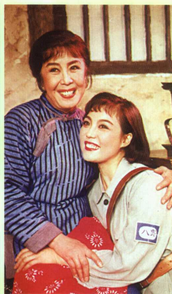
吕剧现代戏《苦菜花》剧照