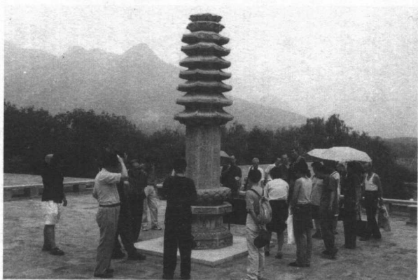
圖B.6 “佛教物質文化”國際學術研討會與會者房山游。北京大學。2001年6月30日。 Merit Conference participants. Fang Shan excursion, June 30, 2001.