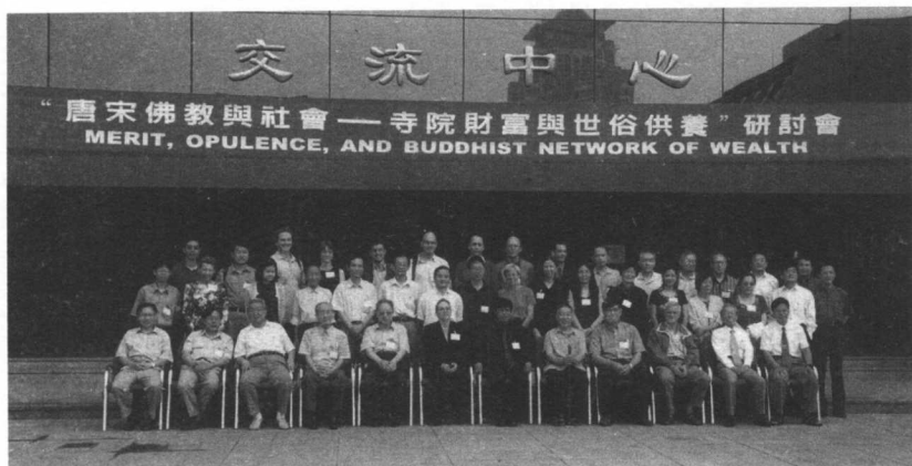
圖B.2 “佛教物質文化”國際學術研討會與會者。北京大學。2001年6月27—30日。 Merit Conference participants, June 27 — 30, 2001.