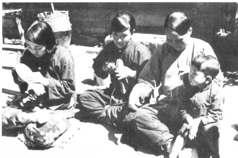
五台地区的妇救会会员给八路军做鞋