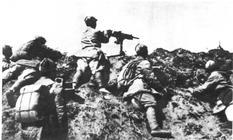
狮脑山战斗中的我军机枪阵地