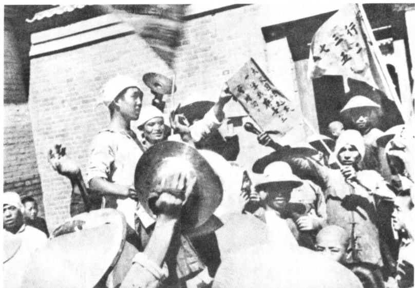
根据地农民欢庆减租减息的胜利