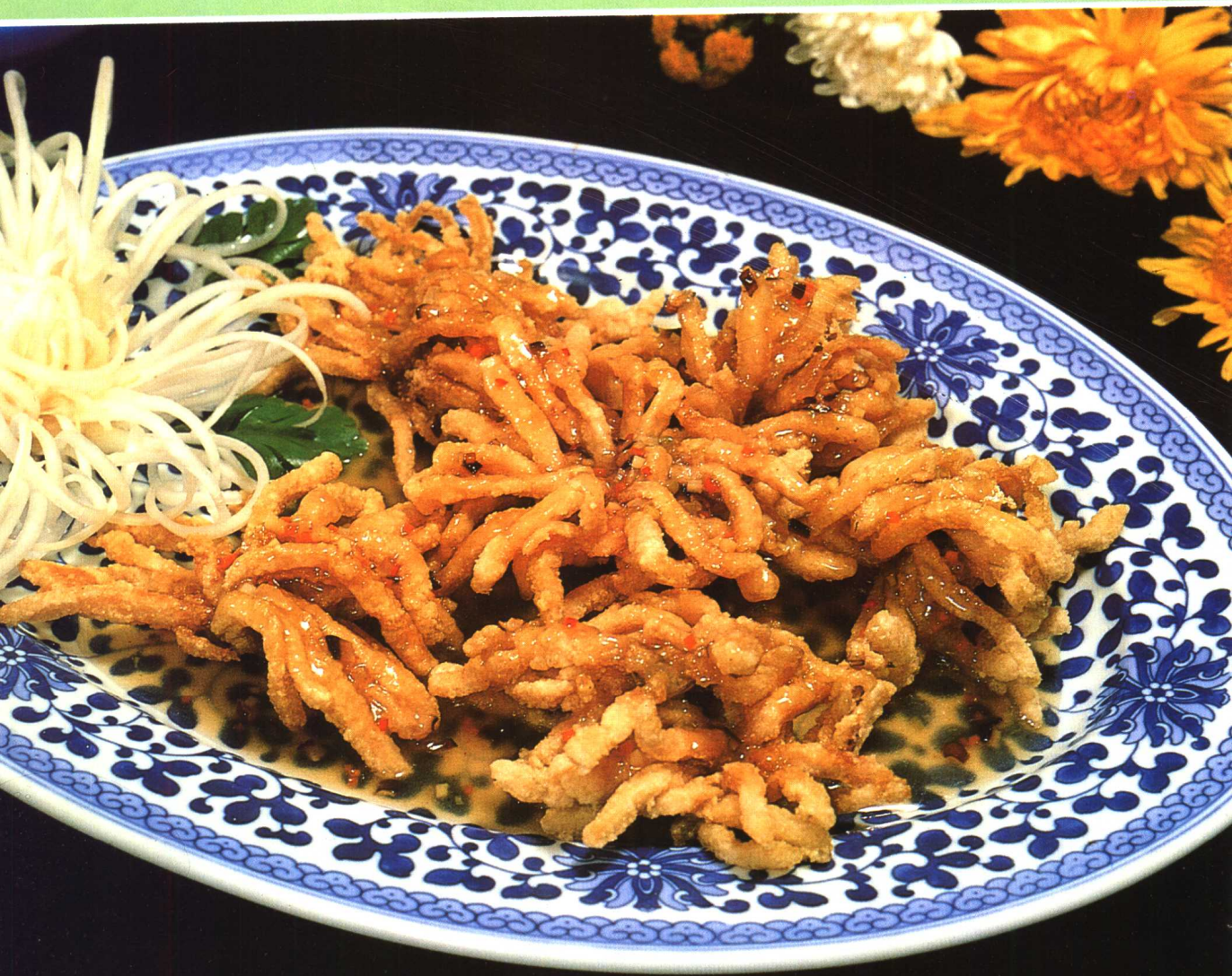
△ 菊花鲈鱼 见水产菜 120