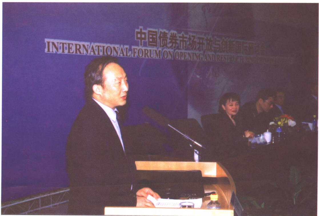
中国人民银行货币政策司司长戴根有在研讨会上作“货币政策与债券市场发展”专题报告