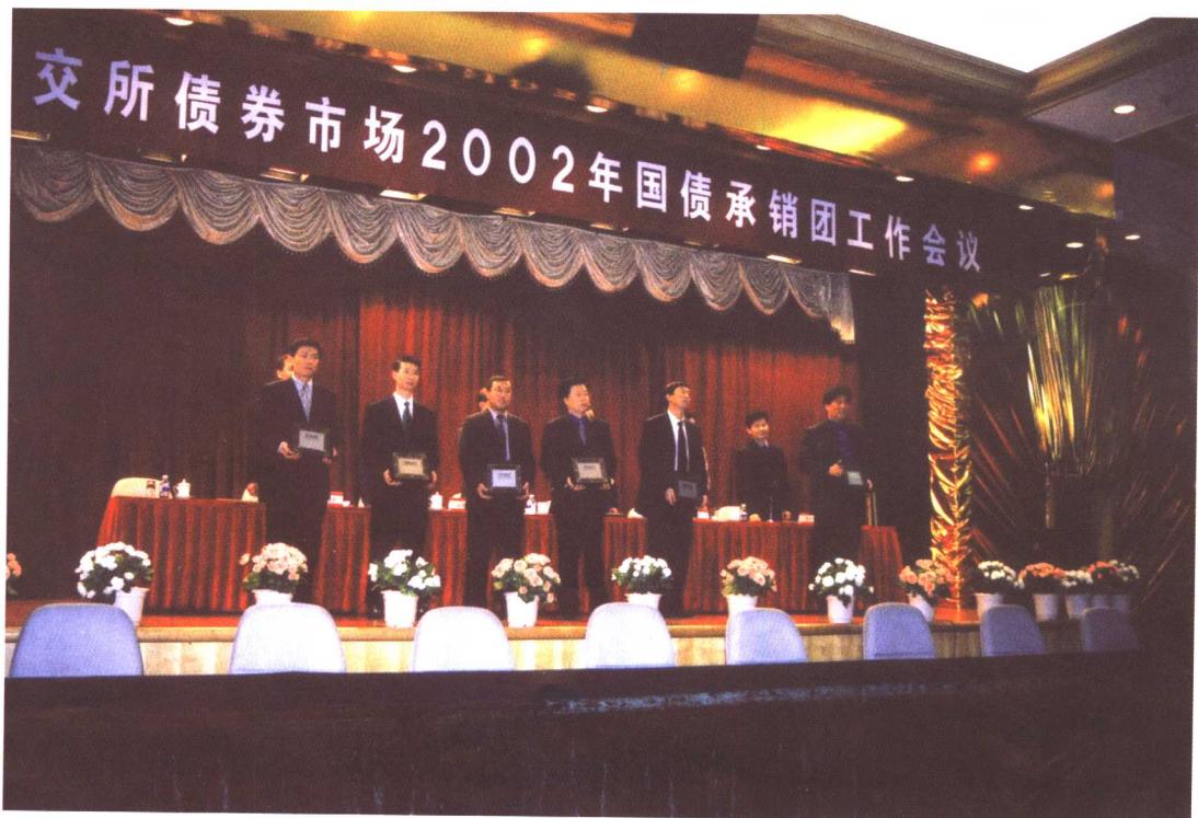
“证券交易所债券市场2002年国债承销团工作会议”在北京召开，50家机构获得国债承销团成员资格