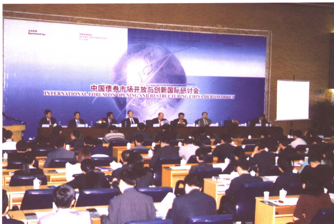
2002年4月，中国国债协会、中国银河证券有限责任公司、中国平安保险股份有限公司、德意志银行集团联合在西安召开“中国债券市场开放与创新国际研讨会”