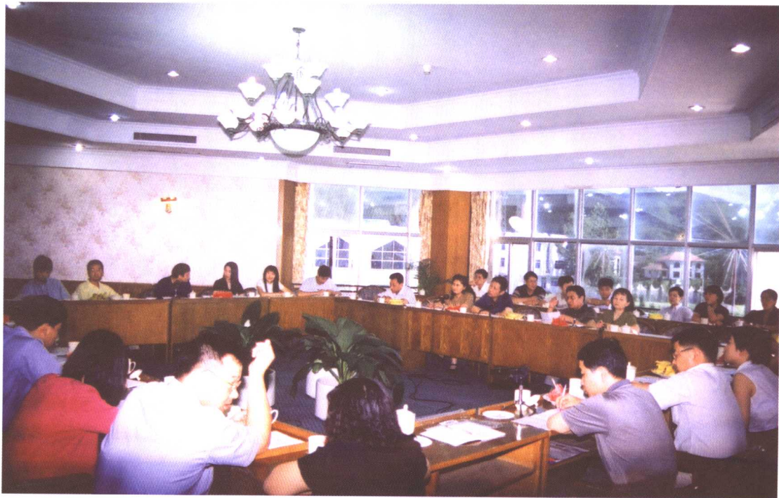
2002年8月，中国国债协会在北京召开了银行间债券市场座谈会