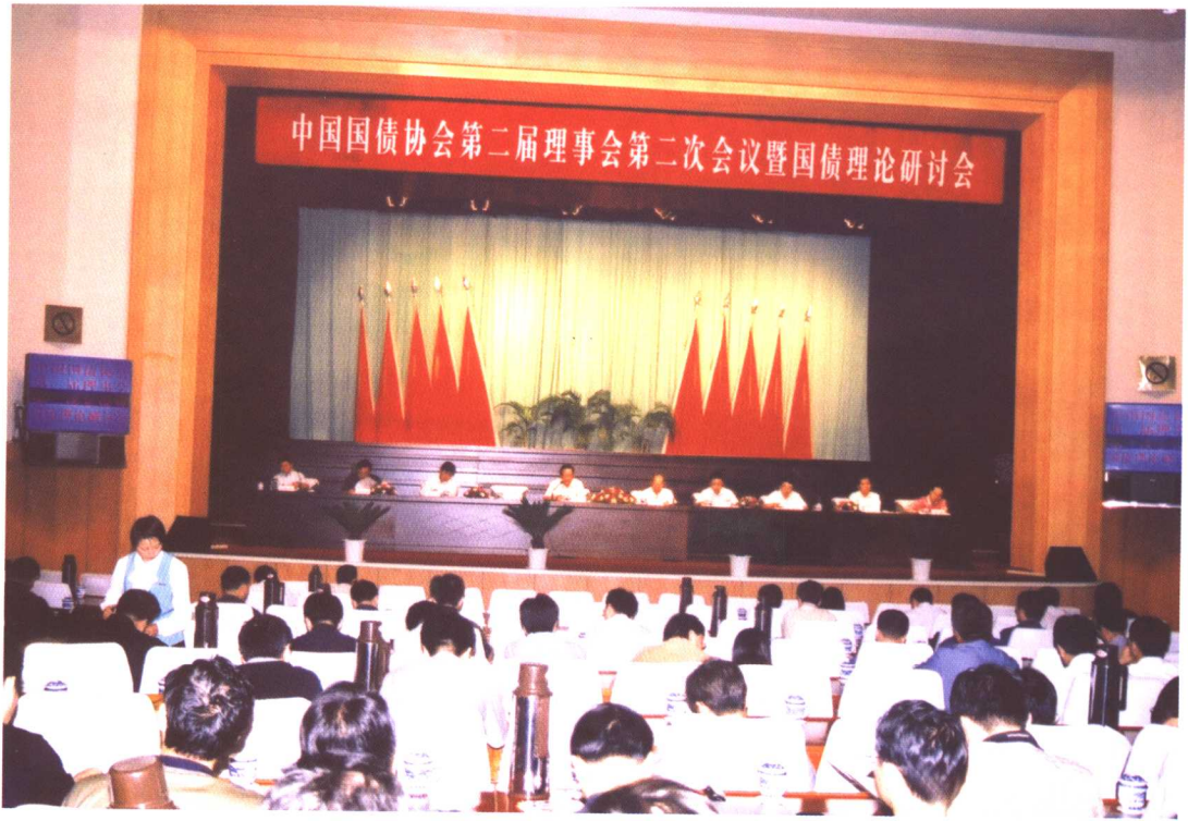
2001年7月15日，中国国债协会在黑龙江省牡丹江市召开“第二届理事会第二次会议暨国债理论研讨会”