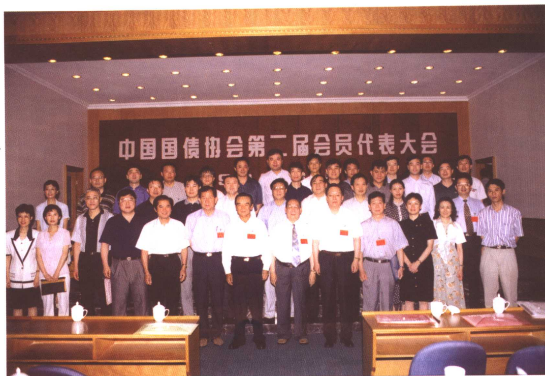
1999年6月16日，中国国债协会召开第二届会员代表大会，选举产生了第二届理事会（图为部分常务理事合影）