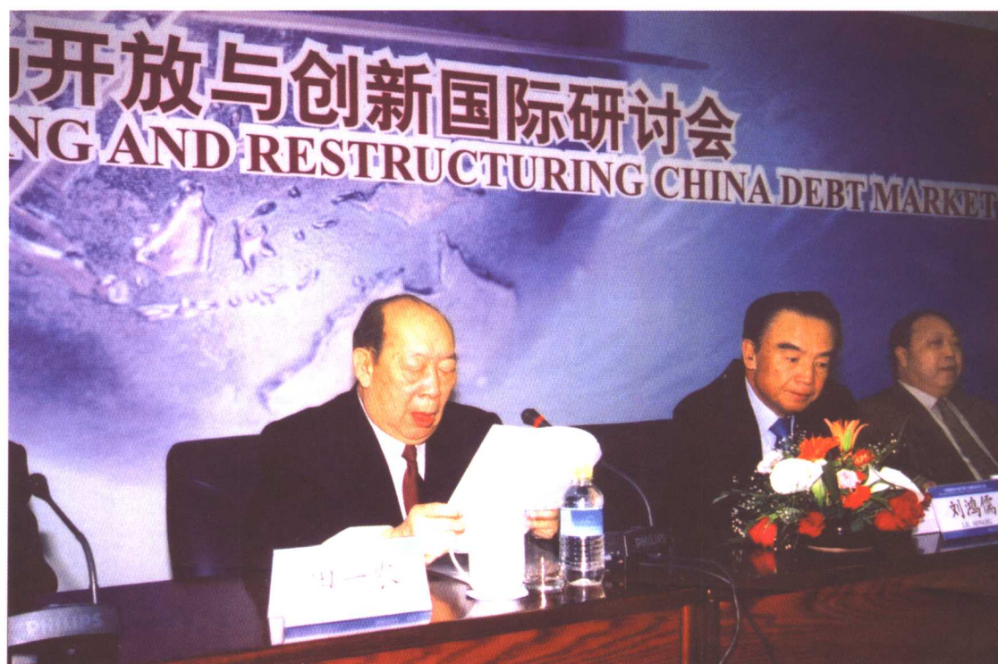
中国国债协会会长田一农在研讨会开幕式上讲话