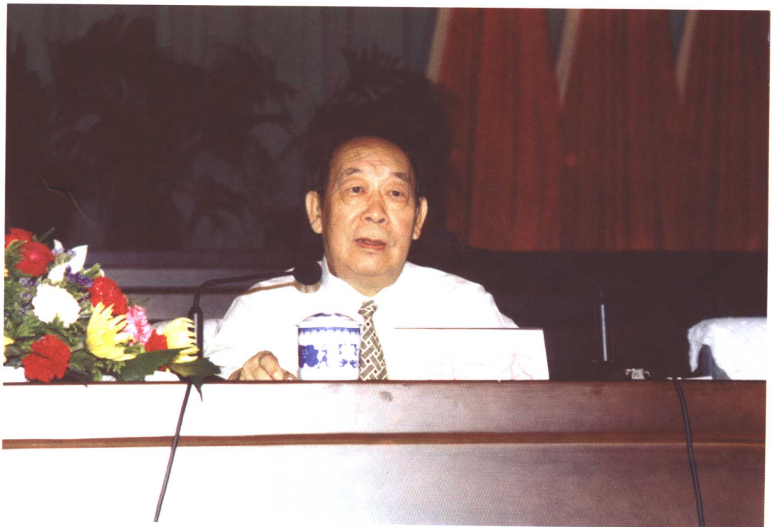
田一农会长作协会工作报告