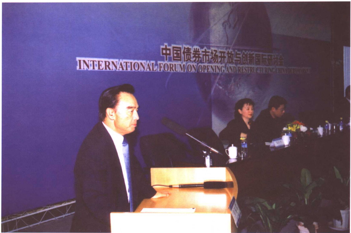
全国政协经济委员会副主任、中国国债协会副会长刘鸿儒和中国银河证券有限责任公司总裁朱利在研讨会上作“中国债券市场的发展趋势——创新与国际化”主题报告