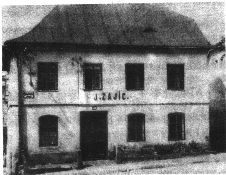
弗洛伊德出生的房子，捷克弗莱堡。

归属于奥地利。弗莱堡曾是手工纺织业的中心。在 19 世纪中叶，由于机织业和铁路的兴起，手工纺织业逐渐走向没落，弗莱堡也日渐萧条。