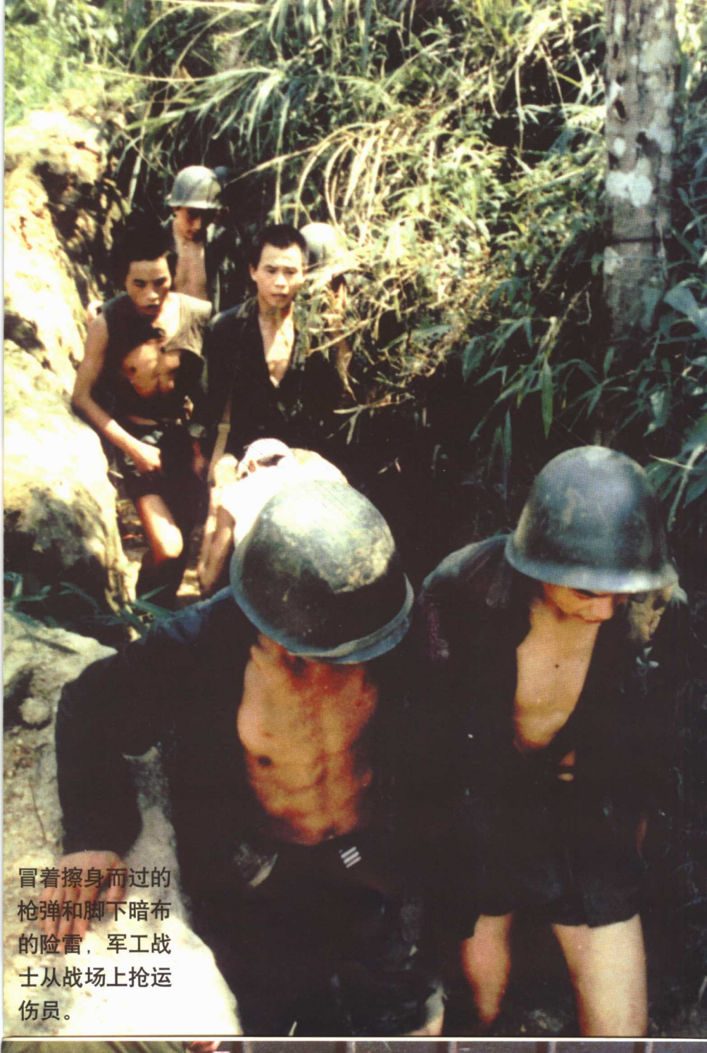
冒着擦身而过的枪弹和脚下暗布的险雷，军工战士从战场上抢运伤员。