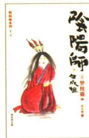
阴阳师：生成姬 定价：18.00元