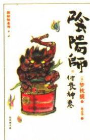
阴阳师：付丧神卷 定价：20.00元