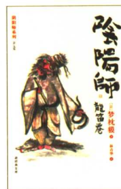
阴阳师：龙笛卷 定价：16.00元