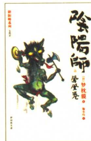
阴阳师：凤凰卷 定价：18.00元