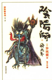
阴阳师：飞天卷 定价：18.00元