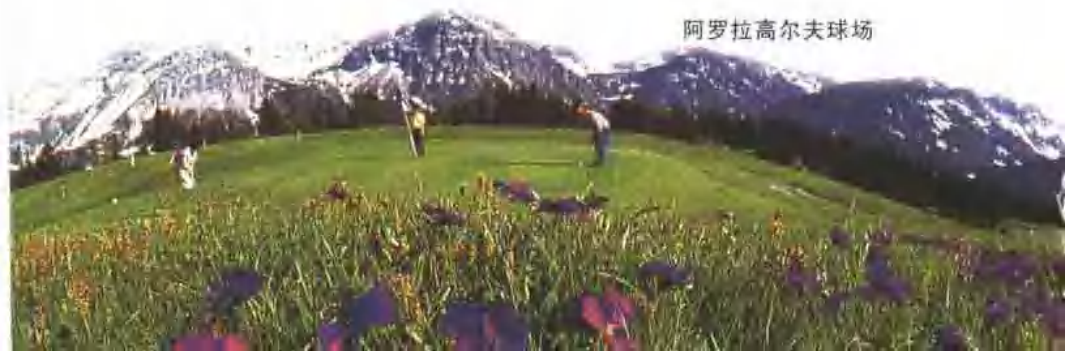
阿罗拉高尔夫球场