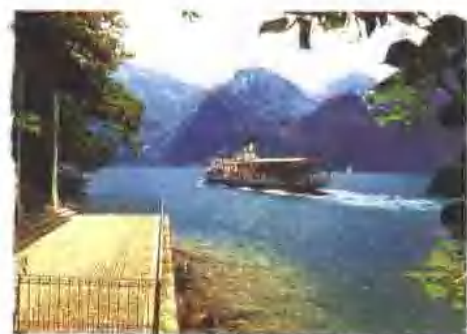
泰尔教堂与卢塞恩湖