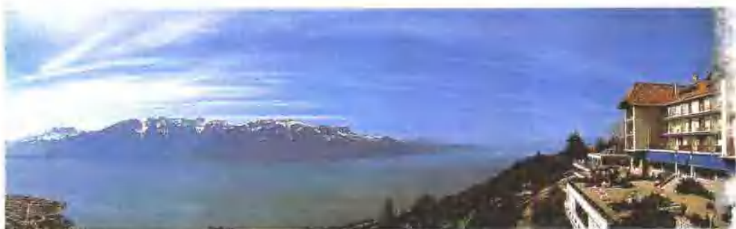
传统风格的西欧渡假旅店