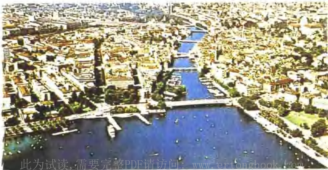
第一大都市——苏黎世