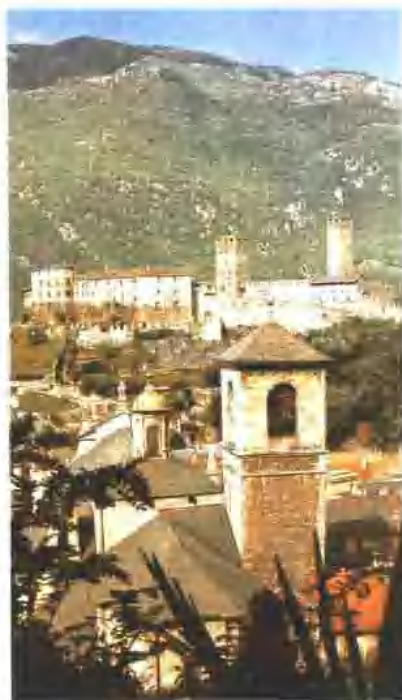
贝林佐纳大城堡所在的老区