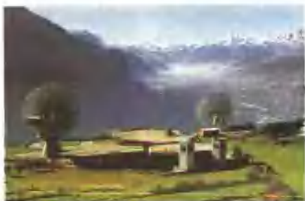
勒克的卫星接收站