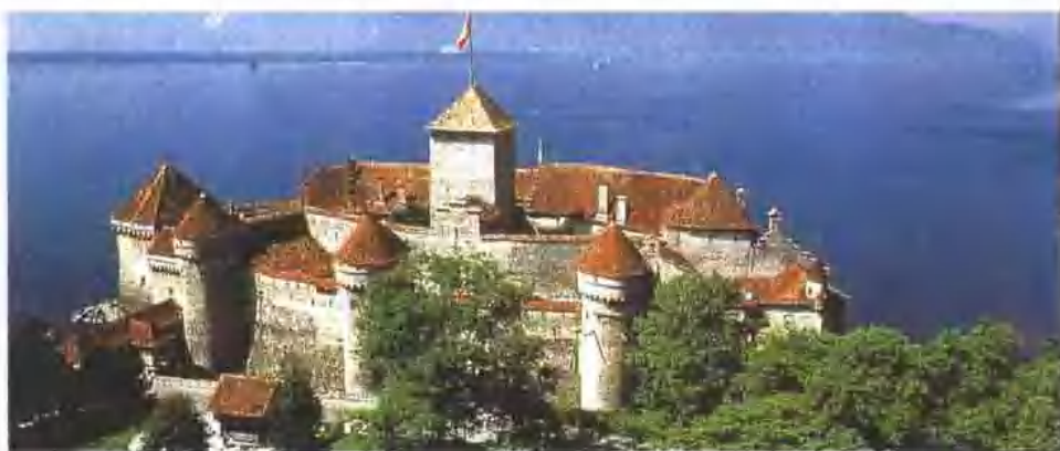
日内瓦湖齐伦古堡