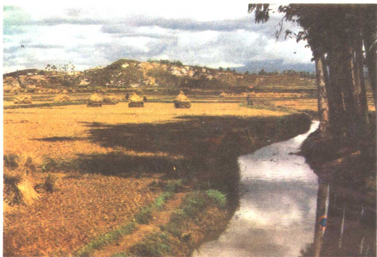
西南晋宁石寨山滇王墓葬遗址