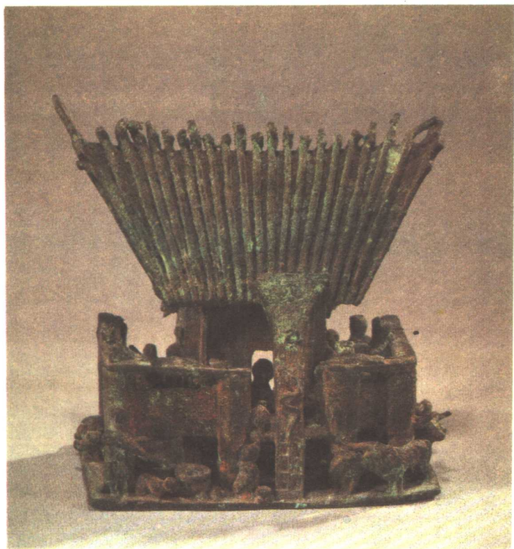
晋宁石寨山出土人物屋宇扣饰 (M 3 : 64)