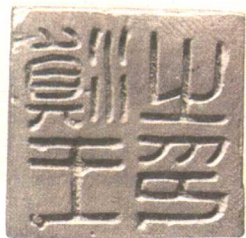
滇王之印：晋宁石寨山出土（M6：34）