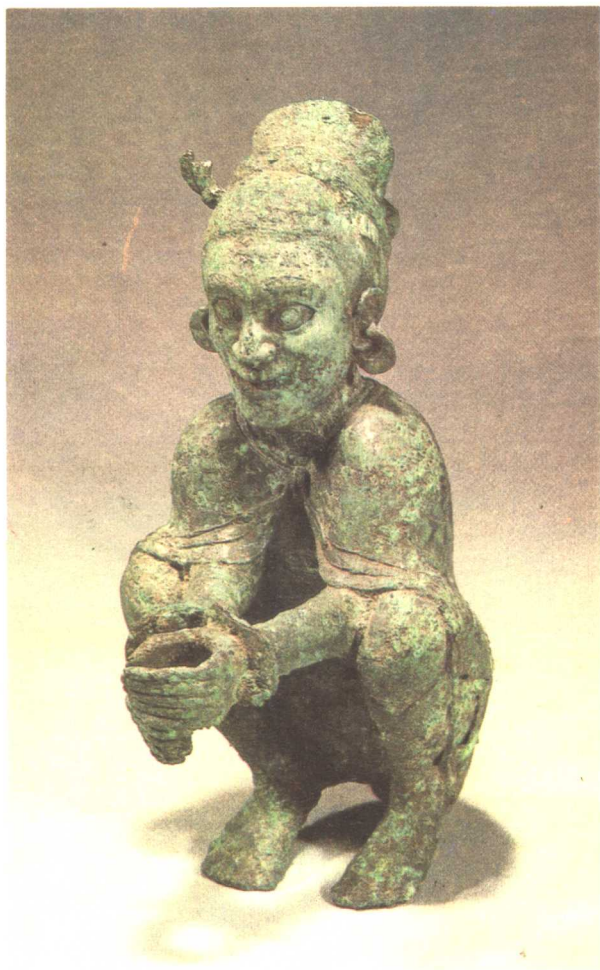
晋宁石寨山出土青铜人物铸像 (M18:1)