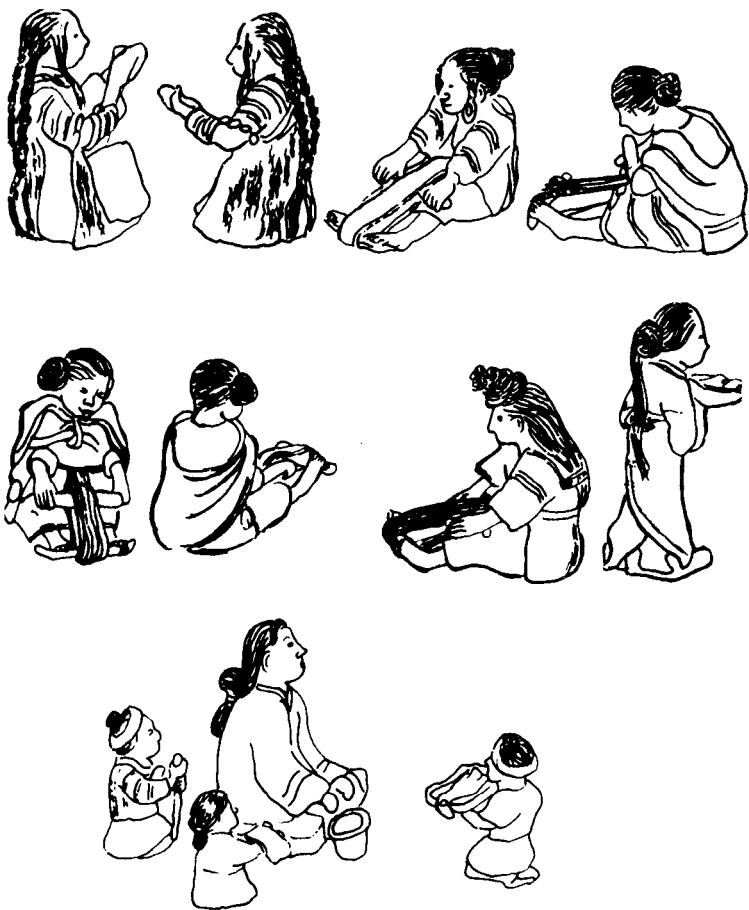
晋宁石寨山出土青铜贮贝器 (M1) 所铸“纺织”场面人物形象摹图