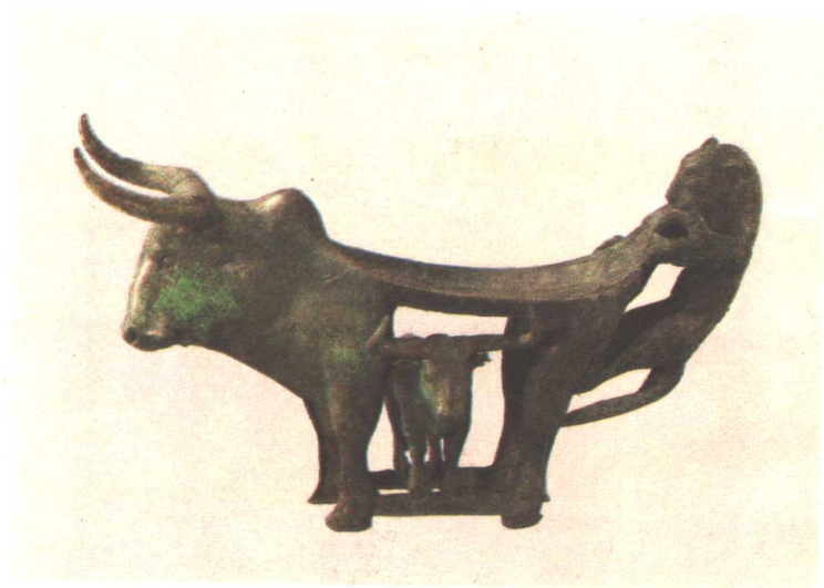
云南江川李家山出土牛虎铜案