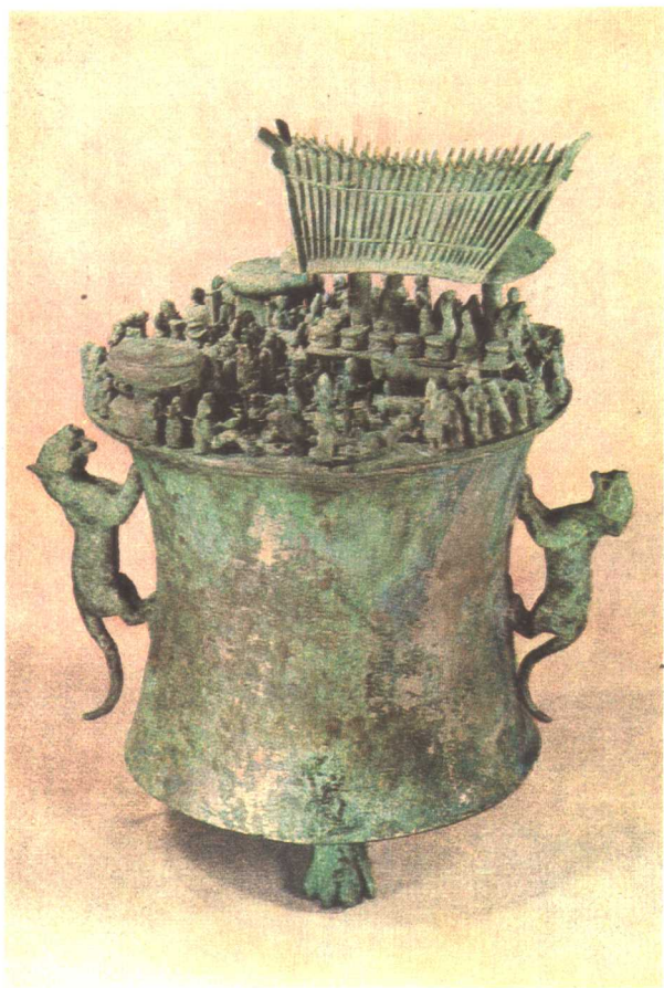
晋宁石寨山出土杀人祭柱场面贮贝器 (M12:26)