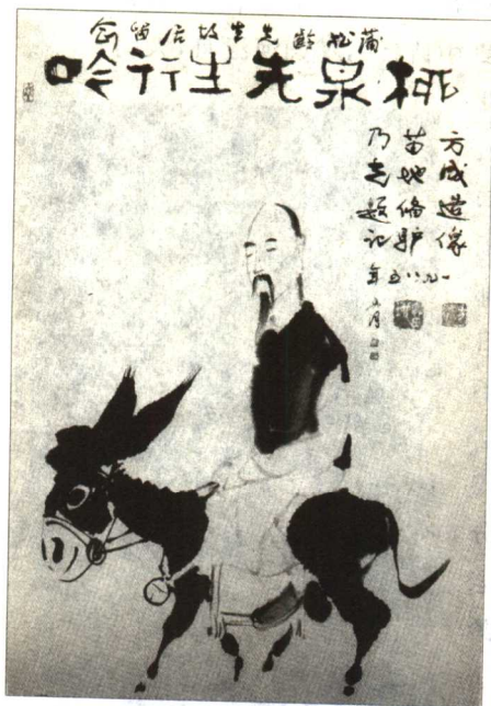
柳泉先生行吟图 方成画

蒲松龄 30 多岁时，四个孩子陆续出生，父亲故去，老母在堂，他到了“家徒四壁妇愁贫”的地步，有时不得不卖文为活，替别人写文章挣几个钱，比如说写封婚书，写篇祭文，报酬不过是一斗米，或者一只鸡，两瓶低档的酒。蒲松龄最犯愁的就是怎样