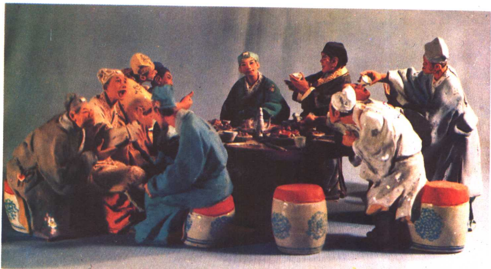
2. 西门庆热结十兄弟