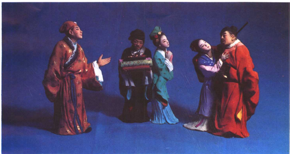
5. 西门庆行贿蔡状元