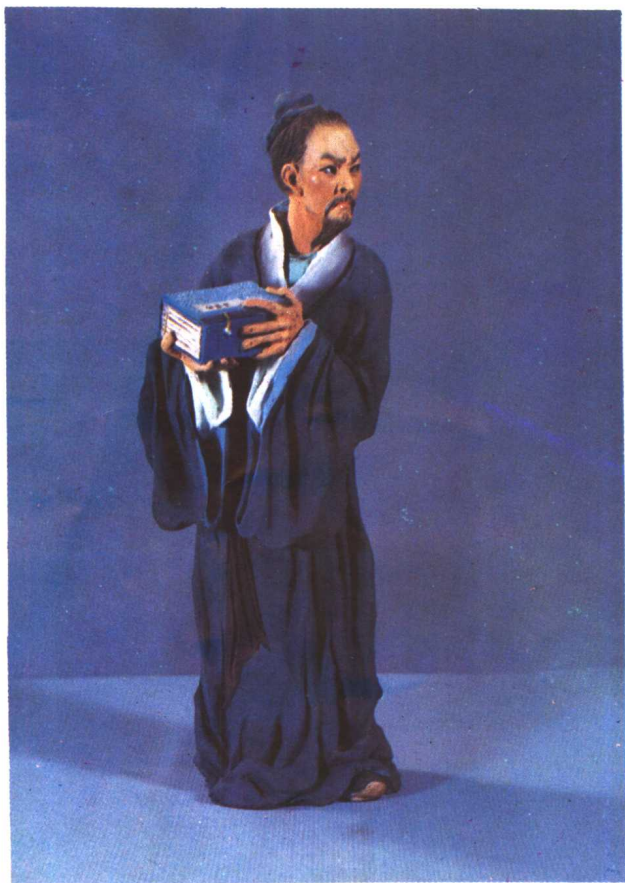
1. 《金瓶梅词话》作者——兰陵笑笑生