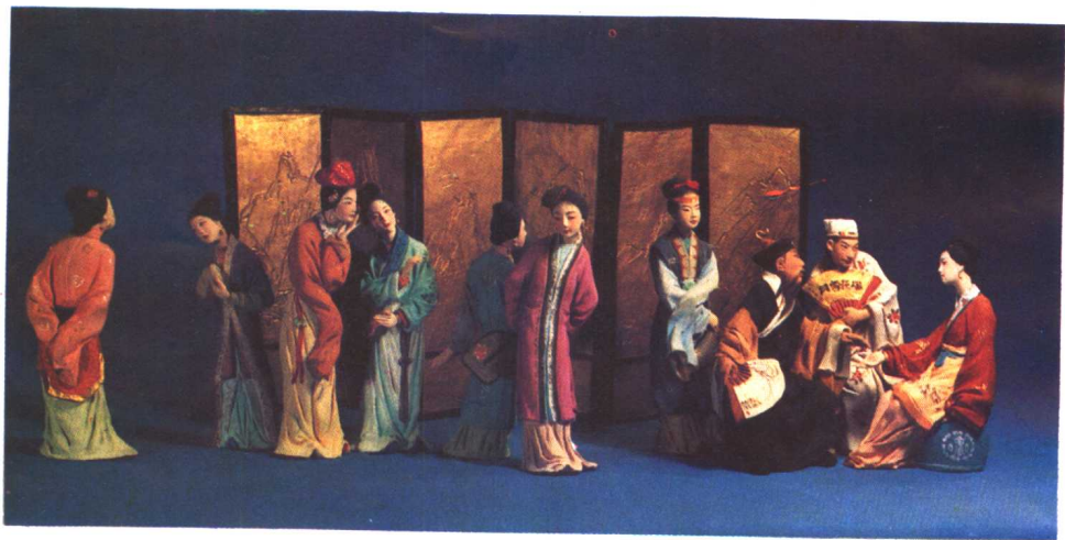
3. 吴神仙冰鉴定终身