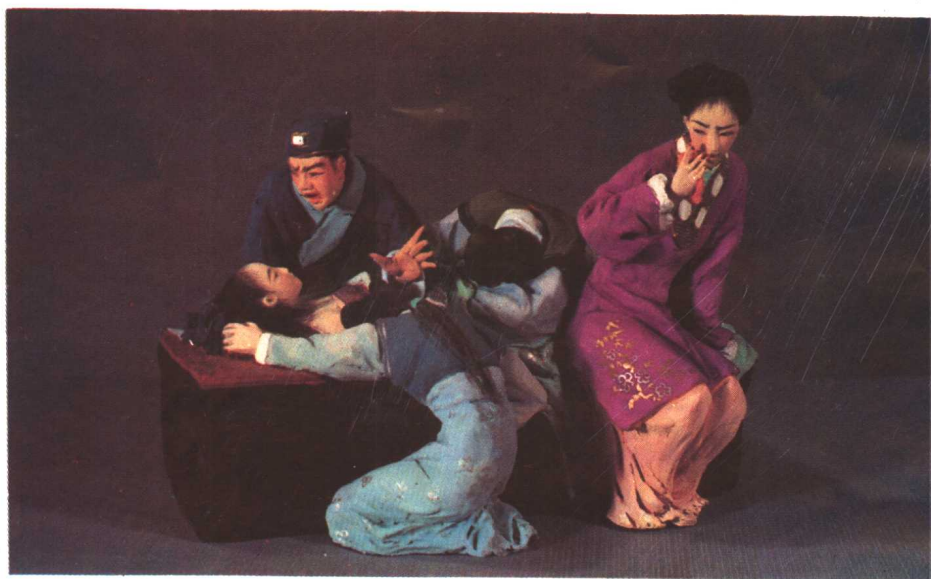
7. 西门庆痛哭李瓶儿