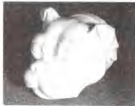
聖克盧瓷器 來自美國密西根州聖克盧

自 17 世紀最後 25 年至 1766 年產於法國聖克盧的一種軟質瓷。這種瓷器微帶黃色或奶油色，很受中國明朝後期白瓷的影響；出現了梅花紋飾的淺浮雕模塑和中國人神態的塑像。同時也有深浮雕裝飾技藝和以藍色與其他顏色繪畫在白瓷上的彩繪裝飾。在某些聖克盧瓷器的彩繪裝飾上，也可以看到 17 世紀後期日本所產柿右衛門陶瓷的影響。