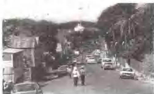
聖約翰斯街景

西印度聯邦內(英屬)安地瓜(背風羣島一島嶼)的首府。位於島的西北海岸，是一個遊覽地和安地瓜島的主要海港，進出口蔗糖、棉花、糧食、機械和原木。城市東北 10 公里(6 哩)處有柯立芝機場。名勝有聖公會大教堂，政府大廈和植物園等。人口約 30,000(1982)。