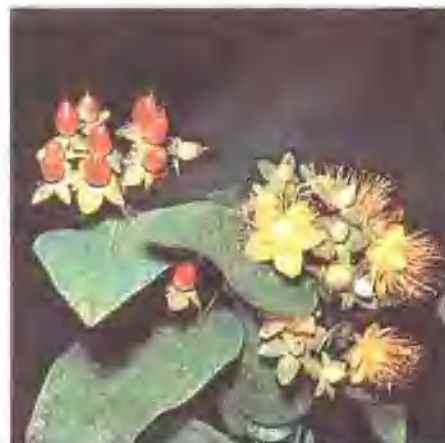
直立金絲桃( Hypericum elatum )

山茶目(Theales)金絲桃科(Hypericaceae)植物。8 屬 350 種，草本或低矮灌木。或認為應併入藤黃科(Guttiferaceae)。金絲桃科植物單葉，對生或輪生，有腺點，多全緣；花多為 5 瓣，以黃色為主，雄蕊多數，通常合生。金絲桃屬( Hypericum )約 300 種，原產於溫帶及熱帶。大萼金絲桃( H. calycinum )和金絲梅( H. patulum )均原產於東亞，灌木狀。前者花淡黃色，雄蕊橙黃色，株高 30 公分(1 呎)。後者花略小，深黃色，雄蕊顏色較深。原產於加那利羣島的直立金絲桃( H. elatum )果卵形，猩紅色。金絲蝴蝶(Saint-Andrew's-cross, 參閱該條；學名為 Ascyrum hypericoides )花黃色，為觀賞植物。黃牛木屬( Crotanylum )有 12 個亞洲熱帶種，其中多花黃牛木( C. polyanthum )是園藝植物，為芳香灌木，花粉紅色，長圓形，葉紙質，種子有翅。