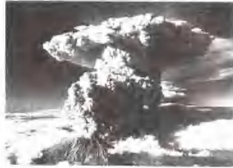
聖希倫斯火山在噴發

森林夷平。形成6,000公尺(20,000呎)高煙柱的火山灰降落帶覆蓋大拿州中部，數日內即形成環繞地球的火山灰帶。噴發後火山錐已遭破壞。5月25日再次噴發，因岩漿作用使火山口內形成穹丘。科學家預測該火山今後將持續活動約20年。