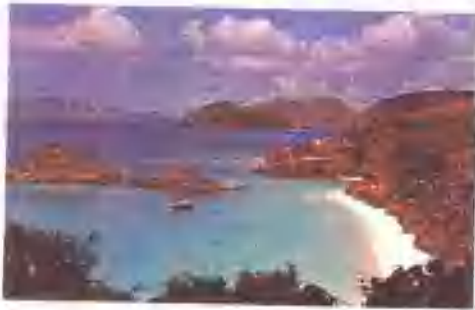
聖約翰島特蘭克(Trunk)灣

委屬維爾京羣島的行政區和最小的島嶼。在聖湯瑪斯島正東，全部面積50平方公里(20平方哩)，居民主要是聖人，分別集中在兩個聚落——島上東南端的首府克魯斯貝(Cruz Bay)和西海岸的科拉爾貝(Coral Bay, 西印度羣島中最好的避風港)。島上的經濟以養牛、採集月桂樹葉(運到聖湯瑪斯島製成香水)和旅遊業為主。全島85%的面積覆蓋著熱帶植被和次生林。1956年島上大部分的地區劃為維爾京羣島國家公園。人口2,472(1980)。