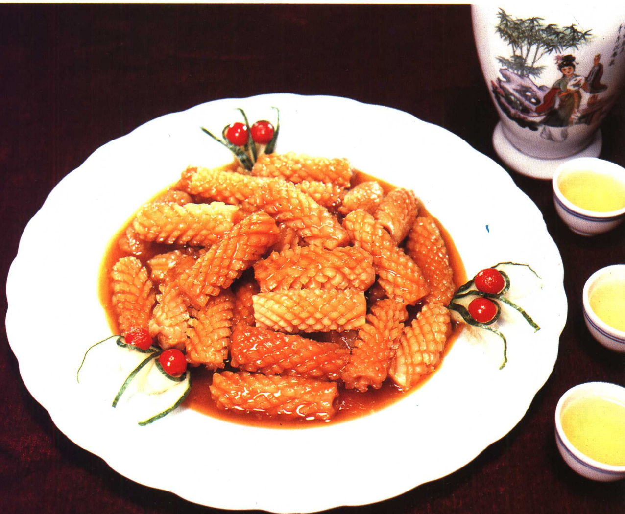
△ 糖醋鱿鱼卷 见水产菜 170