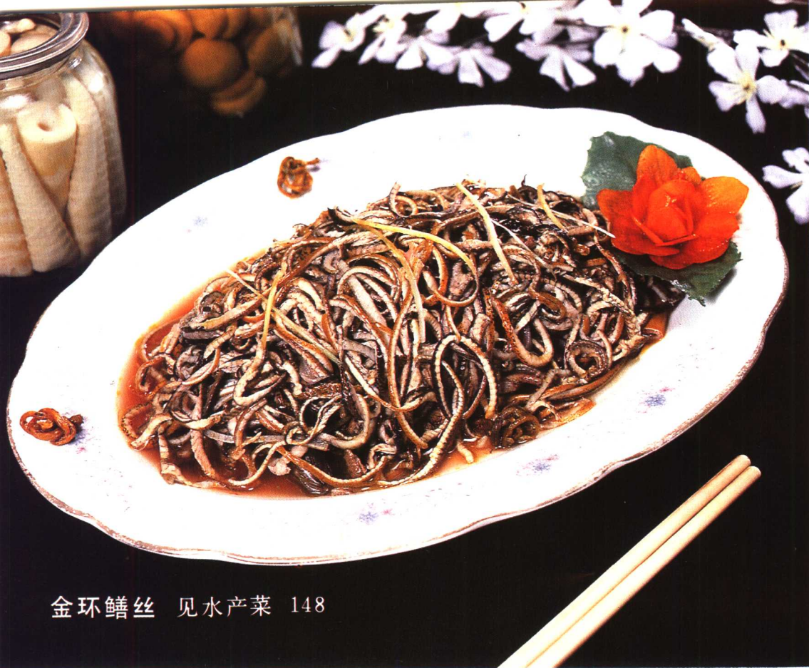
金环鳝丝 见水产菜 148