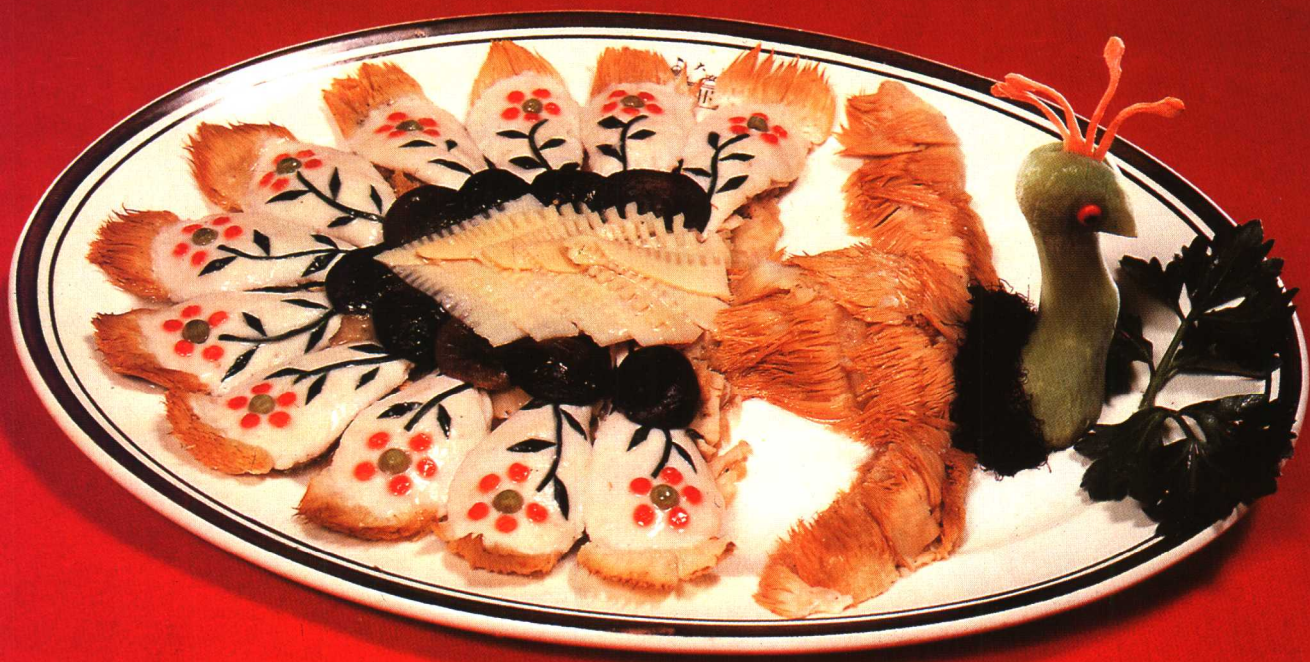
△ 孔雀猴头 见山珍海味菜 52