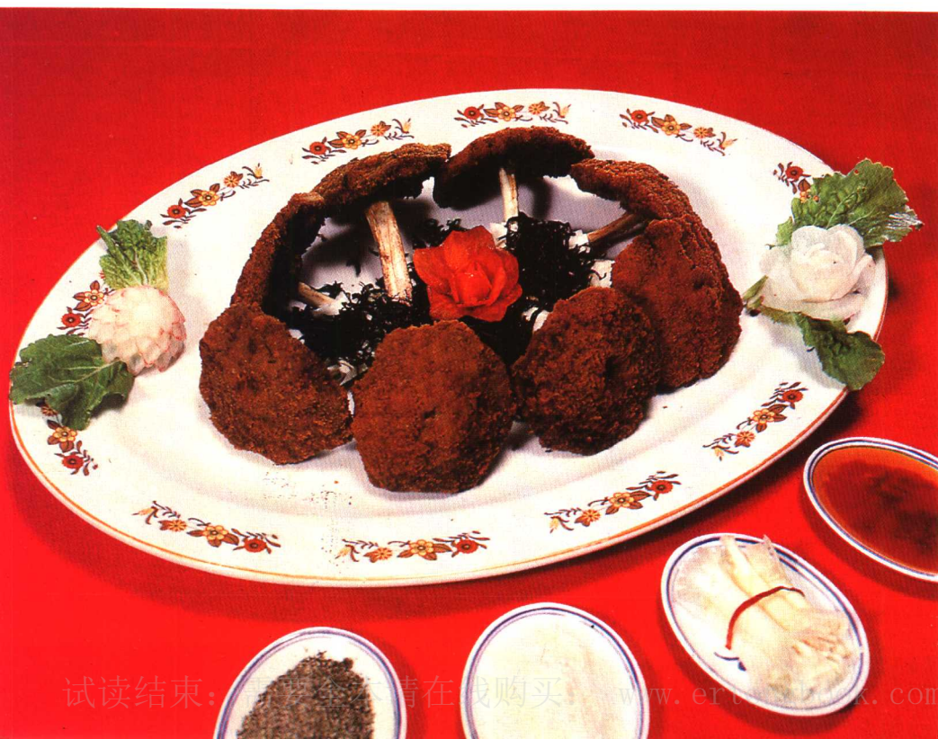
◁ 伞把排骨 见肉菜 77