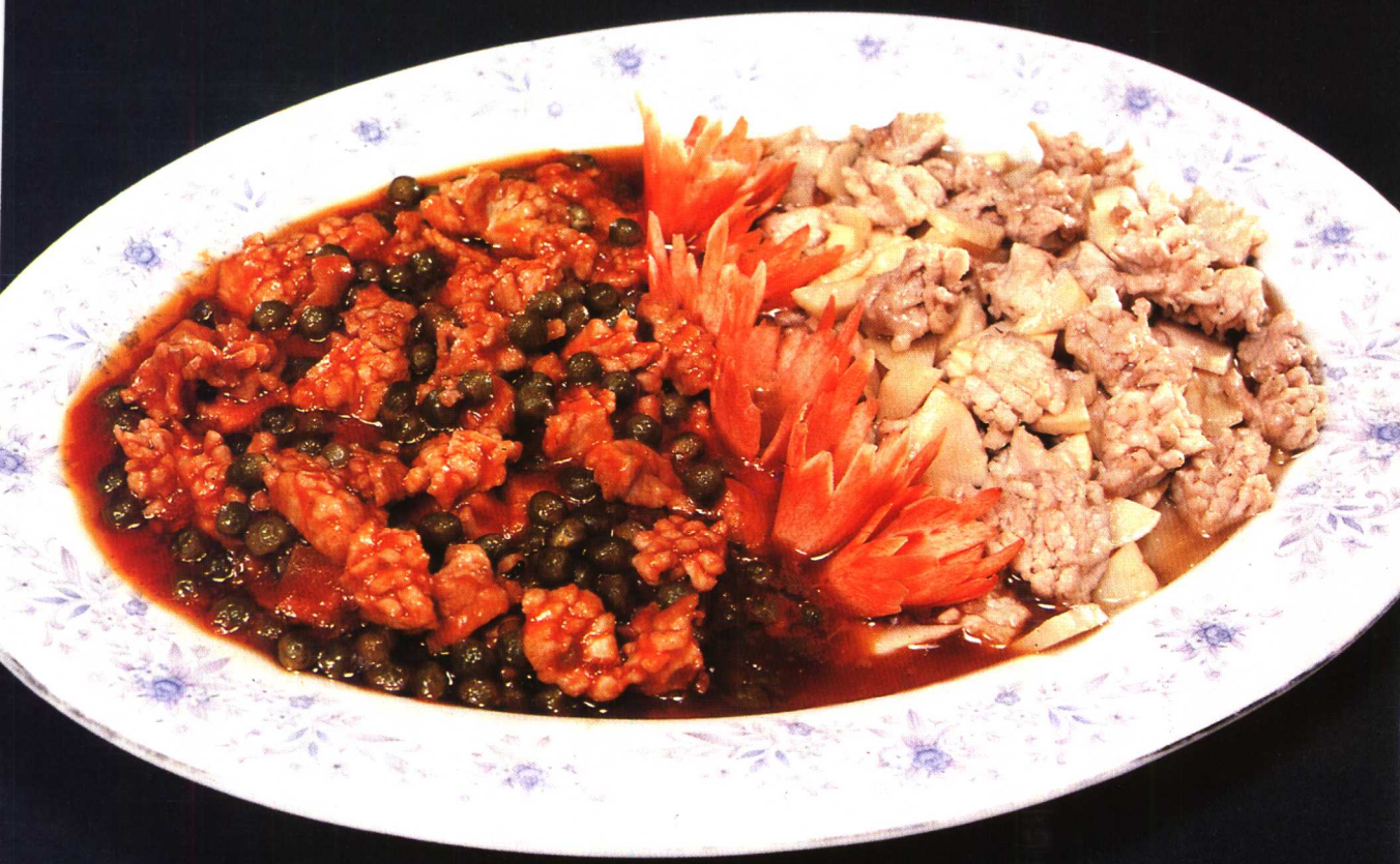
△ 油爆鸳鸯肚仁 见肉菜 101