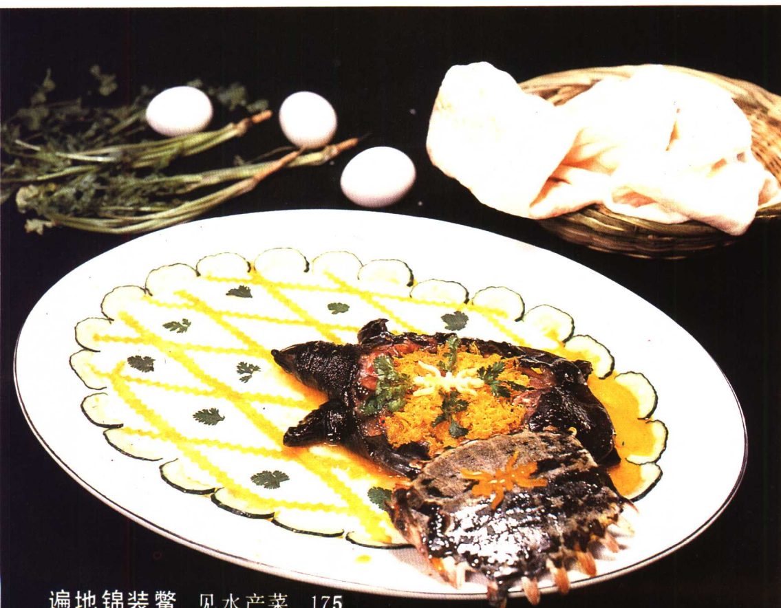
遍地锦装鳖 见水产菜 175