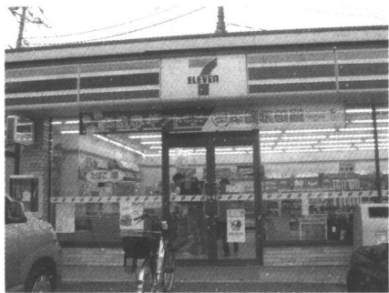
24 小时营业的便利店

从家到学校，大概有 40 分钟的车程，这在我们看来，已经相当远了。在中国的大学 H 大，我们都是住宿的，宿舍楼下来，后面是食堂，向左走，是打开水的锅炉房，再走，就是我们外语学院的教学楼，也就是我们的教室。教室出来，就是 H 大的大门，大门右侧，就是据说是省内藏书最多的图书馆。国内生活如此便利安逸，忽然把我们两眼一抹黑地扔到语言基本不通的异国他乡，生活谈何容