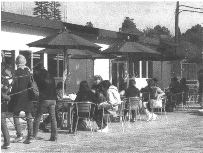
学校里的露天咖啡座

在上大学之前我们没有离开过家，在家里，自然也是不做家务的。上了大学以后，学校里有食堂。偶尔没赶上吃饭，或者不愿意吃食堂的时候，就下饭馆，或者在宿舍吃饼干、泡面凑合一顿。来日本之后，若说听不懂课还可以勉强滥竽充数的话，一日三餐成了我们最大