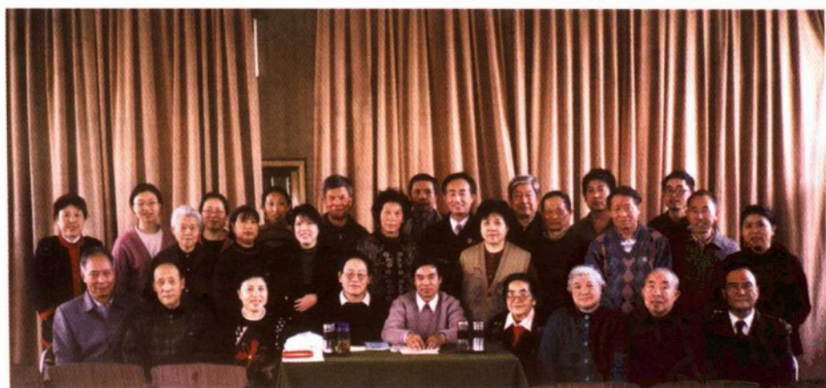
▲ 中国气功科学研究会功理功法委员会在北京举办“河图·洛书保健按摩绝技”学习班合影