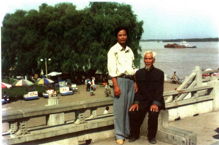
▲ 作者和92岁高龄的父亲合影