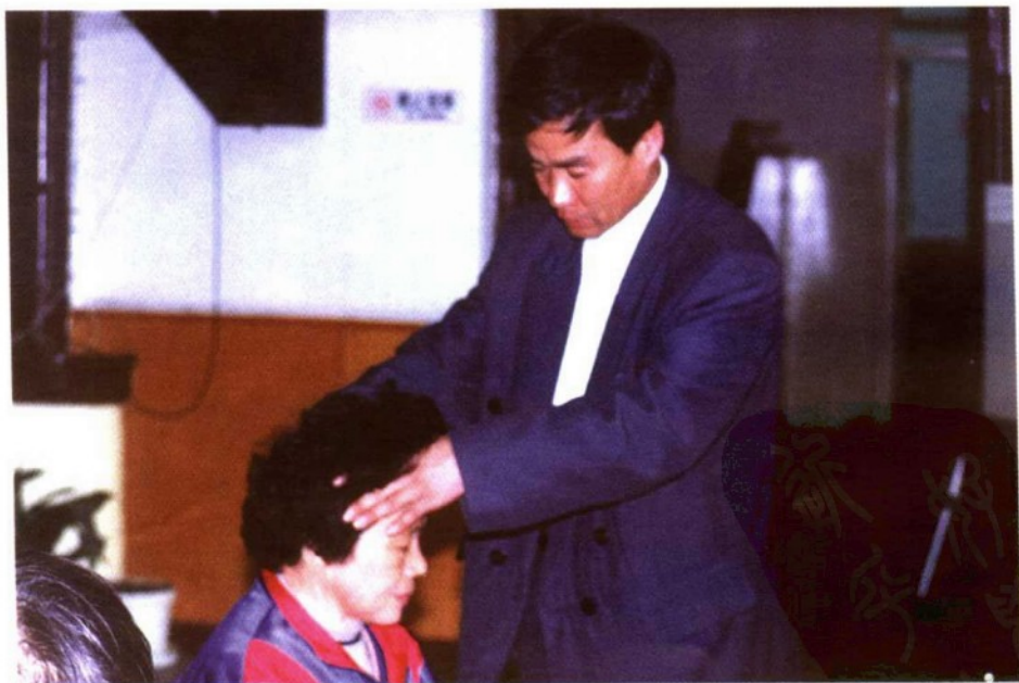
▲ 作者于1999年4月在国家体委老干部局活动中心为老干部义诊